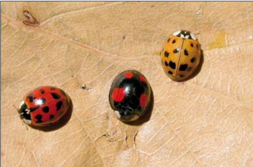
Abb. 3: Drei der häufigsten Formen auf einem Blatt!