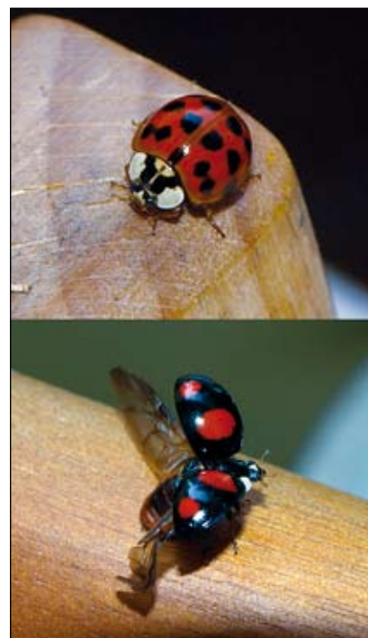
Abb. 2: Die bei uns häufigste Form hat rote Flügeldecken mit 19 schwarzen Punkten (oberes Bild). Eine der schwarzen Formen (unteres Bild) beim Abflug (Aufbruch in neue Gebiete?)