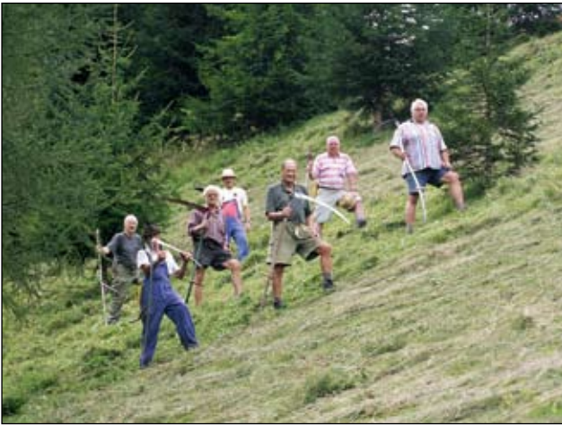
Abb. 15: Einige „unserer Sensenmänner“ (es gibt derzeit auch eine Frau) auf der steilen Zimmermannleitn.