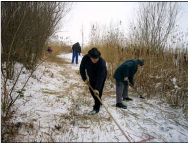
Abb. 32: Schilfmähaktion beim Ersatzbiotop, damit es noch lange als Laichgewässer für unsere Amphibien zur Verfügung steht.