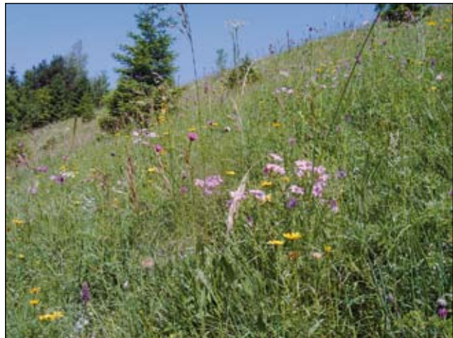
Abb. 12: Der Klebrige Lein und das Rindsauge sind nur einige der seltenen Blumen in diesem steilen Hang.

Diese Bemühungen wurden schon bald mit einem wunderschönen Blumenmeer belohnt. 2009 blühten ca. 400 Kalk-Glocken-Enziane, 8 Stück Fliegenragwurz, über 100 Stück Mücken-Händelwurz, 40 Stück Schmalblättriges Waldvöglein, Weiße Waldhyazinthe, Kamm-Hundswurz, Klebriger Lein, Rundköpfige Teufelskralle, Karthäuser-Nelke, Arznei-Primel, Schwarzwiolette Akelei, Rindsauge, Duft-Weißwurz, Kriech-Gipskraut, Buchs-Kreuzblume, Weiße Schwalbenwurz, Feuer-Lilie, Wiesen-Kreuzblume und viele mehr.