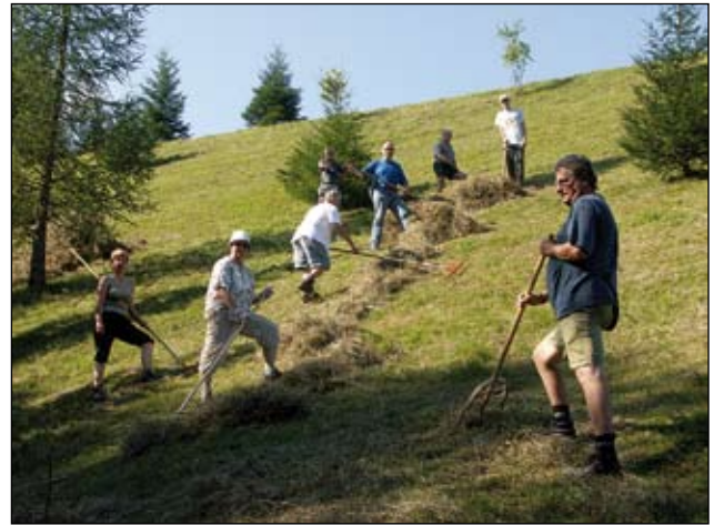
Abb. 16: Heuen am Steilhang ist meist auch mit einigen Rutschpartien verbunden.

Im Zuge unserer Arbeit wurden wir auf einen groben Missstand bei einem naheliegenden Absatzbecken aufmerksam gemacht! Die Teichfolie war weit über die Uferzone hinaus verlegt worden, was vielen Tieren zum Verhängnis wurde. Sie konnten nämlich wegen der glatten Beschaffenheit der Folie diesen Bereich nicht überwinden und ertranken jämmerlich. Auf unseren Vorschlag wurden von der Gemeinde Vlies-Streifen angebracht, die nun als Ausstiegshilfe angenommen werden (Abb. 19).