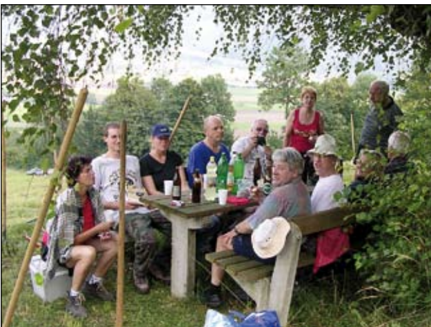
Abb. 30: „Og’heigt is“ („abgeheut“ ist es) - die Jause nach der Arbeit schmeckt umso besser.