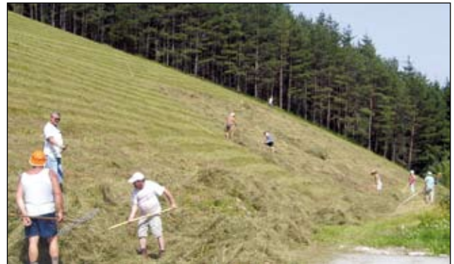
Abb. 18: Von der hinteren Hangwiese muss das Heu händisch für den Abtransport nach unten gebracht werden.