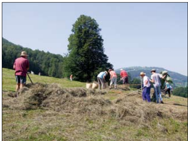
Abb. 24: Einige „Bergmandln“ bei der Heuarbeit auf der 1,6 ha großen „Pechmannwiese“.