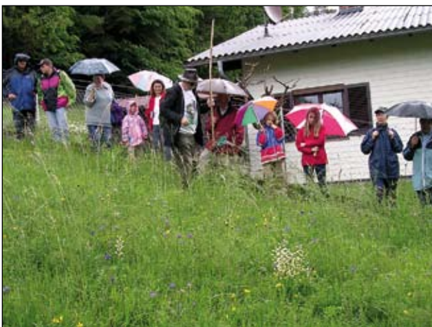
Abb. 34: Naturschutztagwanderung - hier die „Ferstlwiese“ - im Vordergrund das Schmalblättrige Waldvöglein.

Einen sozialen Akzent setzte unser Verein anlässlich einer Sammelaktion 2005 für die Landler in der Ukraine (Königsfeld). Wolfgang Starzinger, ein Zivildienstler aus Gmunden, hatte die Idee, Jugendlichen dort mit einem Wanderkino (Beamer, Video-DVD-