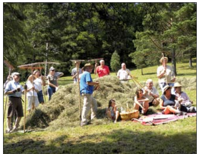
Abb. 10: Gruppenbild anlässlich eines Fototermins für den Tourismusverband bei der Heuernte 2009.