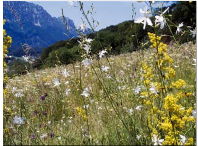
Abb. 8: Selbiges Wiesenstück Ende Juni kurz vor der Mahd mit Rispen-Graslilie und Echem Labkraut.

benötigten wir natürlich auch Werkzeuge wie Sensen, Heurechen und Heugabeln sowie mindestens einen kleinen Balkenmäher (90cm Balkenbreite) mit Zwillingrädern zwecks Standfestigkeit auf unseren steilen Wiesen. Die finanziellen Mittel waren am Anfang nicht leicht aufzutreiben, doch die Naturschutzabteilung des Landes Oberösterreich und die Marktgemeinde Micheldorf gaben uns die entsprechende Starthilfe. Ich stellte auch meine Gerätschaften, die ich zur Pflege des „Himmelreichbiotopes“ angeschafft hatte, zur Verfügung.