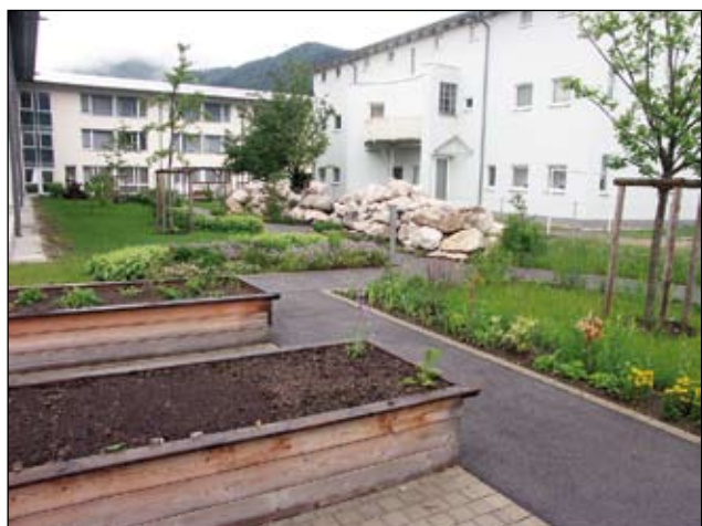
Abb. 35: Das Micheldorfer Alten- und Pflegeheim mit Hochbeeten, Blumenwiese, Obstbäumen und Steinschlichtung.