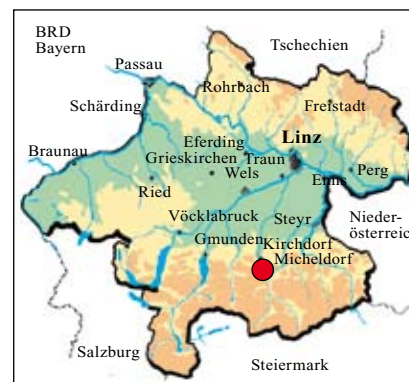
Abb. 1: Lage der Heimatgemeinde in Oberösterreich.

Wichtig ist uns daher neben der aktiven Arbeit im Sinne der manuellen oder maschinellen Pflege (Bewirtschaftung) vor allem die Beratung der Besitzer. Auch durch Ankauf oder Pacht mit all den daraus resultierenden Arbeiten (Renaturierung, Mähen usw.) kann im Einzelfall der Weiterbestand dieser ökologisch so bedeutenden