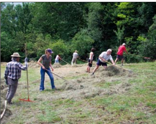
Abb. 9: Heueinsatz 2009 auf der nun doppelt großen Enzianwiese.

Zur Sanierung dieser 7000m 2 wurden über 200 Arbeitsstunden von den Vereinsmitgliedern aufgewendet, wobei 14 LKW-Fuhren „Abfälle“ (Äste, alter Grasschnitt) zur Kompostierung kamen. Es mussten dabei ca. 100 Bäumchen aller Größen entfernt werden, um wieder einen mähbaren Kalkmagerrasen zu erzielen.