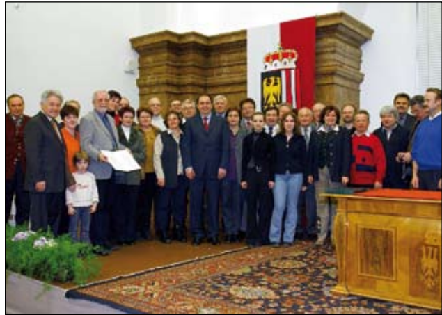
Abb. 41: Am 1. März 2004 erhielten wir für unsere Arbeit im Natur- und Artenschutz den Umweltschutzpreis des Landes Oberösterreich. Dies war auch unser erster gemeinsamer Ausflug.

Sowohl für verdiente Mitglieder, als auch für „Externe“ wird seit 2006 das „Bergmandl“, vergeben. Das ist eine Figur, die vom heimischen Holzschnitzer Johann Hinteregger 2005 kostenlos angefertigt und als