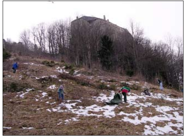
Abb. 37: Hier sind wir 2007 bei der Sanierung der sogenannten „Rastinger Leit'n“, unterhalb der Burg Altpernstein.

Player, Lautsprecher und Leinwand) auszuhelfen. Diese Gerätschaften wurden von uns gekauft und von mir bei der 200-Jahrfeier der Ländler in Königsfeld übergeben. 2007 konnte ich den Kinobetrieb bei einem weiteren Besuch im Freigelände der dortigen Schule erleben. Interessanterweise stammt ein Teil der Schulmöbel aus Kirchdorf und seit 2009 auch aus Windischgarsten.