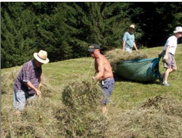
Abb. 38: Heuhilfe im Himmelreichbiotop - hier beim Austragen des Heues mit Planen.

nach Möglichkeit zu gewährleisten. Informations- und Überzeugungsarbeit über die Bedeutung einer artenreichen, vielfältigen Umwelt ist gerade in diesem Zusammenhang von wesentlicher Bedeutung. Zudem werden mit den Grundeigentümern Vereinbarungen über eine extensive Wiesenbewirtschaftung getroffen und dafür entsprechende Förderprogramme zielgerichtet eingesetzt. Bei den unmittelbar angrenzenden „Almtaler-Kirchdorfer Flyschbergen“ handelt es sich um ein Hügelland mit parallel zum Alpenrand verlaufenden Haupttälern. Auch hier ist die Tendenz zur landwirtschaftlichen Nutzungsaufgabe zu beobachten. Dadurch verschwinden kontinuierlich artenreiche Wiesen. Hier soll auch der landschaftstypische Grünlandanteil gesichert werden, insbesondere in den Steillagen und in den Verzahnungsbereichen mit dem Wald. Gleichermäßen sollen die reichhaltigen Landschaftsstrukturen erhalten werden. Über den landschaftlichen Charakter hinaus