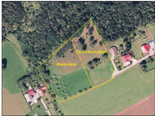
Abb. 4: Luftbild unserer Enzianwiese im Ortsteil Wienerweg. Man kann hier schön den dunklen, ehemals gedüngten Wirtschaftwiesenteil erkennen.

Landes durchaus im öffentlichen Interesse liegt.