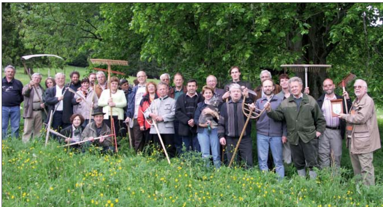
Abb. 2: Ein Gruppenbild anlässlich der Anbringung der Naturdenkmal-Tafel an der über 200 Jahre alten Linde.

Lebensräume gesichert werden. Die für diese Arbeiten notwendigen finanziellen Mittel können einerseits über EU- und Landesförderungen (ÖPUL-Programm, Landespflegeausgleich, Mittel für Biotopmanagement) oder über den Umweltausschuss der Marktgemeinde Micheldorf erbeten werden. Schließlich ist davon auszugehen, dass der Einsatz um die Erhaltung der Arten- und Lebensraumvielfalt unseres