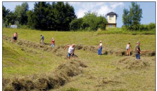
Abb. 17: Hier im Graben legt sich die Hitze besonders an, und wir sind immer froh, diesen Teil erledigt zu haben