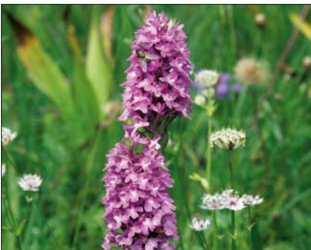
Abb. 13: Hier die Kamm Hundswurz, eine wunderschöne Orchidee und die Große Sterndolde in der hinteren Hangwiese.

Hier einige unserer Schutzbefohlenen: Schwarzwiolette Akelei, Karthäuser-Nelke, Wiesen-Kreuzblume, Europäische Trollblume, Rispen-Graslilie, Rindsauge, Prächtiges Manns-Knabenkraut, Mücken-Händelwurz, Kamm-Hundswurz, Klebriger Lein, Rundköpfige Teufelskralle, Arznei-Primel, Frühlings-Fingerkraut, Duft-Weißwurz, Echtes Labkraut, Kiel-Lauch, Nickendes Leimkraut, Feuer-Lilie und andere.