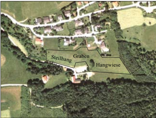
Abb. 11: Luftbild der „Zimmermannwiese“ im Ortsteil Wienerweg.