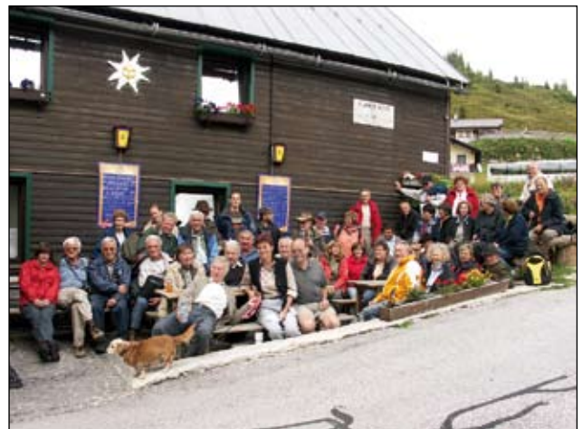
Abb. 39: Die Vereinsmitglieder beim Ausflug 2008 auf die Planner-Alm bei Donnersbach.