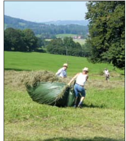
Abb. 25-27: Mit Planen wird das halbtrocknete Gras aus dem hügeligen Teil abtransportiert, um auf einer ebenen Fläche wieder ausbreitet zu werden. Hier liegt es nun für die weitere maschinelle Bearbeitung der Bauernfamilie Grall vulgo Zeisel bereit.

9 solcher Einsätze sind für die schönen Blumenwiesen nötig.