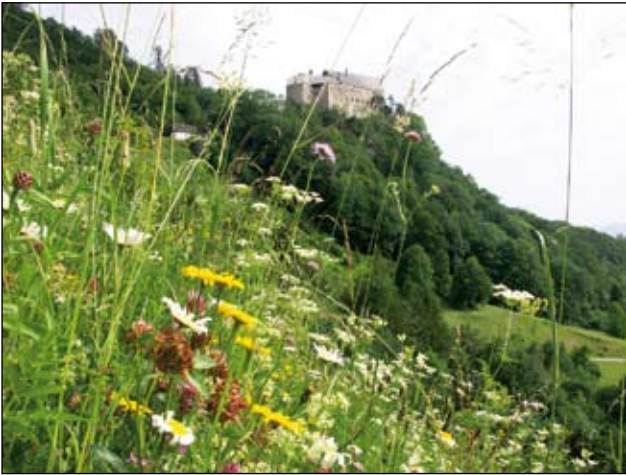
Abb. 36: Blick aus einer der geschützten Wiesen auf die Burg Altpernstein.