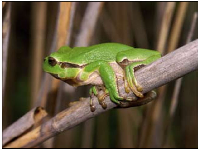
Abb. 33: Dem Europäischen Laubfrosch ( Hyla arborea ) - hier im Oberen Kremstal - gilt unser besonderer Schutz.

Asthaufen und der Errichtung von etlichen Steinschlichtungen (Tondachziegel) konnten den Amphibien mehr Unterschlupfmöglichkeiten im neuen Biotop geschaffen werden.