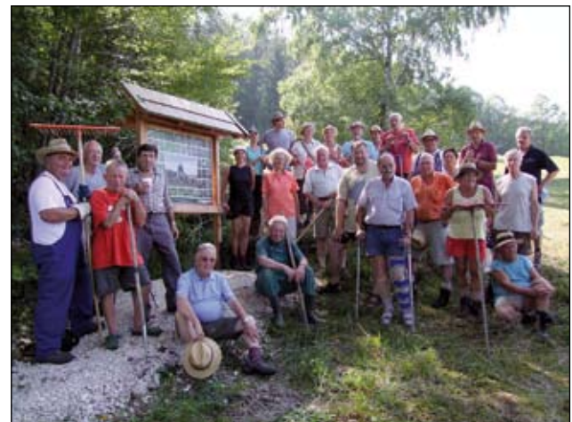
Abb. 31: Gruppenbild nach dem Heuen 2009 bei der neuen Infotafel auf der „Pechmannwiese“.