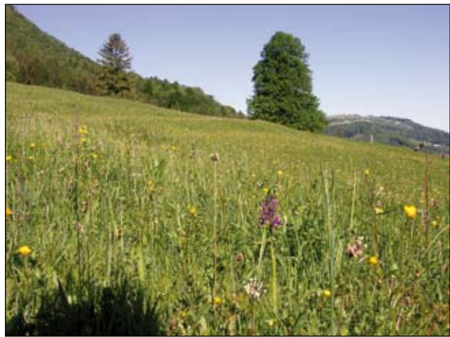
Abb. 22: Die bereits vom Aussterben bedrohte Kleine Hundswurz ( Anacamptis morio ) blüht in dieser Wiese mit weiteren Orchideen.