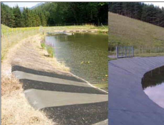
Abb. 19: Das Absatzbecken links jetzt mit Vliesstreifen als Ausstiegshilfe - rechts noch ohne und für viele Tiere tödlich.