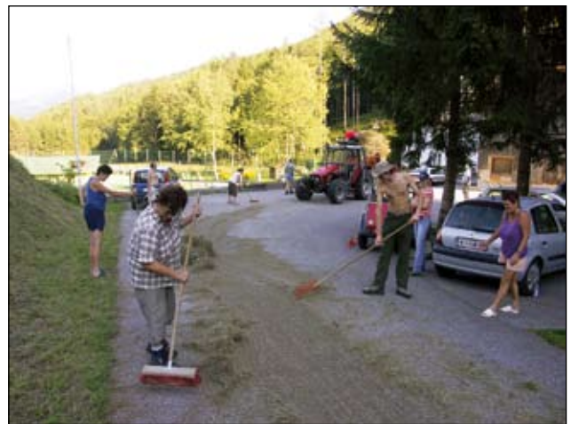
Abb. 20: Nach der letzten Fuhre Heu muss natürlich die Straße gesäubert werden.