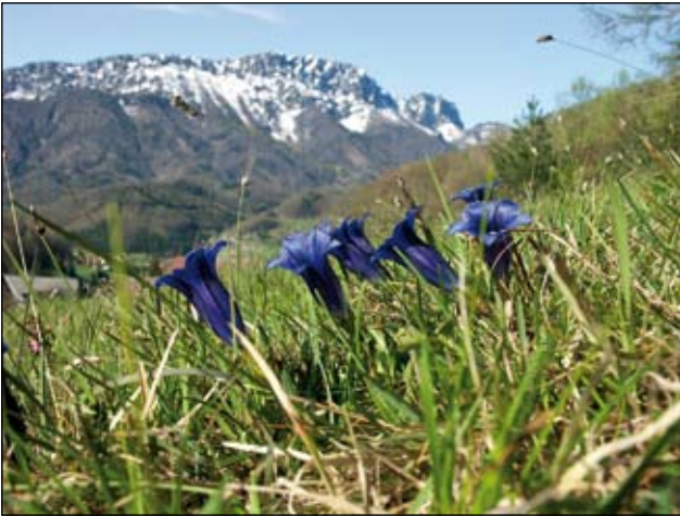
Abb. 7: Die Enzianblüte Anfang Mai eröffnet den Blütenreigen. Im Hintergrund die Kremsmauer (1600m).