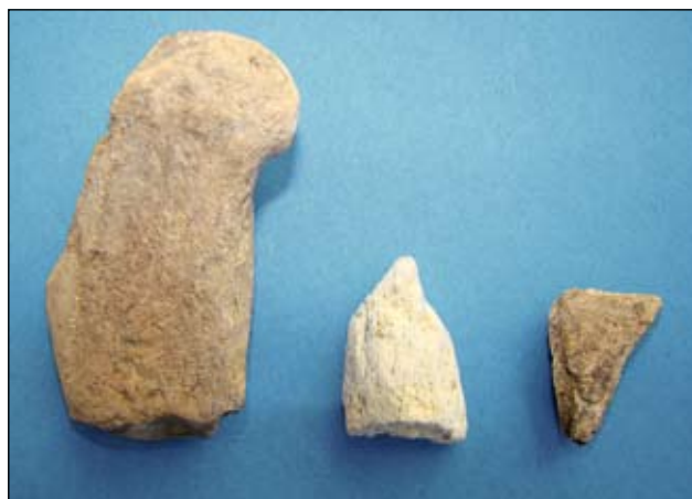
Abb. 9: Auswahl organischer Lesefunde: Schaber oder Glätter aus Bein - geschnittzte Spitze aus Elfenbein - Fragment eines Knochenpfriems

neten. Er bevorzugte zähe und harte Mineralien und Gesteine, die beim Abschlagen muschelig brechen und scharfe Kanten bilden. Es handelt sich dabei meist um Silikatgestein in verschiedenen Zusammensetzungen. Als Sammelbegriff ist dafür der Ausdruck „Silex“ geläufig.