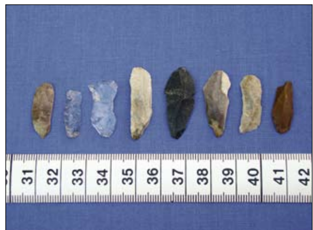
Abb. 7: Kleine Klingen und Lamellen