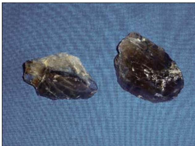
Abb. 8: Kratzer aus Rauchquarz