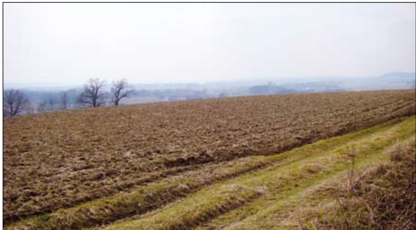
Abb. 2: Blick auf die Fundstelle nach Südwest

Bisher liegen im österreichischen Donaunraum paläolithische Freiland-