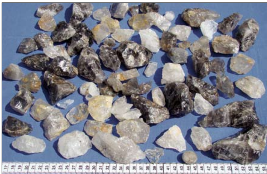
Abb. 3: Rauchquarz- und Bergkristallstücke von der Fundstelle

Im Zuge von gezielten Geländebegehungen ist mir Ende 1987 die Entdeckung der ersten eiszeitlichen Jägerstation auf oberösterreichischem Boden geglückt.