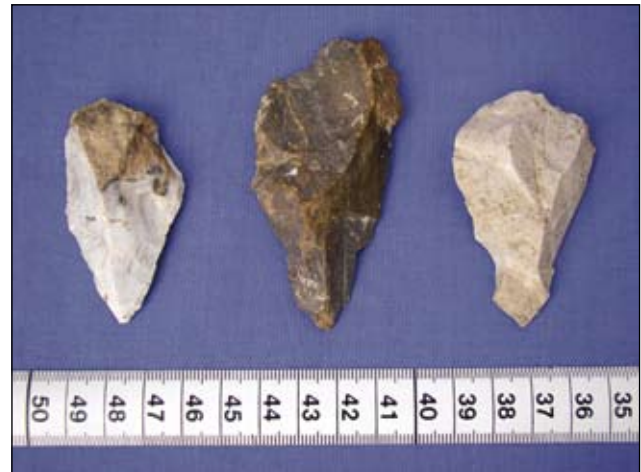
Abb. 5: Spitzen

Die häufigsten erhalten gebliebenen Hinterlassenschaften unserer Vorfahr-