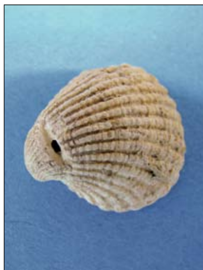
Abb. 10: Tertiäre Muschel mit Schlitzlochung

Es wurde auch der Nachweis erbracht, dass bereits im Jungpaläolithikum über weite Strecken wertvolles Roh-