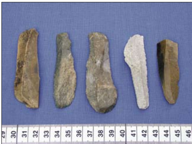
Abb. 6: Klingen

Der eiszeitliche Mensch wusste aus Erfahrung sehr genau, welche Gesteinsarten sich besonders zur Herstellung von Steingeräten eig-