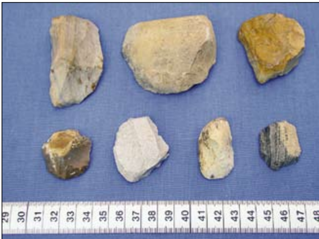
Abb. 4: Kratzer

Dieser erhöhte Platz bot den Menschen relative Sicherheit und eignete sich vortrefflich zum Beobachten der Wildtiere im dort breiten, seinerzeit mit vielen verzweigten Flussläufen durchzogenen Donautal. Unweit der Station verlassen Aist und Naarn, von Norden kommend, das Hügelland des Unteren Mühlviertels.