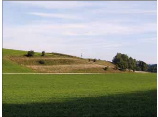
Abb. 4: Letzte Reste magerer Wiesen liegen fast nur mehr an steilen Terrassenkanten und Steilhängen, wo sie allerdings kaum mehr als Grünland genutzt werden, verbrachen oder aufgeforstet werden.

* (sicher meist unbeabsichtigte) Nährstoffeinträge aus angrenzenden Flächen