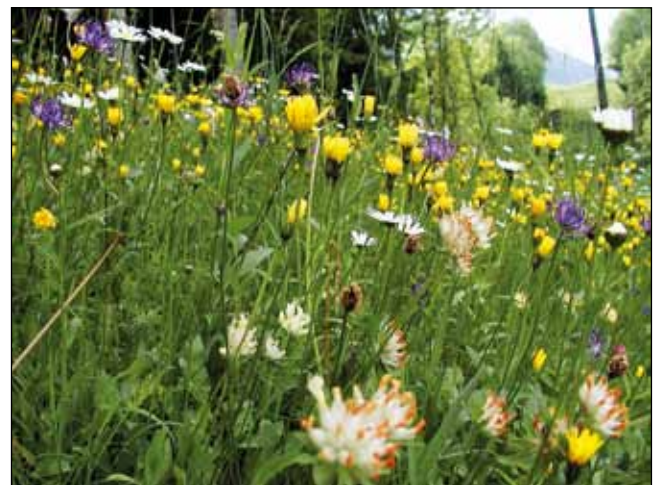
Abb. 2: Blütenreiche Wiesen wurden in der Vergangenheit allenfalls sporadisch mit Naturdünger gedüngt.