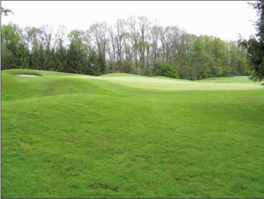
Abb.13: Golfplätze bleiben nur mit Hilfe hoher Düngergaben und Bewässerung „schön“ grün.

gedeihen können, wenn ausreichend Nährstoffe und Wasserversorgung im Boden vorhanden sind) immer stärker. Jene an Wasser- und Nährstoffarmut angepassten Arten sind an solchen Standorten nicht mehr konkurrenzfähig und verschwinden. Dabei sind es aber in der Regel nicht direkt die Nährstoffe, die von den Hungerkünstlern nicht „ertragen“ werden – vielmehr wird ihnen durch das üppige und hohe Wachstum der anspruchsvolleren, nährstoffbedürftigen Arten durch Lichtentzug und Konkurrenz im Wurzelraum keine Chance mehr