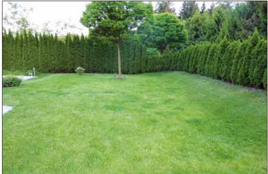
Abb. 11: „Monokultur Mühlbergensis“ nach Eigendefinition eines guten Freundes des Autors, der (vorläufig noch ☺) auf Ökologie pfeift. Die Instandhaltung eines kräuterfreien Turbo-Rasens ist für ihn eine Herausforderung mit meditativer Komponente.

Verantwortlich dafür ist der Umstand, dass einerseits über die landwirtschaftliche Tierhaltung viel Ammoniak freigesetzt wird, andererseits durch Industrie und Verkehr Unmengen an Stickoxiden in die Luft geblasen werden. Durch Fernverfrachtung kann dieser Dünger über hunderte Kilometer durch die Luft transportiert werden und selbst in den abgelegensten Gebieten wieder in den Boden gelangen. Dadurch leiden sogar die heute nährstoffärmsten Lebensräume unserer Breiten, nämlich unsere Hochmoore, bereits an einem Nährstoffüberschuss, der sich über kurz oder lang in einer Veränderung der dortigen,