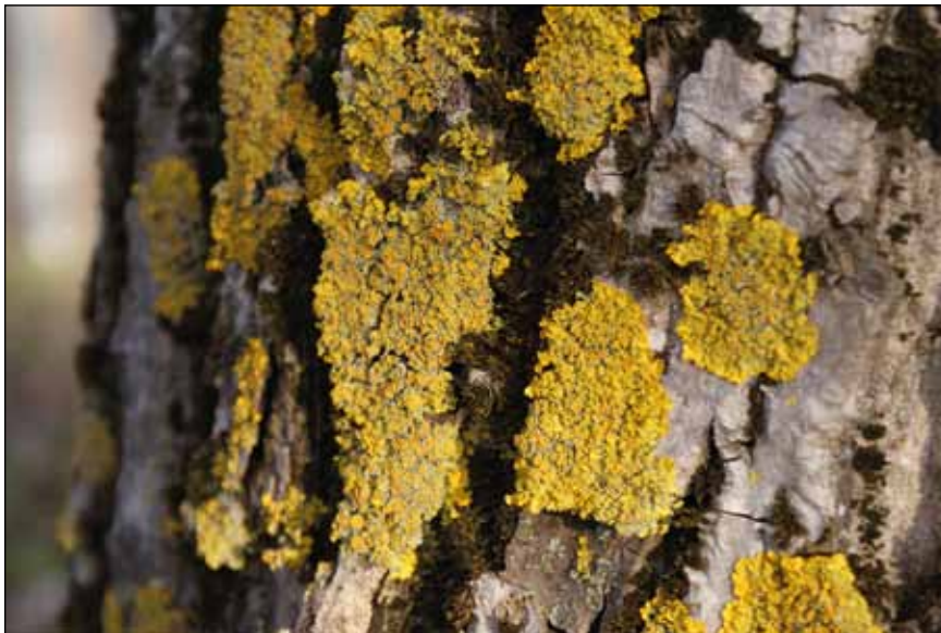
Abb. 15: Hohe Nährstoffeinträge aus der Luft führten in den letzten Jahrzehnten zu einer deutlichen Zunahme weniger Flechtenarten, wie etwa Xanthoria parietina , auf Kosten vieler.

Roman Türk). Die Eutrophierung in Hochmooren führte bereits zum Einwandern hochmoorfremder Arten wie Weidenröschen und Ohrweide (GREIF 2006) und wird selbst hier auf kurz oder lang die Vegetation maßgeblich verändern.