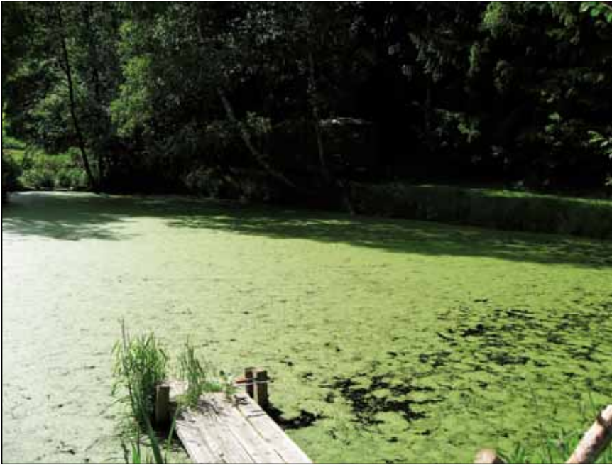
Abb. 7: Zuflussarme Fischteiche im Umfeld agrarischer Nutzungen sind zu eutrophen und manchmal übelriechenden Gewässern geworden.

das Pyrenäen-Löffelkraut ( Cochlearia pyrenaica ) als die erste charakteristische Quellart in Oberösterreich vor wenigen Jahren wahrscheinlich ein Opfer des Nährstoffüberangebotes im Quellwasser (in Oö. ausgestorben, in Bayern und dem restlichen Österreich kurz davor). Echte und Kleinblättrige Brunnenkresse ( Nasturtium officinalis und microphyllum , Abb. 8) sind die nächsten Kandidaten (Gefährdungsstufe 2 bzw. 3).