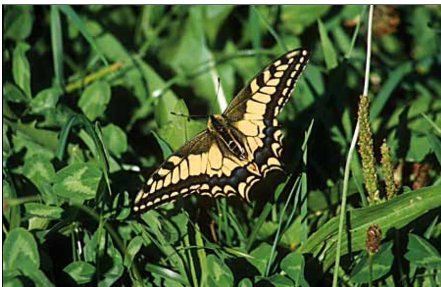
Abb. 16: Der allseits bekannte Schwalbenschwanz war einst auf nährstoffarmen Wiesen weit verbreitet.

Schon 1993 berichtet REICHHOLF über den Zusammenhang massiver Nährstoffeinträge aus den verschiedenen Quellen und dem Rückgang des Mai-