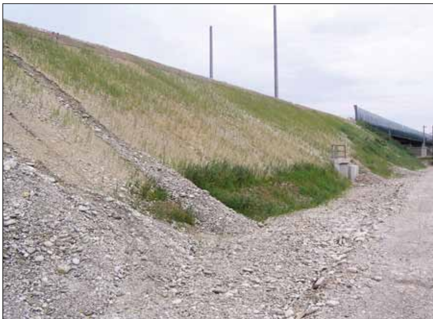
Abb. 9: Humusarme und humuslose Begrünungen, wie hier entlang der Umfahrung Enns, wurden in den letzten Jahren nur auf Druck des behördlichen Naturschutzes angelegt.