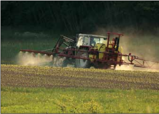
Abb. 3: Maschinen, Herbizide und Kunstdünger sichern seit der Mitte des 20. Jahrhunderts bis heute unsere Nahrungsmittelversorgung, verwandelten jedoch auch die damals noch artenreiche Kulturlandschaft in eine artenarme „Hightech-Agrarlandschaft“