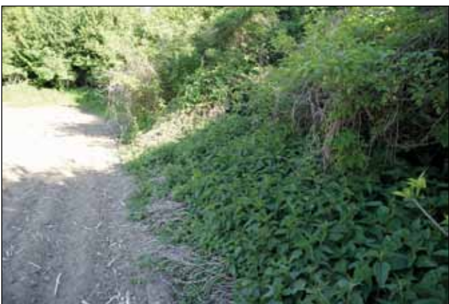
Abb. 5: Bachsäume in Agrarlandschaften werden von stickstoffreichen Hochstaudenfluren begleitet.

leidern unter einem hohen sauerstoffzehrenden Nährstoffgehalt (Abb. 7). Nur wenn die Teiche durch Quellen direkt gespeist, vom Wasser durchflossen oder künstlich belüftet werden, eignen sie sich auch für anspruchsvolle Fischarten. Doch selbst unser Grundwasser in der breiten Molassezone (aus dem die Quellen in den Tälern des Alpenvorlandes ja gespeist werden), leidet unter hohem Nährstoffgehalt. So waren es beispielsweise gerade die Nitrat-Werte im Trinkwasser, die für 32,4 % aller Grenzwertüberschreitungen im Jahr 2006 verantwortlich waren - die meisten davon in der oberösterreichischen Traun-Enns-Platte (HÄSSLINGER u. a. 2008). Durch intensive Bemühungen seitens der Landwirtschaft und der Trinkwasserwirtschaft hat sich die Grundwasserbelastung in den letzten Jahren aber deutlich entspannt und Grenzwertüberschreitungen treten selbst in der Traun-Enns-Platte nur mehr untergeordnet auf! Dennoch wurde beispielsweise