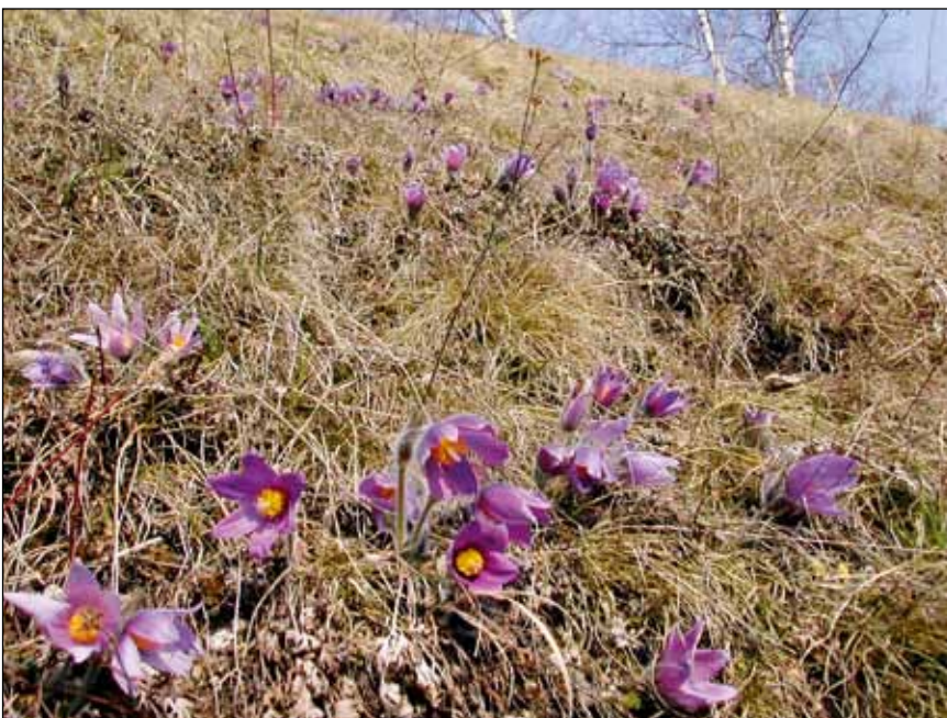
Abb. 14: Kuschellen auf Magerrasen waren vor der Verbreitung des Kunstdüngers im Oö. Zentralraum weit verbreitet.

Durch Nährstoffeinträge aus der Luft sind insbesondere Flechten gefährdet. Nach 1995 breiteten sich in Industriegebieten und Städten „speziell nitrophile oder zumindest eutrophierungstolerante Flechtenarten“ aus (FRAHM 2006). Der allgegenwärtige flächige Stickoxydeintrag aus dem Straßenverkehr hat zu einer auffälligen Begünstigung und damit zu einer Verschiebung des Artenspektrums hin zu nitrophileren Flechten, wie etwa Xanthoria parietina (Abb. 15) geführt (BERGER u. a. 2009). Viele Arten der Gattungen Nephroma , Peltigera , Usnea , Lobaria und andere sind schon großflächig innerhalb der letzten 20 Jahre ausgestorben bzw. vom Aussterben bedroht (mündl.