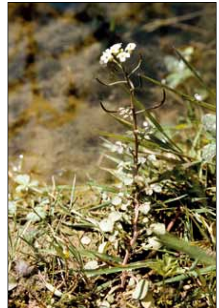
Abb. 8: Die Braune Brunnenkresse ( Nasturtium microphyllum ) ist wie ihre Verwandte die Echte Brunnenkresse ( Nasturtium officinale ) an klare, nährstoffarme Quellgewässer gebunden und daher nur mehr in wenigen Gebieten Oberösterreichs anzutreffen.

Grünflächen, aber auch Hecken (Abb. 10) im Bereich von Schulen und Krankenanstalten oder sonstigen öffentlichen Einrichtungen werden