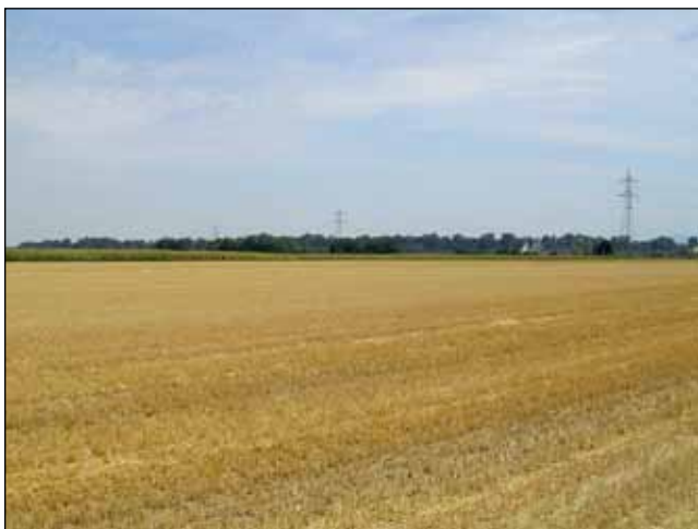
Abb. 1: Landwirtschaftlich intensiv genutzte Ackerbaulandschaft auf der Ager-Niederterrasse bei Redlham