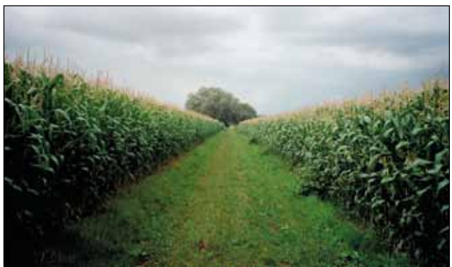
Abb. 6: Den in der modernen Landwirtschaft hohen Düngermengen sind die meisten natürlich vorkommenden Pflanzenarten nicht mehr gewachsen, weshalb Randstrukturen artenarm geworden sind.