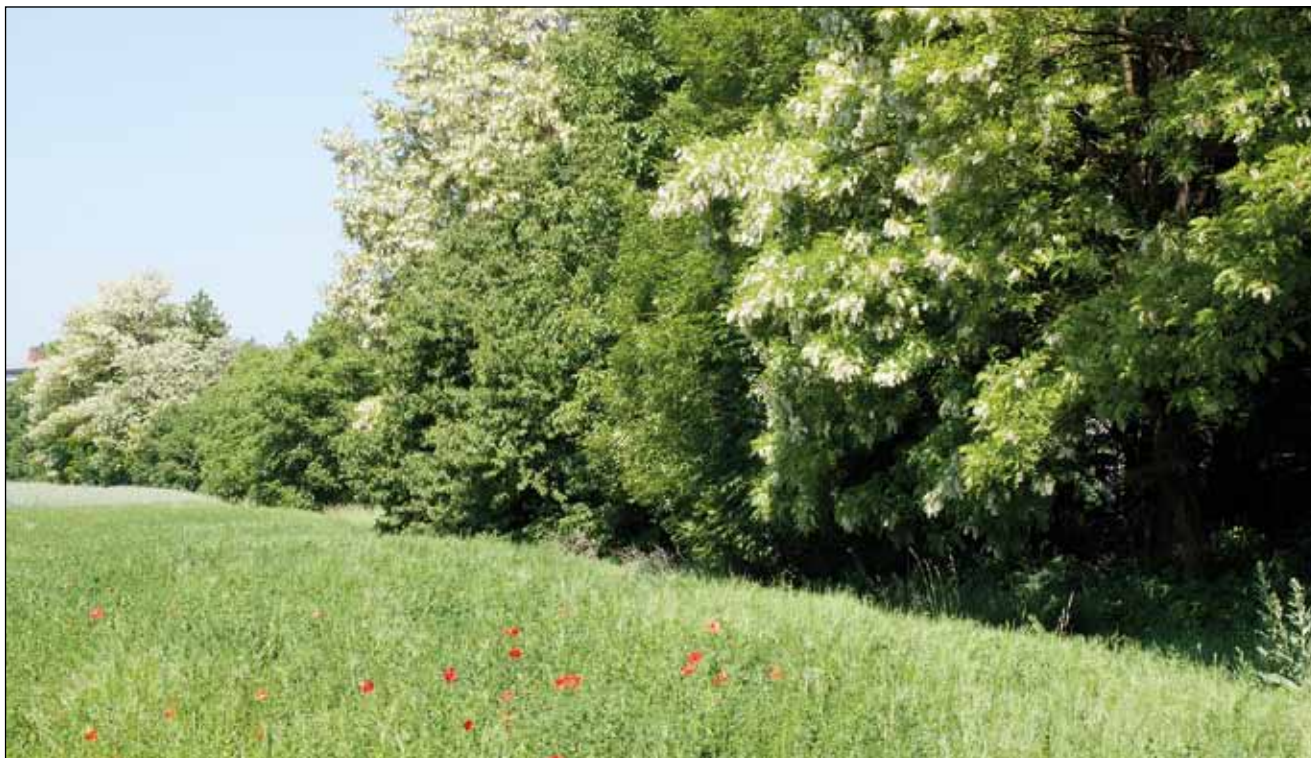
Abb. 17: Robinien ( Robinia pseudoacacia ) können mit Hilfe von Knöllchenbakterien Luftstickstoff binden, weshalb sie nicht nur zur Verbuschung von Magerstandorten beiträgt sondern diese auch gleich eutrophiert.

bewusstsein und der Bereitschaft all jener eutrophiler Landnutzer, die in ihrem Wirkungsbereich liegenden Grünflächen trotz fehlender wirtschaftlicher Zwänge mit Hilfe von exorbitanten Nährstoffüberschüssen in einem Zustand ständiger Artenarmut halten. Damit sind die Besitzer und Verwalter öffentlicher Grünflächen, von Gewerbe- und Industriebetrieben sowie privater Gärten gemeint, nicht jedoch die Bauern, die ja keinem inneren, sondern einem äußeren Düngezwang unterliegen und darüber hinaus gelernt haben, mit Betriebsmitteln vernünftig zu haushalten. Eine Ausnahme bilden jene Vertreter der Landwirtschaft, die nicht erkennen wollen, dass der Kampf gegen „Blumenwiesen“ in Folge der Marginalität ihrer Vorkommen keine wirtschaftliche Komponente mehr besitzt (vgl. HUMER 2011).