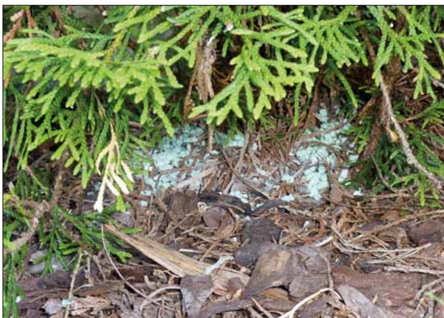
Abb. 10: Mit Grünkorn gedüngte Thujenhecke

Solche „eutrophistischen“ Gewohnheiten wurden seit den 1950er-Jahren von den meisten Gartenbesitzern schon derartig tradiert, dass sie aus Scham oder weil sie Furcht vor Unfreundlichkeiten oder gar Anzeigen haben, auf buntere, nutzungsintensivere, nährstoffärmere und in jedem Fall artenreichere Gärten verzichten. Dass sich viele dieser Menschen selbst als naturverbunden bezeichnen, zeigt, wie sehr ihr Selbstbild mittlerweile von der Wirklichkeit abweicht.