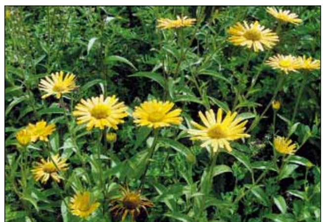
Abb. 4: Ochsenauge ( Buphtalmum salicifolium ). Anspruchsloser Dauerblüher auf sonnigen bis halbschattigen Standorten mit dekorativem Laub.