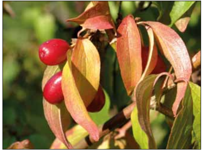
Abb. 12: Kornelkirsche, auch als Dirndlstrauch bekannt ( Cornus mas ). Im Alpenvorland und in den Kalkalpen an sonnig-warmen Standorten anzutreffen, fehlt in der Böhmisches Masse.

zu einem Verein zusammengeschlossen ( www.naturgarten-netzwerk.at , www.rewisa.at )