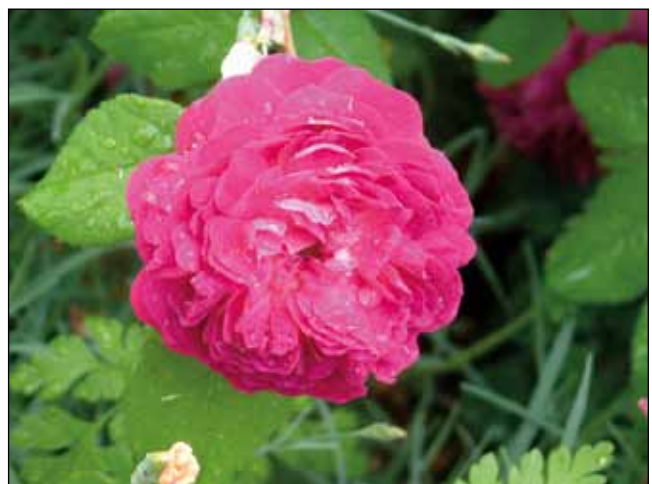
Abb. 14: Zuchtform einer Rose. An den Platz der Staubblätter sind zahlreiche Blütenblätter getreten. Die Folge: Keine Bienenweide, keine Hagebutten.