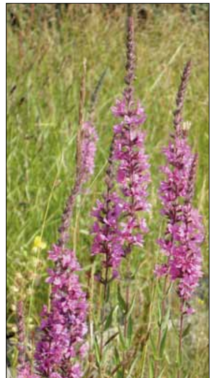
Abb. 6: Blutweiderich ( Lythrum salicaria ). Der Allrounder für den Spätsommer gedeiht auf feuchten bis trockenen und sonnigen bis halbschattigen Standorten. Starke Selbstaussaat, ohne dominant zu werden.

Wildform und Zuchtform: Sehr anschaulich kann der Unterschied an der Rose beschrieben werden. Wildrosen wie die Hundsrose ( Rosa canina – Abb. 13) weisen in der Regel einen Kranz von 5 Kronblättern auf, in den zahlreiche Staubblätter und ein Griffel eingebettet sind. Die Staubblätter sind die Nahrungsbasis für zahlreiche Arten von Wildbienen, Hummeln und Schmetterlingen und andererseits die Voraussetzung für die Ausbildung von Hagebutten, die wiederum Nahrung für verschiedene Vogel- und Säugetierarten sind – also Grundlage für eine hohe Artenvielfalt im Garten. Bei der Rosenzüchtung war über Jahrtausende ein Hauptziel, gefüllte Blüten zu erreichen. Dies wurde dadurch erreicht, dass Staubblätter in Blütenblätter umgewandelt wurden. Je erfolgreicher die Züchtung war, umso weniger sind Rosen als Nahrungsbasis für ihre traditionellen tierischen Besucher geeignet (Abb. 14).