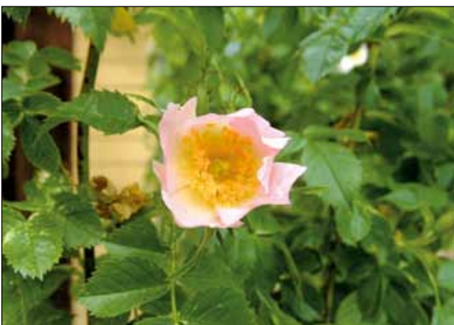
Abb. 13: Die Kronblätter ziehen Insekten an, die zahlreichen Staubblätter bieten reichlich Nahrung für Wildbienen. Einmalige üppige Blüte über mehrere Wochen im Mai bis Juni, im Herbst und Winter leuchtend-rote Hagebutten.

Aber auch unter den Zierpflanzen finden sich einige, die nicht zur Massenvermehrung neigen und keinen überbordenden Chemieeinsatz zu ihrem Fortkommen benötigen. Die Naturgartenbewegung formuliert als Ziel, den Anteil heimischer Wildpflanzen von derzeit häufig unter 10 % auf 90 % oder mehr zu erhöhen. Auf diese Weise bleibt immer noch Platz für Liebhaberpflanzen und gestalterische Effekte. In einem ersten Schritt kann die Anzahl heimischer Wildpflanzen um ein Vielfaches erhöht