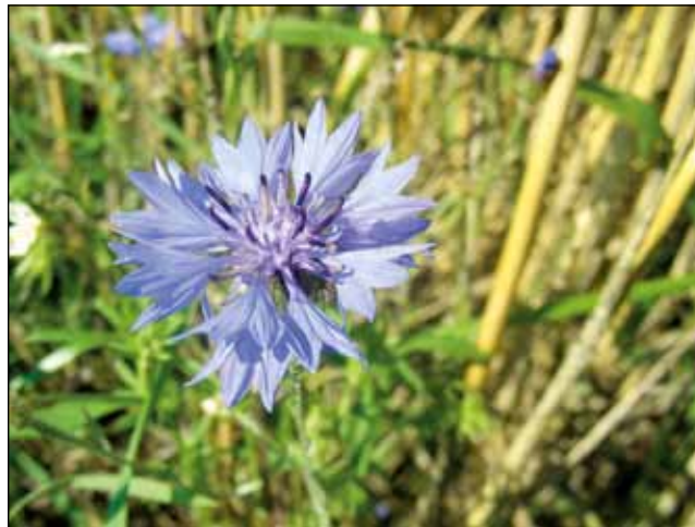
Abb. 8: Kornblume ( Cyanus segetum ), ehemals häufige Ackerbegleitpflanze, mittlerweile selten geworden. Kommt gut mit schotterigen Siedlungsstandorten zurecht.