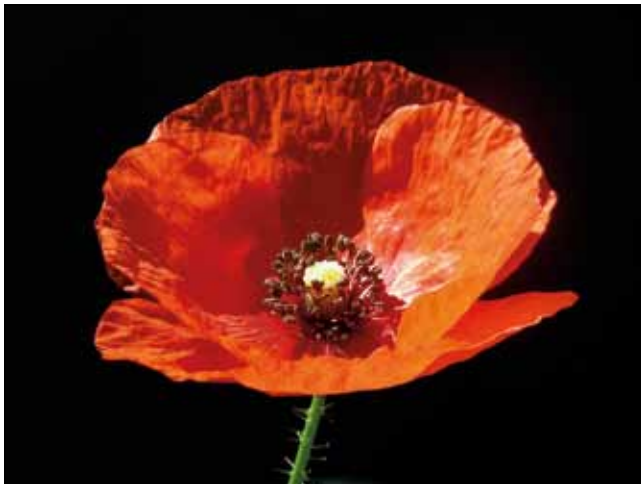
Abb. 7: Klatschmohn ( Papaver rhoeas ). Alteingebürgerte Ackerbegleitpflanze, die auf warmen Lehmböden prächtige Blühaspekte bilden kann und nach der Blüte attraktive Samenkapseln trägt.