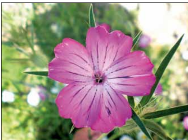
Abb. 9: Kornrade ( Agrostemma githago ). Einst ein gefürchtetes Ackerunkraut, wurde sie durch moderne Saatgutreinigung fast ausgerottet. Aufgrund ihrer raschen Keimung gut geeignet als Schnellbegrüner in Saatgutmischungen.

* Im vergangenen Jahr haben sich die Betriebe, die heimische Pflanzen produzieren oder mit diesen arbeiten, österreichweit zu Netzwerken zusammengeschlossen. REWISA (Regionale Wildpflanzen und Samen) ist die Vereinigung der Sammler und Vermehrer von Saatgut, Stauden und Gehölzen aus regionalen Herkünften. Im Naturgarten-Netzwerk sind Planer, Ausführungsbetriebe und Lieferanten