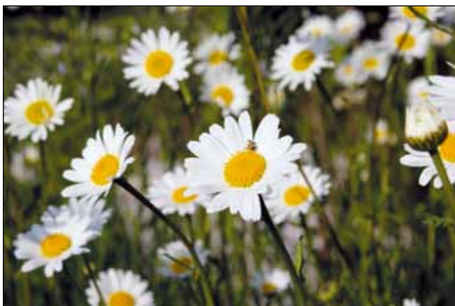
Abb. 3: Margerite – bekannteste heimische Wildpflanze für den Garten. Für unsere Freiräume sind zwei Arten geeignet, die nur bei genauerem Hinschauen unterschieden werden können: Leucanthemum vulgare und Leucanthemum ircutianum .

GartenbesitzerInnen nicht bekannt sind, ist es auch nicht weiter verwunderlich, dass Ochsenauge (Abb. 4), Rosenmalve (Abb. 5) und Blutweiderich (Abb. 6) in den Gärten so selten verwendet werden. So kommen wir zur nächsten Frage: Warum ist der Bekanntheitsgrad unserer Flora so gering? Doch bevor wir uns mit dieser Frage beschäftigen, ist eine kleine Begriffsklärung notwendig.