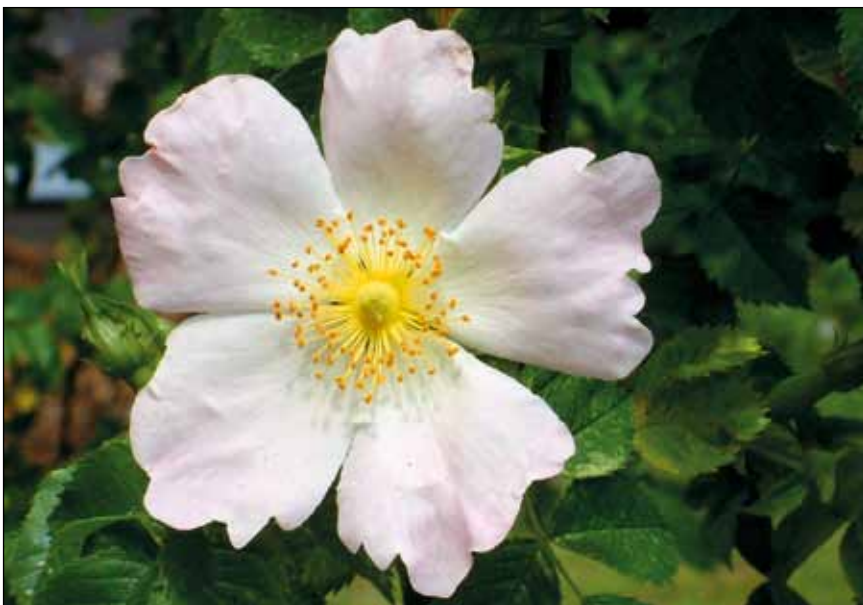
Abb. 1: Blüte der meistverbreiteten heimischen Wildrose – Hundsrose ( Rosa canina ).

Die Bekanntheit heimischer Pflanzen geht gegen null. Befragt nach der