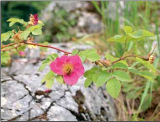
Abb. 11: Hängefruchtrose ( Rosa pendulina ). Natürliches Verbreitungsgebiet in den Kalkalpen und in der Böhmisches Masse, fehlt im Alpenvorland.