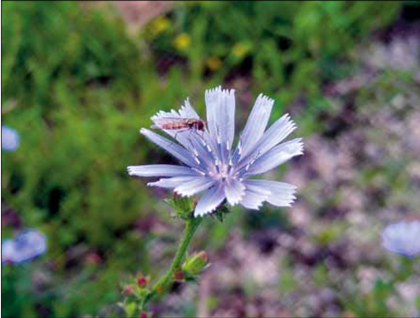
Abb. 15: Wegwarte ( Cychorium intybus ). Einst typische Wegrandpflanze, die von Juni bis Oktober blühte. Viele halten sie für die blaue Blume der Romantik. Mutterpflanze des Salats, die Wurzeln wurden bis zum Zweiten Weltkrieg als Kaffeeersatz verwendet. Arznei- und Zauberpflanze mit zahlreichen Zuschreibungen. Heute drauf und dran, aus unserem kulturellen Bewusstsein zu verschwinden.

werden, ohne auch nur auf eine einzige exotische Pflanze oder Zuchtform zu verzichten – einfach indem man die natürlichen Prinzipien der Bodenbedeckung mit Pflanzen und des Stockwerkbaus verfolgt und mehrere Schichten von Pflanzen übereinander wachsen lässt.