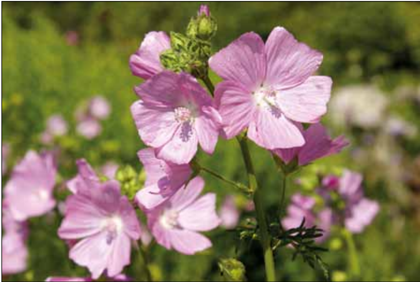
Abb. 5: Rosenmalve ( Malva alcea ). Attraktiver Dauerblüher im Hochsommer für sonnig-lehmige bis mäßig trockene Standorte.