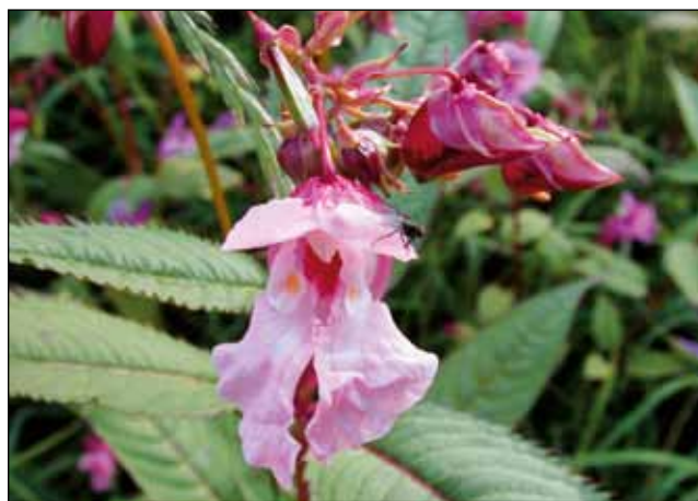
Abb. 10: Drüsen-Springkraut ( Impatiens glandulifera ), Ursprungsland Indien, im 19. Jahrhundert als Zierpflanze importiert. Einst eine beliebte Gartenpflanze, die sich in den letzten Jahren an feuchten, nährstoffreichen Waldrändern und Bachböschungen rasch ausbreitet und die heimische Flora verdrängt.