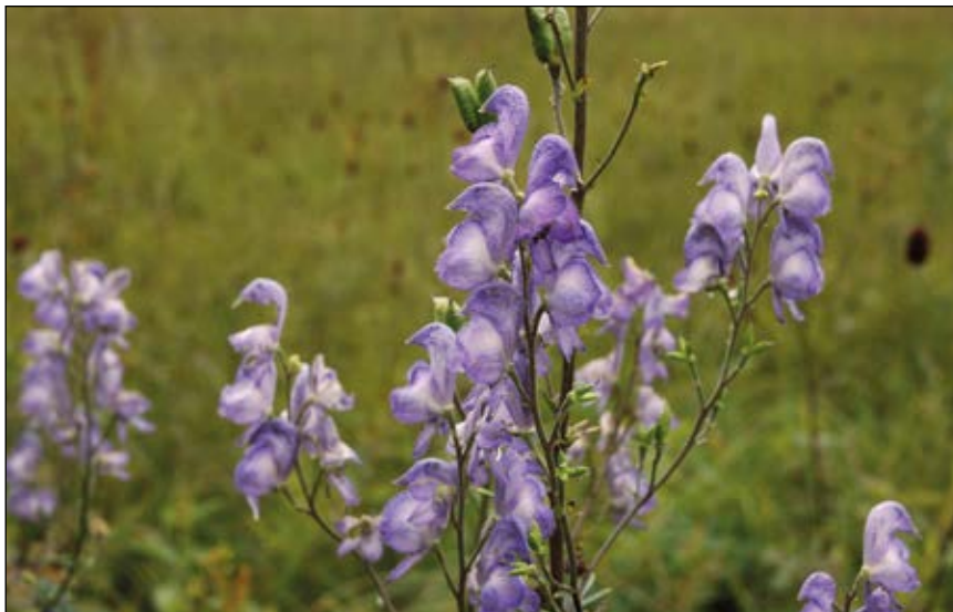
Abb. 6: Der Blaue Eisenhut ( Aconitum napellus ) – die wohl giftigste Pflanze Europas – von den Griechen „Königin der Gifte“ genannt“ (DÜLL u. KUTZELNIGG 2016) – Achtung beim Berühren mit der bloßen Hand, kann Entzündungen hervorrufen – hier als Seltenheit in Streuwiesen des Ibmermooses.

Dass auch das Gift von Tieren in dieser Zeit verwendet wurde, um Menschen zu töten, zeigt das Beispiel des Krötengiftes. Man extrahierte es, indem man eine Kröte (Abb. 7) in ein Säckchen mit ein wenig Salz gab. Für chronische Vergiftungen präparierte man Krötengift so, dass man das Tier einen halben Monat in dem Salz beließ. Italienische Giftmischer haben ein solches Krötengift für die langsame, das heißt wiederholte Vergiftung genutzt. „ Wer hiervon häufiger nähme, dem würden die Eingeweide verletzt, das Blut infiziert, und der Tod erfolge nach kurzer Zeit. “ Später bevorzugte man die schleichende Gabe von Blei (LEWIN 2007).