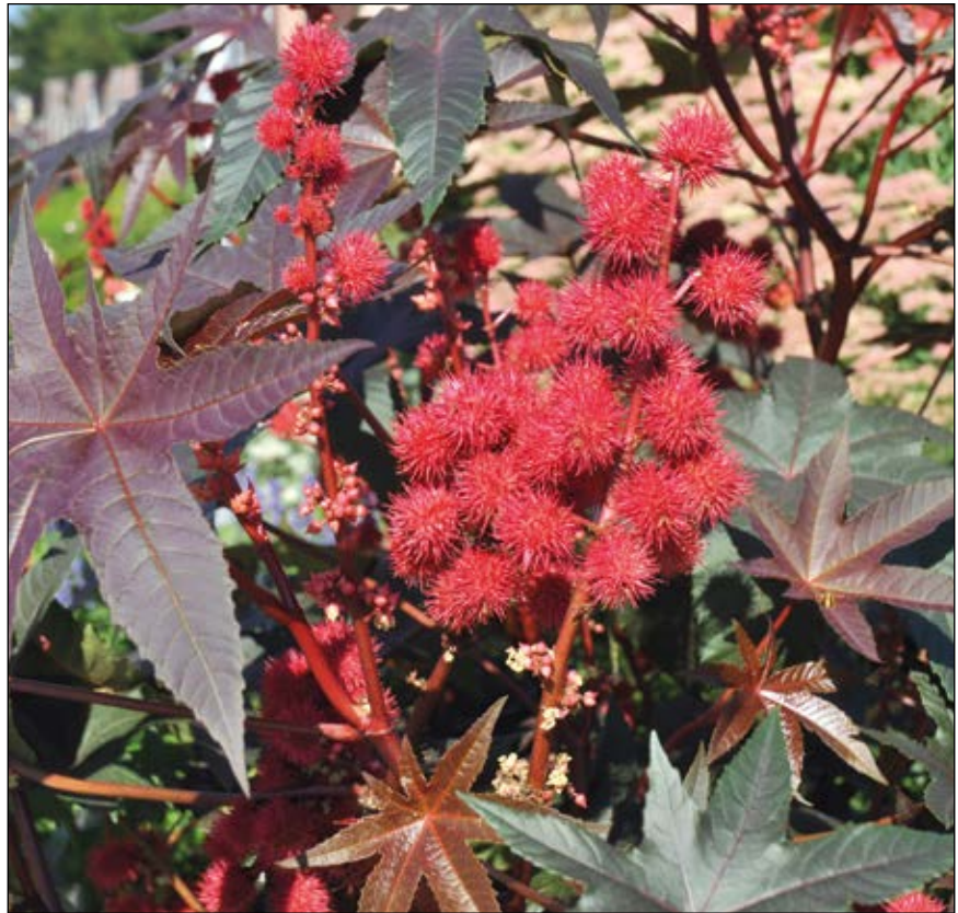
Abb. 46: Zählt zu den giftigsten Pflanzen in unseren Gärten – der Wunderbaum ( Ricinus communis ) – bei uns als Topfpflanze zu finden, gerne auch in Parks und auf öffentlichen Flächen gepflanzt. Wenige Samen genügen für tödliche Vergiftungen. Der Wunderbaum gehört aus dem kinderfreundlichen Garten verbannt!

Auf keinen Fall sollte man hochgiftige Exoten wie den Giftsumach ( Toxicodendron radicans – Abb. 52) in den Garten holen, wie es etwa in Graz geschah, wo zwei Kinder heftige Reaktionen durch Hautkontakt erlitten hatten. Die Pflanze stammt aus Nordamerika und sollte in Europa höchstens als Kuriosität in botanischen Gärten zu finden sein. Der Giftsumach, auch „Poison Ivy“ oder „Gift-Efeu“ genannt, ist eine Pflanze aus der Familie der Sumach-