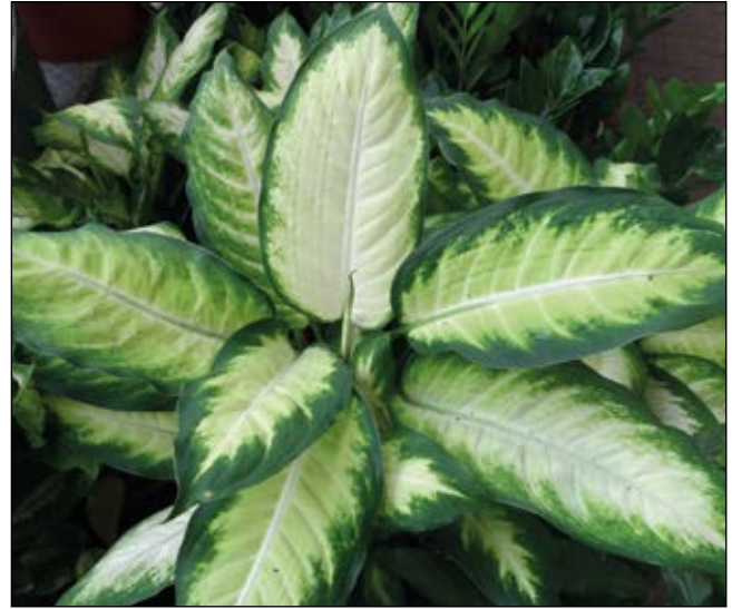
Abb. 53: Die Dieffenbachie ( Dieffenbachia spp.) – das Beispiel einer giftigen Hauspflanze – giftig zwar, aber für Kinder nicht wirklich gefährlich!

DÜLL R., KUTZELNIGG H. (2016): Taschenlexikon der Pflanzen Deutschlands und angrenzender Länder. 8., korrigierte und erweiterte Auflage. Wiebelsheim, Quelle & Meyer.