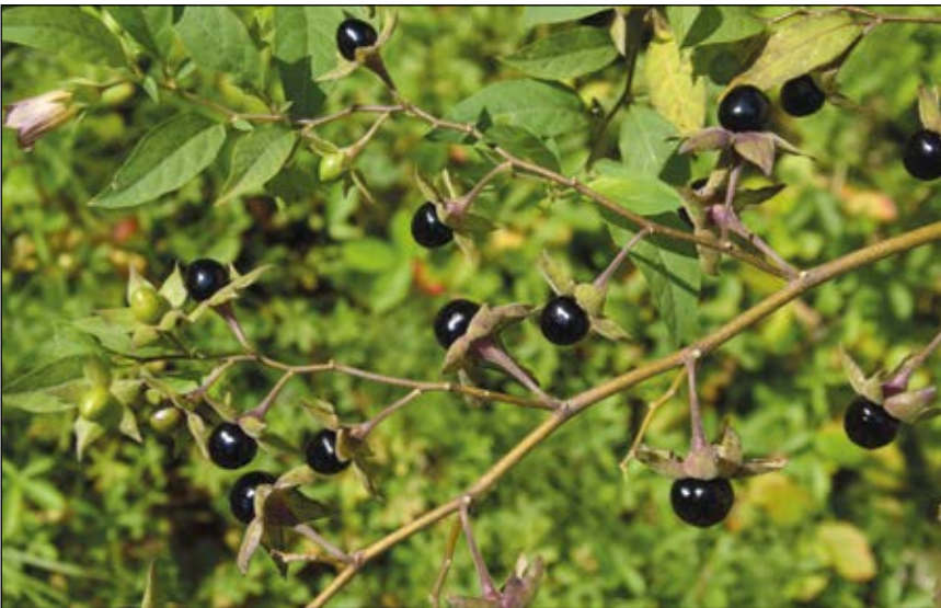
Abb. 4: Die Tollkirsche ( Atropa belladonna ) – das daraus gewonnene pupillenerweiternde giftige Alkaloid Atropin wurde lange Zeit von Augenärzten vor Untersuchungen eingetroppt – die Pflanze wächst gerne auf Waldschlägen und an Waldrändern.