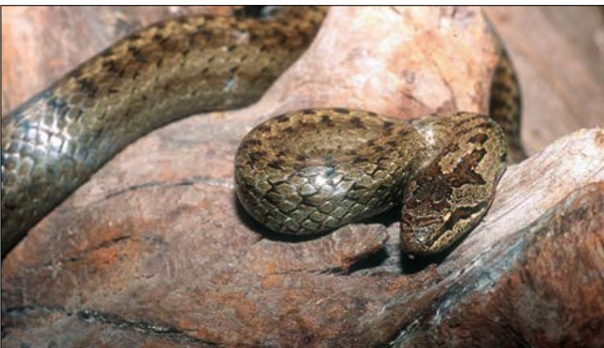
Abb. 18: Die Schlingnatter ( Coronella austriaca ) – streng geschützt – das harmlose Tier wird wegen seiner Ähnlichkeit mit der giftigen Kreuzotter oder aus prinzipiellem Schlangenhass verfolgt und trotz Verbot erschlagen.

Die Angst vor Spinnen (Abb. 17) und Schlangen (Abb. 18) scheint nach neuen Erkenntnissen angeboren zu sein und wird von ängstlichen Erwachsenen sicherlich verstärkt. Schon sechsmonatige Babys zeigen beim Anblick von Bildern dieser Tiere Stressreaktionen, berichten Forscher. Sie führen dies auf die lange Koexistenz der menschlichen Vorfahren mit Spinnen und Schlangen von 40 bis 60 Millionen Jahren zurück (HÖHL u. a. 2017).