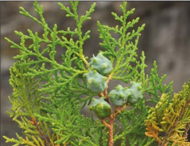
Abb. 44: Alle Thujen (auch Lebensbäume genannt) sind wegen des Gehaltes an Thujon stark giftig – besonders häufig in unseren Gärten – wegen der Unauffälligkeit aber kaum Gefahr für Kinder – hier der Morgenländische Lebensbaum ( Thuja orientalis ) an Mauern der Burgruine Hinterhaus bei Spitz.