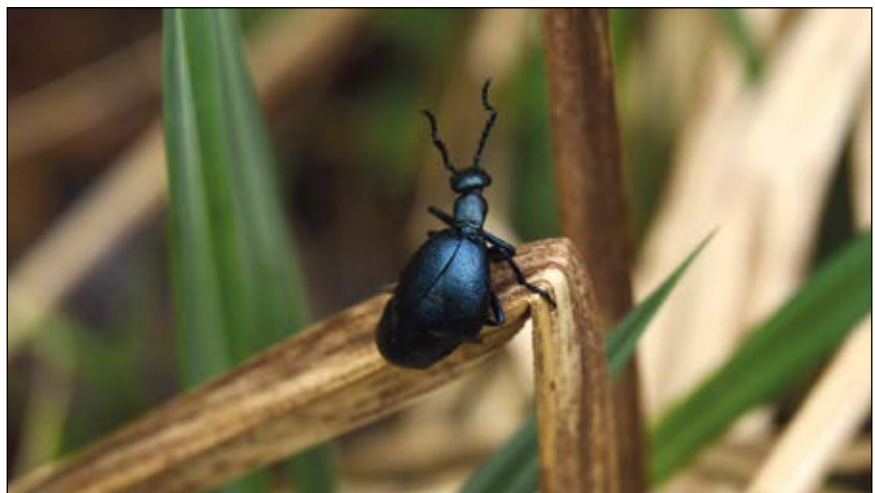
Abb. 22: Vermutlich ein Männchen des Violetten Ölkäfers ( Meloe violaceus ) – Ölkäfer sind durch ihren Gehalt an Cantharidin für den Menschen besonders giftig – dies schützt sie aber nicht vor ihren starken Bestandesrückgängen – hier in einem Erlen-Eschen-Feuchtwald bei Haag am Hausruck.

Abb. 20 u. 21) und anderen nehmen die Gifte ihrer Futterpflanzen auf und signalisieren ihre Giftigkeit oft durch auffällige Färbung; Laufkäfer und Ameisen verspritzen zielgerichtet giftige bzw. ätzende Flüssigkeiten, einige können sogar kleine Explosionen erzeugen; viele Raupen haben ähnlich den Prozessionsspinnern feine Haare, die durch die Haut eindringen, abbrechen und so lästige juckende Entzündungen hervorrufen; Ölkäfer (Abb. 22) und ihre Verwandten (z. B. die Spanische Fliege – Lytta vesicatoria ) sind für ihre Giftigkeit bekannt und vieles mehr.