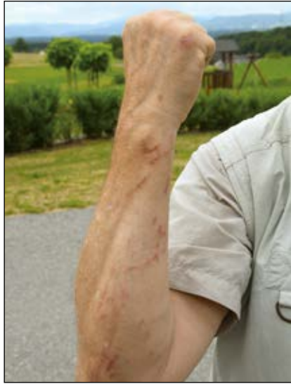
Abb. 50: Verletzungen nach Kontakt mit Säften des Diptams ( Dictamnus albus ) bei der Gartenarbeit.