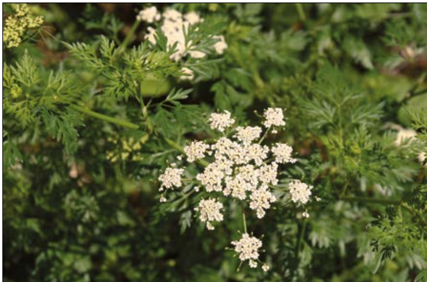
Abb. 35: Die giftige Hundspetersilie ( Aethusa cynapium ) – wurde vor allem früher mit der Gartenpetersilie verwechselt. Sie wächst gerne an Acker- und Auwaldrändern sowie auf Ödland.

Im Rahmen einer Diplomarbeit an der Universität Graz wurden die Ursachen von Pflanzenvergiftungen vom 19. bis zum 21. Jahrhundert im deutschsprachigen Raum analysiert (OESTERMANN 2019). Die häufigste ist die spontane Aufnahme über den Mund oder der Kontakt mit Giftpflanzen. Um die 80 % der Anfragen bei toxikologischen Zentren betreffen Kinder, die vom Äußeren bunter Bee-