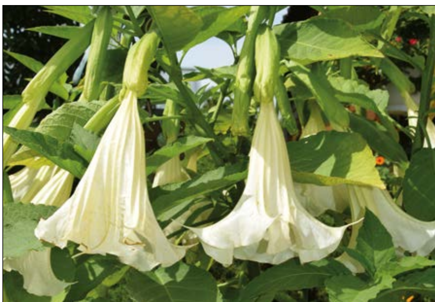
Abb. 41: Engelstropfpeten ( Brugmansia spp.) – bei uns verbreitet als Kübelpflanze in Gärten, auf Terrassen und Vorplätzen – sind stark giftig und gehören weg von Kleinkindern.