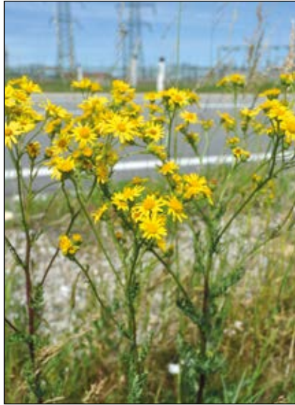
Abb. 33: Das Jakobs-Greiskraut ( Senecio jacobaea ) – eine attraktive Art unserer Straßenböschungen und Magerwiesen – wegen der Giftigkeit für Weidetiere zunehmend im Fokus – gefährlich vor allem im Heu und im Silofutter