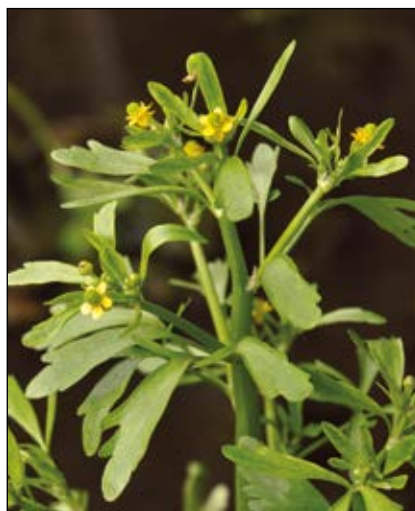
Abb. 30: Der Gift-Hahnenfuß ( Ranunculus sceleratus ) – wie der Name schon verrät ein stark giftiger Vertreter der Hahnenfußgewächse – eine einjährige, eher seltene Pionierart auf trockenfallenden Schlammböden und Gewässerrändern

Gifte wirken auf Menschen und Tiere ganz unterschiedlich. Dies fällt rasch auf, wenn man beobachtet, wie