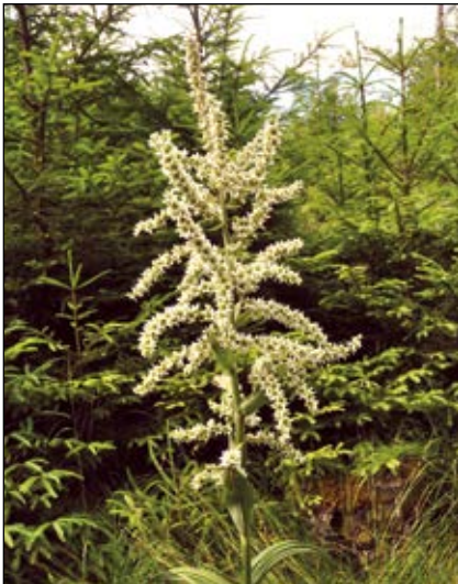
Abb. 19: Der Weiße Germer ( Veratrum album ) – eine giftige Pflanze der Hochstaudenfluren und Almen im Gebirge – reicht bis in die feuchten Wälder des Alpenvorlandes wie hier im Kobernauberwald südlich Lohnsburg – wird vom Vieh normalerweise im frischen Zustand gemieden, weswegen er sich auf den Weiden entsprechend vermehren kann.

Von einer angeborenen Angst vor giftigen Pflanzen oder Pilzen ist allerdings nicht auszugehen. Aber Präferenzen bestimmter Inhaltsstoffe pflanzlicher Art können dadurch entstehen, dass sie die Mutter während der Schwangerschaft isst und die Stoffe durch die Plazentaschranke zum Fötus gelangen. Was umgekehrt bedeuten kann, dass im embryonalen und auch im Kleinkindzustand (über die Muttermilch) nicht aufgenommene Stoffe später zumindest mit Vorsicht probiert oder zunächst abgelehnt werden. Die Kenntnis, dass sie schmecken und zuträglich sind, wird nach und nach erworben ... oder auch nicht mehr, wie es das Sprichwort ausdrückt „Was der Bauer nicht kennt...“ (Josef Reichholf, E-Mail).