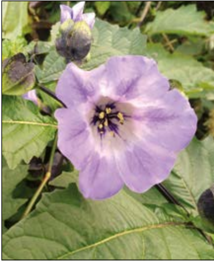
Abb. 28: Die Giftbeere ( Nicandra physalodes ) – ein attraktiv blühendes Nachtschattengewächs, das seine Giftigkeit sogar im Namen trägt – wächst spontan in Gärten, auf Deponien und auf Ödland.