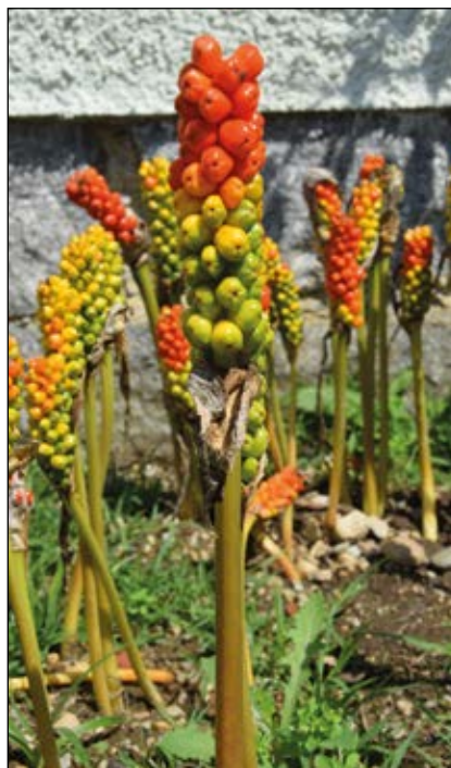
Abb. 47: Auch die lockenden leuchtend-roten Beeren des Aronstabs (hier Arum italicum ) könnten Kinder zum Naschen verführen. Sie enthalten das starke Gift Aroin (ALTMANN 2011).