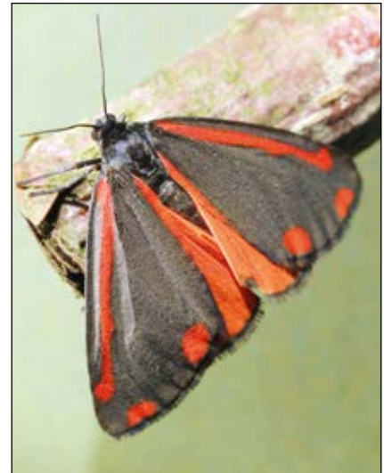
Abb. 21: Der Jakobskrautbär, auch Blutbär oder Karminbär genannt – hier als Schmetterling im Tieftal bei Mitterstoder

Die Insektenwelt nutzt Giftpflanzen besonders raffiniert: Blutströpfchen ( Zygaena filipendulae ) etwa enthalten cyanogene Glycoside und werden von Vögeln gemieden; die Raupen von den Wolfsmilchschwärmern ( Hyles euphorbiae ), Ligusterschwärmern ( Sphinx ligustri ), Totenkopfschwärmern ( Acherontia atropos – fressen Nachtschattengewächse), Jakobskrautbären ( Tyria jacobaeae –