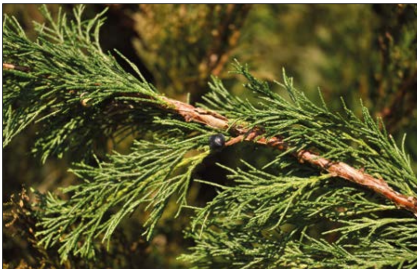
Abb. 8: Der Segenbaum ( Juniperus sabina ) – Pflanze mit zwei Gesichtern: einerseits eine „heilige“ Brauchtumpflanze, andererseits ein früher oft missbrauchtes Abortivum – kostete vielen Frauen das Leben – einst häufig, heute schon selten in den Gärten.