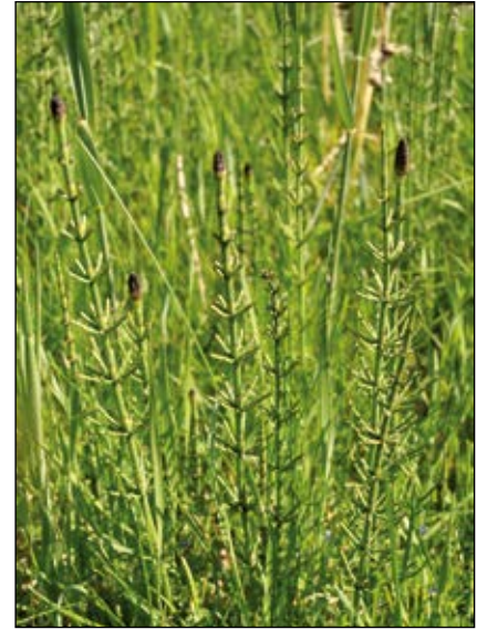
Abb. 34: Der Sumpf-Schachtelhalm ( Equisetum palustre ) – besonders für Pferde giftig – wächst vor allem in Nasswiesen, Sümpfen und feuchten Gräben – im Gegensatz zum Acker-Schachtelhalm tragen die grünen Sprosse an der Spitze die Sporenähren.

Schnecken an den giftigsten Pilzen oder Vögel giftige Beeren fressen. Sogar der Ölkäfer ( Meloe proscarabaeus ), auch „Maiwurm“ genannt, dessen Wirkstoff Cantharidin schon in geringfügiger Menge auf den Menschen tödlich wirken kann, hat mehrere Fressfeinde im Tierreich wie Igel oder Vögel. Und wie glücklich wäre wohl der giftige Buchs ( Buxus sempervirens – Abb. 32), gäbe es den gänzlich unbeeindruckt bleibenden Buchsbaumzünsler ( Cydalima perspectalis ) nicht!