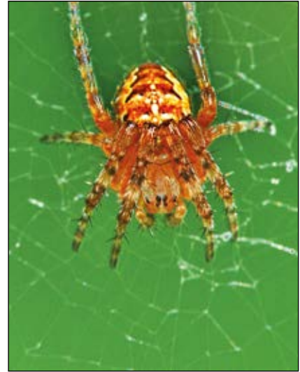
Abb. 17: Ein Jungtier der Gartenkreuzspinnne ( Araneus diadematus ) – in der Großaufnahme gefährlich wirkend – in Wirklichkeit harmlos für den Menschen – ihr Gift reicht nur für kleine Insekten.