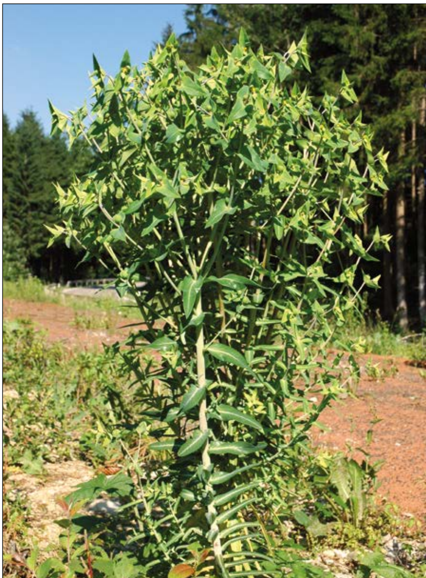
Abb. 40: Die Spring-Wolfsmilch ( Euphorbia lathyris ) – gelegentlich in unseren Gärten zu finden – vor allem die ätzende, bei Verletzungen austretende Milch kann empfindliche Haut schädigen.

In unseren Gärten gibt es tatsächlich eine Reihe giftiger Pflanzen, etwa einige Eisenhut-Arten ( Aconitum spp.), Rittersporn ( Delphinium spp.), Nieswurz ( Helleborus spp.), Fingerhut