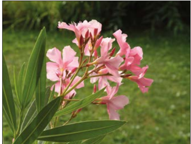
Abb. 45: Auch der beliebte Oleander ( Nerium oleander ) zählt zu den Giftpflanzen – er enthält herzwirksame Glycoside und Alkaloide (ALTMANN 2011). Man sollte Berührungen mit der Pflanze oder ihren Säften sicherheitshalber meiden und den Zugang für Kleinkinder sperren.

( Digitalis spp.), Mohn ( Papaver spp.), Engelstropfen ( Brugmansia spp. – Abb. 41), Zier-Tabak ( Nicotiana spp.), Aronstab ( Arum italicum – Abb. 47), Goldregen ( Laburnum anagyroides – Abb. 43), die als lebende Zäune kultivierten Thujen ( Thuja spp. – Abb. 44), Buchs ( Buxus sempervirens – Abb. 32) und Kirschlorbeer ( Prunus laurocerasus – Abb. 39), Efeu ( Hedera spp.), Oleander ( Nerium oleander – Abb. 45), Liguster ( Ligustrum spp.), Eiben ( Taxus spp. – Abb. 38) und gelegentlich auch Wunderbäume ( Ricinus communis – Abb. 46).