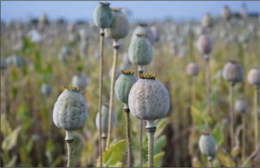
Abb. 3: Der Schlaf-Mohn ( Papaver somniferum ) – Basis des Betäubungs- oder Rauschmittels Opium – hier als Blaumohn auf einem Feld bei Reichersberg