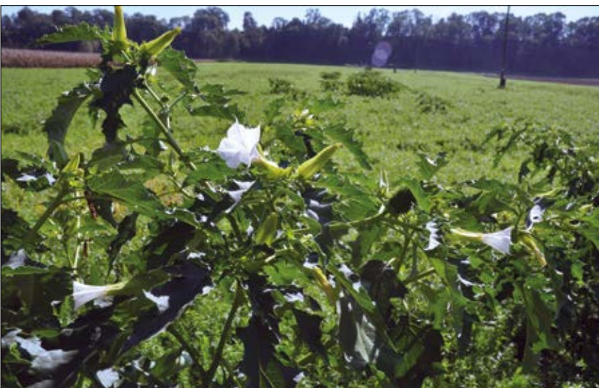
Abb. 5: Der Stechapfel ( Datura stramonium ) – ein stark giftiges Nachtschattengewächs – kam im 16. Jahrhundert nach Europa – wächst bei uns unbeständig auf Ödland und Äckern – dessen Samen bleiben Jahrzehnte keimfähig (DÜLL u. KUTZELNIGG 2016).

der auf lebende Organismen schädlich wirkt.“ Und weiter: „Man kann sagen, daß der Mensch zu allen Zeiten und in jedem Erdteile Gift gekannt hat, die er zu verschiedenen Zwecken ... als Waffengifte, auf der Jagd und beim Fischfang, zu Heilzwecken und Gottesurteilen, zum Tode verurteilter Verbrecher verwertet hat.“ Bereits griechischen und römischen Schriftstellern verdanken wir Informationen über die älteste geschichtliche Giftkunde. Im Jahr 83 v. Chr. wurde in Rom sogar das erste Gesetz gegen Giftmischerei ( lex Cornelia de sicariis et veneficis ) erlassen (KORSCHOLT u. a. 1914).