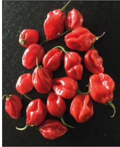
Abb. 24: Habaneros ( Capsicum chinense ) – gehören zu den schärfsten Chilis – der darin enthaltene Scharfmacher ist das Alkaloid Capsaicin.