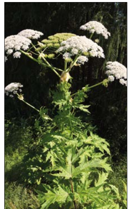
Abb. 48: Die Riesen-Bärenklau ( Heracleum mantegazzianum ) hat stark ätzende Pflanzensäfte (vor allem im Zusammenspiel mit Sonnenlicht). Sie gehört nicht in einen Garten für Kinder. In freier Natur ist sie gelegentlich verwildert zu finden. Kinder gehören davor gewarnt! Auf keinen Fall berühren, Blätter abreißen oder den hohlen Stängel als Blasrohr benutzen!