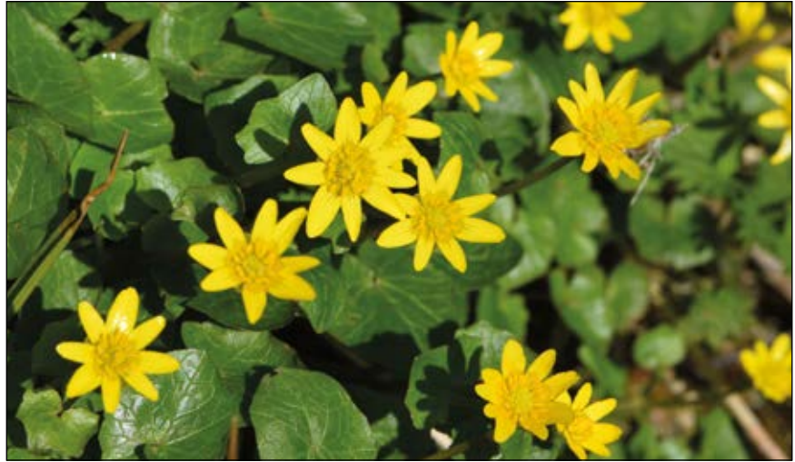
Abb. 29: Das Scharbockskraut ( Ficaria verna ) – bis zur Blüte ein Vitamin-C-reiches Wildgemüse – später durch Giftstoffe immer bitterer werdend – häufig in unseren Laubwäldern und Auen, aber auch in Parks und Gärten zu finden

(2011) sei dieser Strauch giftig! Auch der Schwarze Holunder ( Sambucus nigra ) ist im Grunde giftig, vor allem die grünen Pflanzenteile, aber die Beeren und Blüten werden genutzt; sogar die Früchte des in vielen Büchern als giftig beschriebenen Trauben-Holunders ( Sambucus racemosa – Abb. 26) wurden früher im Hausruckgebiet zu Marmelade verkocht (HOHLA 2018)! Die bei uns völlig unbeachteten schwarzen, alkaloidfreien Früchte des Schwarzen Nachtschattens ( Solanum nigrum – Abb. 27) werden in Teilen Amerikas und Russlands heute noch gegessen. Bei uns wurden sie bis ins 16. Jahrhundert sogar als Gemüse angebaut, verrät ein Blick in DÜLL u. KUTZELNIGG (2016). Apropos Nachtschattengewächse (Abb. 28): Hierzulande weiß man: Das Grüne von Tomaten ( Solanum lycopersicum ) und Kartoffeln ( Solanum tuberosum ) soll man nicht essen, es enthält das giftige Alkaloid Solanin!