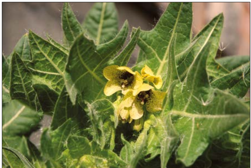
Abb. 2: Das Schwarze Bilsenkraut ( Hyoscyamus niger ) – wurde bereits in der Antike als Narkotikum verwendet – bis zum „Reinheitsgebot“ auch als berausender Bierzusatz.