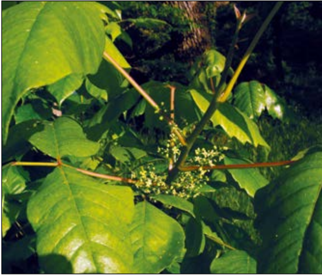
Abb. 52: Der Giftsumach ( Toxicodendron radicans ), auch „Poison Ivy“ oder „Gift-Efeu“ genannt – stammt aus Nordamerika und sollte in Europa höchstens in botanischen Gärten zu finden sein – besitzt eines der stärksten bekannten Kontakttoxine (ANONYMUS 2016).