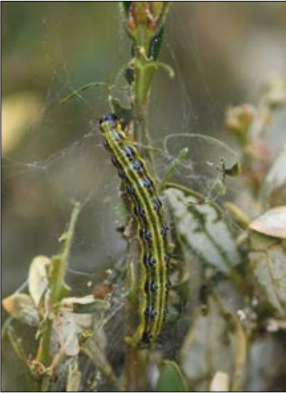
Abb. 32: Gar nicht immer grün, wie der lateinische Name eigentlich bedeutet – der Buchs ( Buxus sempervirens ) – dessen Gifte (Cyclobuxin) wirken leider nicht auf die Raupen des Buchsbaumzünslers ( Cydalima perspectalis ).