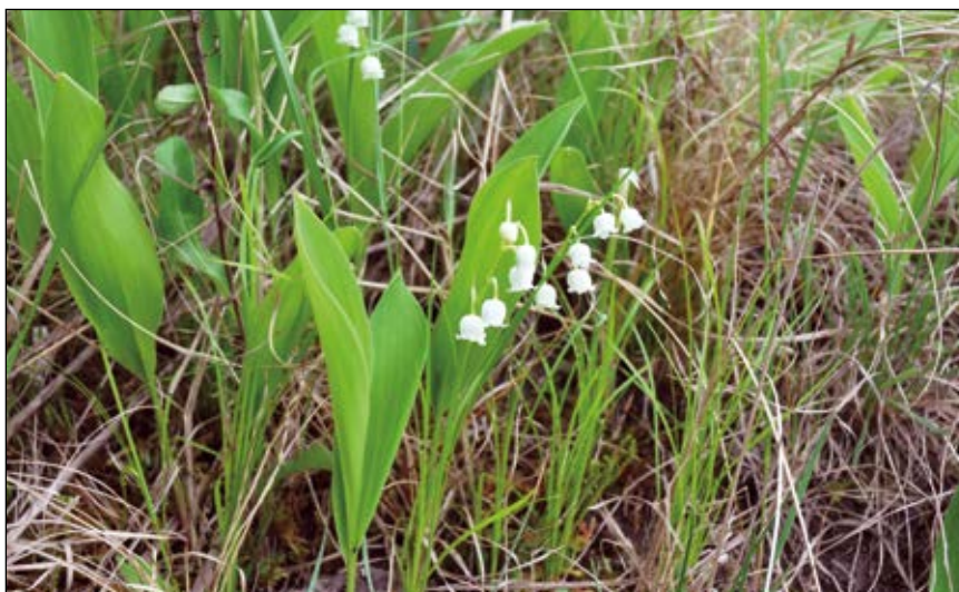
Abb. 37: Das giftige Maiglöckchen ( Convallaria majalis ) – eigentlich unverwechselbar, aber deren Blätter werden selten mit jenen des Bärlauchs verwechselt (HOHLA 2019) – enthält giftige Digitalis-Glykoside und Saponine (DÜLL u. KUTZELNIGG 2016).