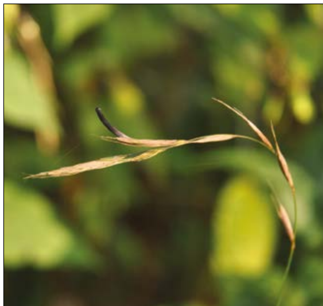
Abb. 13: Das Mutterkorn ( Claviceps purpurea ) – ein Pilz, der vor allem im 16. Jahrhundert Auslöser des damals grassierenden „Antoniusfeuers“ (auch Ergotismus, Kriebel-Krankheit) war – in den Roggenfeldern heute durch Pestizideinsatz und Züchtung neuer Sorten nicht mehr zu finden – selten auf Wildgräsern schmarotzend, wie hier auf einer Wald-Zwenke ( Brachypodium sylvaticum ).

Apotheker konnte uns entsprechend beruhigen, nachdem er uns die harmlose Giftmenge vorgerechnet hatte.