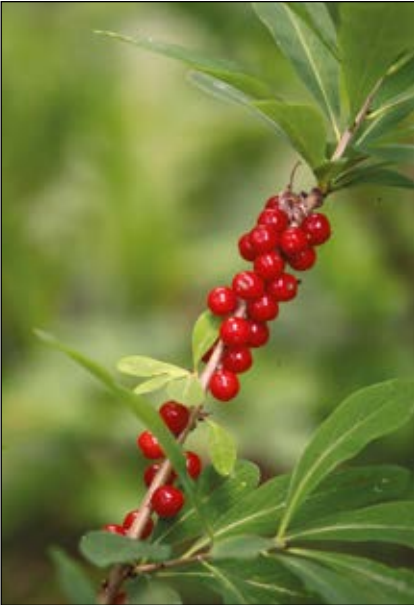
Abb. 9: Der stark giftige Seidelbast ( Daphne mezereum ) – wächst in krautreichen Wäldern, meist auf kalkhaltigen Böden, vor allem im Gebirge – die getrockneten Früchte wurden in der Volksmedizin als „Breinkeandl“ (vermutlich „Brennkerne“) bei Halsschmerzen verabreicht.