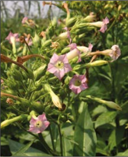
Abb. 23: Der Tabak ( Nicotiana tabacum ) – eine wichtige Kulturpflanze – der enthaltene Wirkstoff Nicotin ist ein äußerst starkes Gift, bereits 40–60 mg sind für einen Erwachsenen tödlich (DÜLL u. KUTZELNIG 2016).