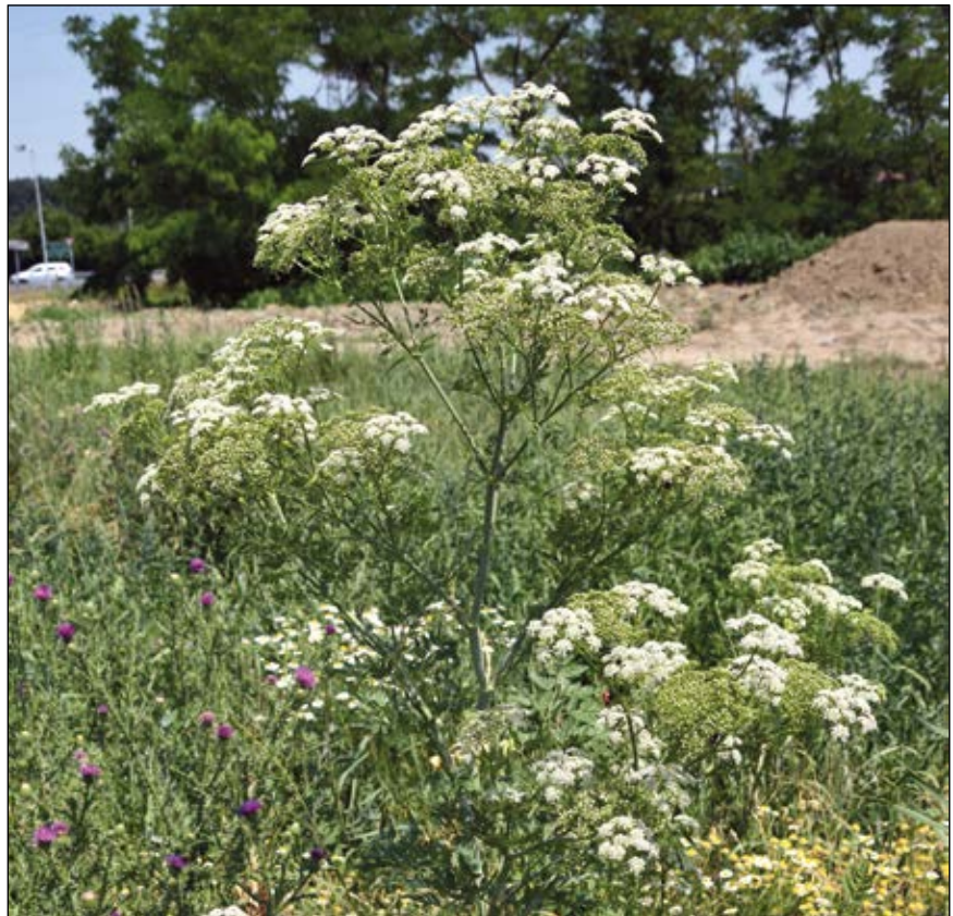
Abb. 1: Der Fleckenschierling ( Conium maculatum ) – kostete dem griechischen Philosophen Sokrates das Leben – Stängel an der Basis kahl und rot gefleckt – Blätter vor allem beim Trocknen stark nach Mäuse-Urin stinkend.

Bevor ich auf das Thema der organischen Gifte und deren Kulturgeschichte eingehe, möchte ich mir den Begriff „Gift“ noch etwas näher ansehen. Ich schlage das nicht gerade handliche Handwörterbuch der Naturwissenschaften (KORSCHULT u. a. 1914) auf. Dankbar für die Klarheit und Kürze der Definition lese ich darin: „Gift heißt jeder chemische Stoff,