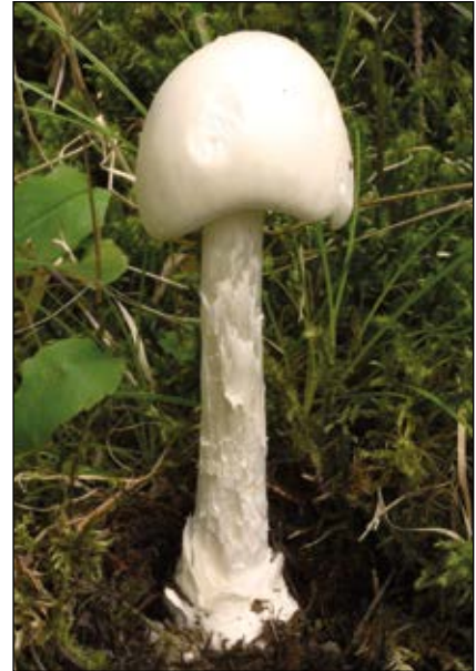
Abb. 11: Der Kegelhütige Knollenblätterpilz ( Amanita virosa ) – steht in seiner Giftigkeit dem Grünen Knollenblätterpilz in nichts nach – und doch gibt es daran fressende Schnecken, denen dieser Pilz nicht schadet.