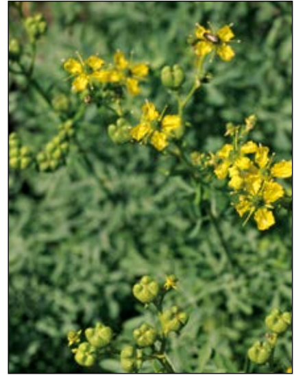
Abb. 51: Die aus dem mediterranen Raum stammende Weinraute ( Ruta graveolens ) – eine alte Heil-, Gewürz- und Zierpflanze – besitzt ebenfalls gefährlich ätzende Pflanzensäfte.

gewächse; sie besitzt eines der stärksten bekannten Kontakttoxine (ANONYMUS 2016).