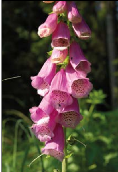
Abb. 10: Der Rote Fingerhut ( Digitalis purpurea ) – eine attraktive, aber sehr giftige Pflanze unserer Wälder – wurde vor langer Zeit zur „Behübschung“ vor allem in herrschaftlichen Wäldern gepflanzt – das Hauptverbreitungsgebiet dieser Art liegt in Westeuropa.