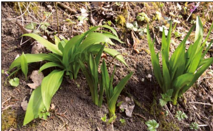
Abb. 36: Die Herbstzeitlose ( Colchicum autumnale ) – gefährlich hauptsächlich wegen der Ähnlichkeit ihrer Blätter mit jenen des Bärlauchs (HOHLA 2019) – links Bärlauch, in der Mitte und rechts Herbstzeitlose – in der Antiesenau bei Antiesenhofen.