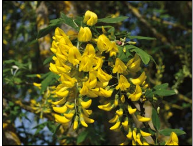
Abb. 43: Der Goldregen ( Laburnum anagyroides ) – stark giftiges Gartengehölz – Wirkstoff Cytisin – Kinder sind gefährdet durch Lutschen an den auffälligen Blüten sowie durch das Kauen und Schlucken der Samen – am besten durch Schnitt dafür sorgen, dass Blüten und Früchte für kleine Kinder unerreichbar sind.