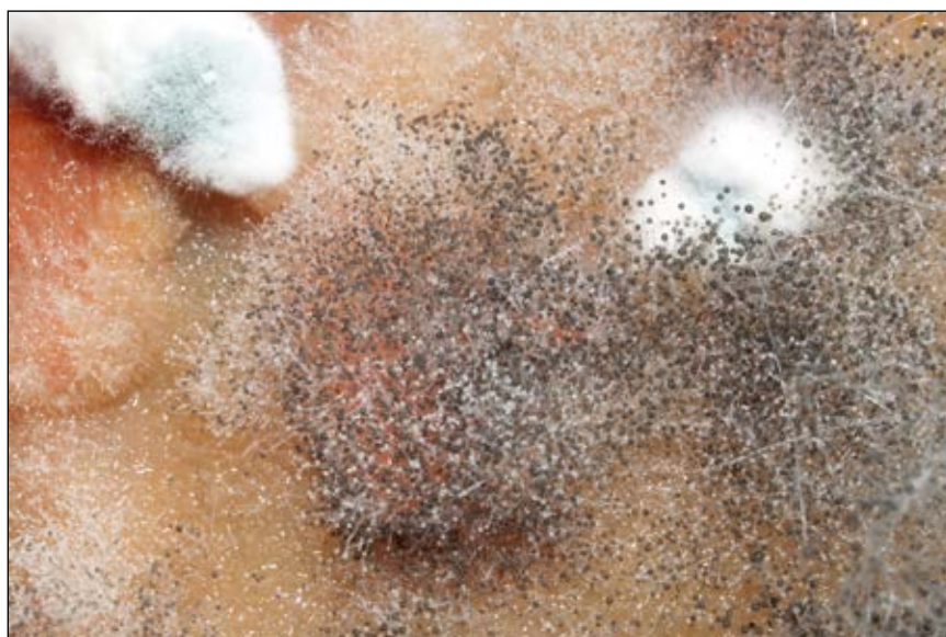
Abb. 14: Schimmelpilze auf Nahrungsmitteln – können sehr giftig und krebserregend sein und Allergene ausbilden – hier sogenannter Köpfcenschimmel der Gattung Mucor .

Noch viel kleiner als das Mutterkorn, aber auch verhängnisvoll können sich Schimmelpilze (Abb. 14) aus-