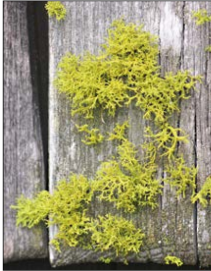
Abb. 16: Die giftige Wolfsflechte ( Letharia vulpina ) – eine Art auf alten Lärchen und Zirben in der subalpinen Zone, auch auf deren Holz (Legschindel, Zäune) in eher kontinentalen Lagen – hier an einem Heustadel im Lesachtal in Kärnten – giftig darin ist die Vulpinsäure – „früher“ zur Herstellung giftiger Wolfsköder verwendet.