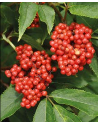
Abb. 26: Die Beeren des ansonsten giftigen Trauben-Holunders ( Sambucus racemosa ) wurden früher sogar zu Marmelade verkocht – so etwa im Hausruckviertel (HOHLA 2018 u. 2019).

Manchmal sind Literaturangaben widersprüchlich: Ein Bauer in Palting im Bezirk Braunau fragte mich, ob der Gewöhnliche Schneeball ( Viburnum opulus – Abb. 25) giftig sei; dessen Frau macht nämlich daraus Marmelade als Hausmittel gegen Husten; sie nennen diese Beeren Lungenbeel (Lungenbeeren). Allerdings sammeln sie die Früchte erst nach dem ersten Frost! Laut ALTMANN