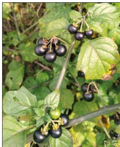
Abb. 27: Der leicht giftige und unangenehm riechende Schwarze Nachtschatten ( Solanum nigrum ) – bei uns unbeachtete Pflanze auf Ödland – in Russland werden die ungiftigen Beeren noch heute als Gemüse geschätzt.