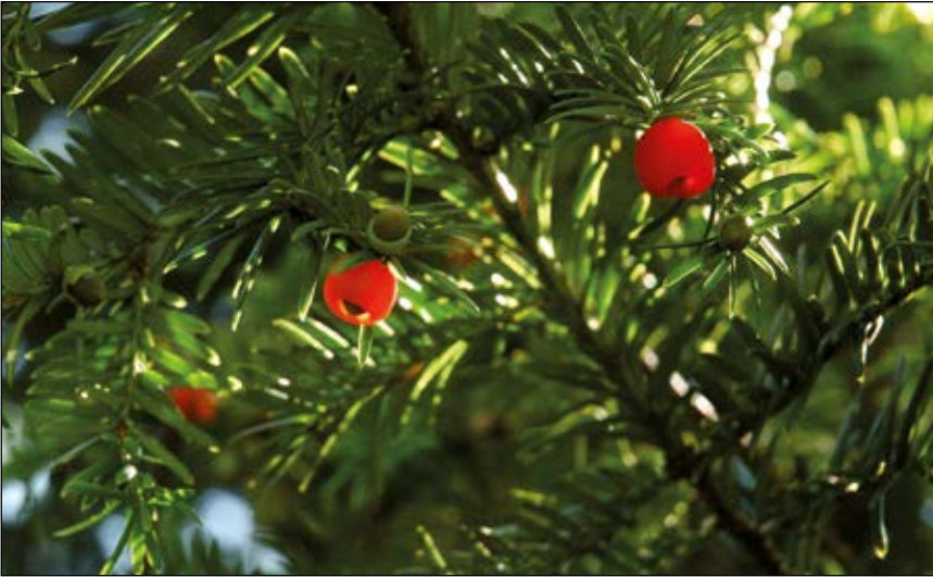
Abb. 38: Eiben ( Taxus spp.) – gehören, wie verschiedene Studien ergeben haben (siehe oben), zu den gefährlichsten Pflanzen in unseren Gärten und Parks – die leuchtend roten Früchte sind verlockend für Kinder (OESTERMANN 2019).