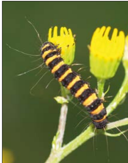
Abb. 20: Der Jakobskrautbär ( Tyria jacobaeae ) – gehört zu jenen Schmetterlingen, die giftige Pflanzen wie hier Greiskraut fressen, das Gift aufnehmen und das oft dann auch durch Warnfarben anzeigen – hier im Nationalpark Kalkalpen/Bodinggraben.

Der Vorteil, den giftige Organismen durch ihre Gifte haben, liegt auf der Hand: Gift schützt vor dem Gefressenwerden, erleichtert das Erlegen der Beute und es verhindert das Aufkommen von Konkurrenz. Besonders bittere oder giftige Pflanzen, wie etwa Orchideen, Enziane oder der Weiße Germer ( Veratrum album – Abb. 19) auf den Almen, werden von den Weidetieren gemieden und nicht gefressen. Im Laufe der Evolution haben sich verschiedene Pflanzen- und Tierfresser jedoch auf bestimmte Gifte oder Bitterstoffe eingestellt, Immunitäten konnten sich