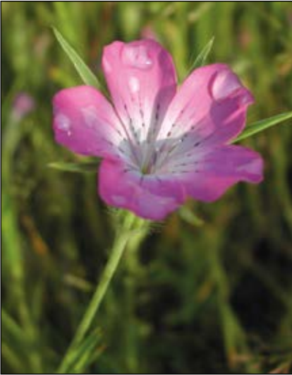
Abb. 15: Die Kornrade ( Agrostemma githago ) – einst eine häufige, aber giftige Ackerwildpflanze – im Volksmund Rádn oder Roadn – seit den 1970er Jahren durch verbesserte Saatgutreinigung aus unseren Äckern so gut wie verschwunden (HOHLA u. a. 2009)