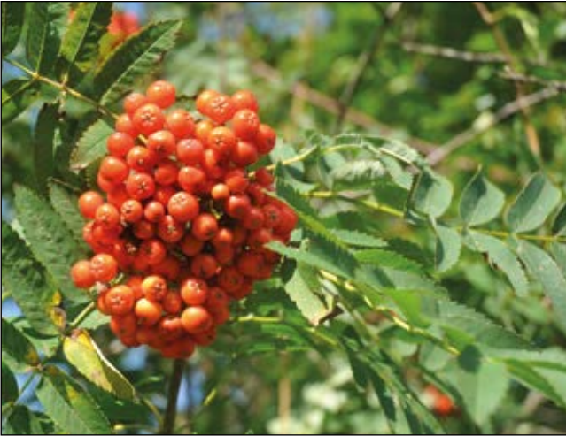
Abb. 42: Die Vogelbeere ( Sorbus aucuparia ) – wird allgemein als die (!) giftige Beere angesehen – sie ist jedoch nur leicht giftig (Parasorbinsäure). Nach DÜLL u. KUTZELNIGG (2016) lässt sich aus den Vitamin C-reichen Früchten sogar gute Marmelade bereiten.