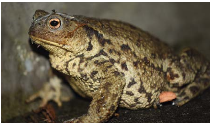
Abb. 7: Die in unseren Gärten überaus nützliche Erdkröte ( Bufo bufo ) – die Hautdrüsen der Kröten produzieren giftige Sekrete – Krötengifte wurden schon im Altertum als Heilmittel aber auch als Gift zum Töten von Menschen verwendet.