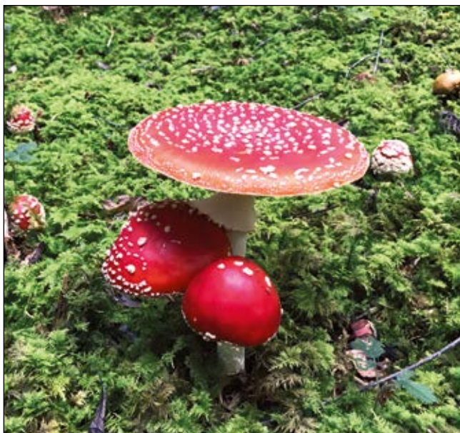
Abb. 12: Eine Zierde unserer Wälder – der Fliegenpilz ( Amanita muscaria ) – er wurde in früheren Kulturen verehrt und von sibirischen Schamanen als Droge angewendet (RÄTSCH 1998).