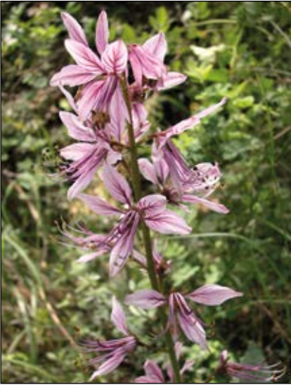
Abb. 49: Eine im Osten Österreichs bzw. im Pannonikum beheimatete, attraktive Pflanze – der Diptam ( Dictamnus albus ) – besitzt ebenfalls stark ätzende Säfte.