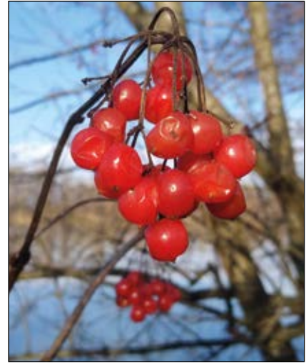
Abb. 25: Rot leuchtende, leicht giftige Früchte des Gewöhnlichen Schneeballs ( Viburnum opulus ) – bleiben oft bis in den tiefen Winter an den Sträuchern – werden selten auch zu Marmelade verkocht, die dann als Hustenmedizin dient (Mundart: Lungenbeel ).

Pflanzen setzen ein ganzes Arsenal an chemischen Waffen ein, um sich gegen unliebsame Konkurrenten und gefährliche Fraßfeinde zur Wehr zu setzen. Die Walnuss ( Juglans regia ) tut dies mit Juglon, was Konkurrenten unter dem Baum verkümmern lässt oder Mais ( Zea mays ), der Enzyme in den Boden abgibt, wo sie nach mehreren Umwandlungen das Wurzelwachstum benachbarter Pflanzen hemmen. Man nennt dieses Phänomen Allelopathie. Mit Hilfe dieser Stoffe kann der Mais sogar ins Erbgut seiner Widersacher eingreifen,