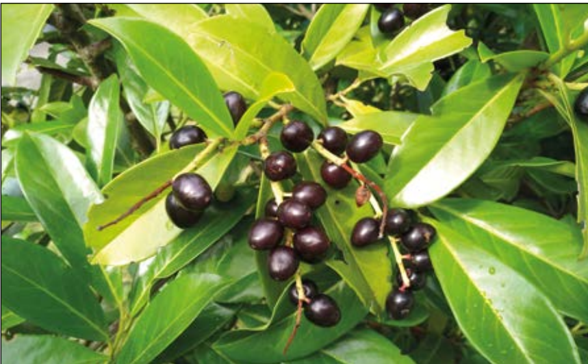
Abb. 39: Wird häufig als Gartenstrauch oder -zaun gepflanzt – der Kirschlorbeer ( Prunus laurocerasus ) – die Pflanze ist stark giftig (Blausäure) – vor allem die Früchte könnten Kinder zum Naschen verleiten – die Samen sind giftig, das Fruchtfleisch jedoch nur sehr wenig (DÜLL u. KUTZELNIGG 2016).

ren und Blüten angelockt werden und sie verzehren oder sie aufgrund ihrer Beschaffenheit zum Spielen nutzen.