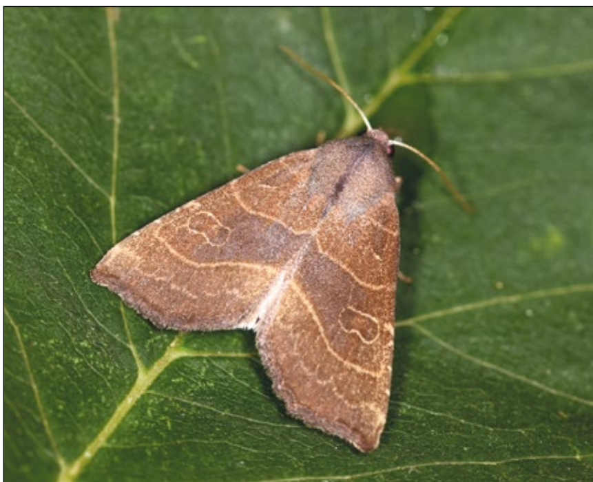
Abb. 1: Erwachsener Falter der Birnbaumeule mit kupferbrauner Grundfärbung und typisch beiger Linienzeichnung

Die Wärme liebende Art ist in Oberösterreich auf den östlichen Zentralraum beschränkt und fast nur unter 400 Meter Seehöhe zu finden. Ältere Funde der Birnbaumeule aus Scharten belegen, dass der Naturpark mit seinen Streuobstwiesen und Baumzeilen mit Kultur-Birnbäumen einen