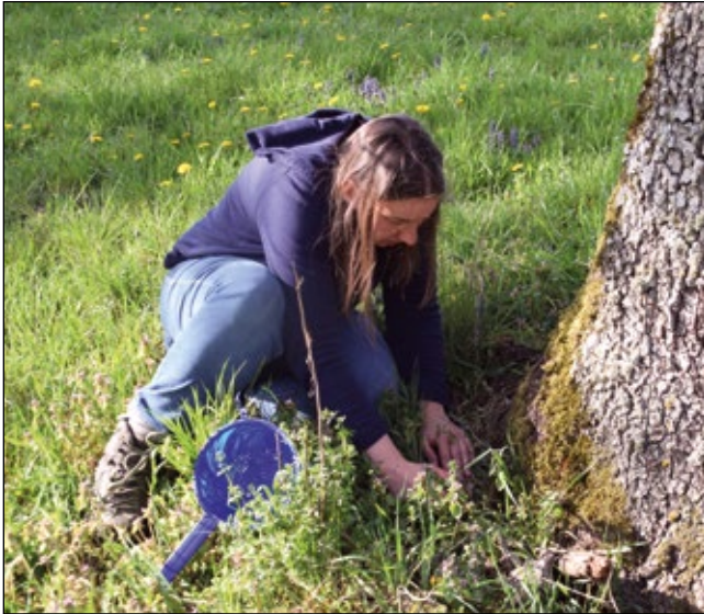
Abb. 6: Suche nach ausgewachsenen Raupen am Stammfußbereich eines älteren Kulturbirnbaumes.