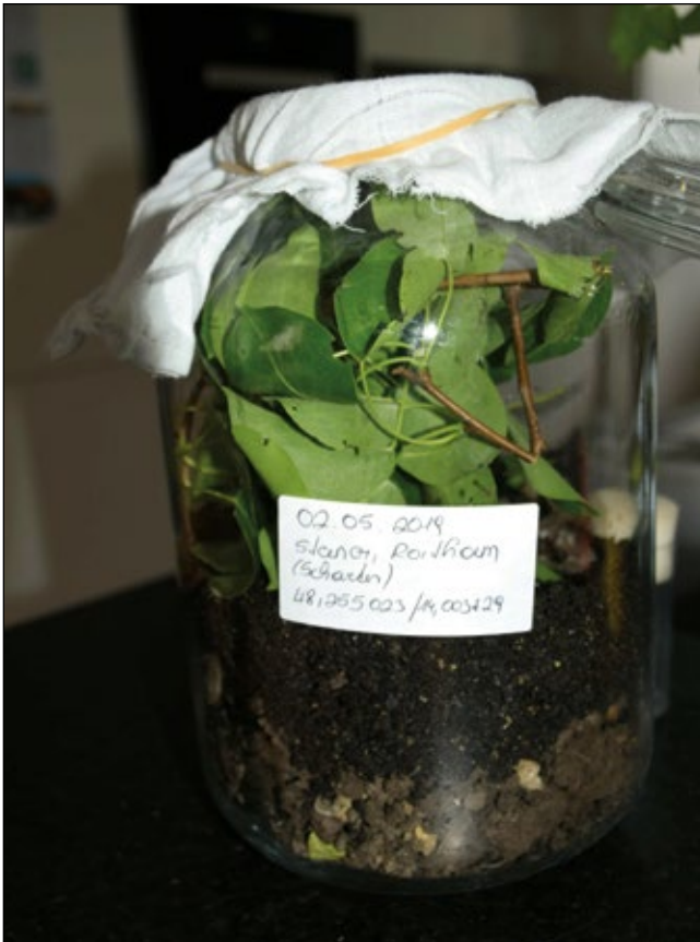
Abb. 11: Aufzuchtbehälter für die Raupen der Birnbaumeule. Der Boden des Glases ist einige Zentimeter mit Erde bedeckt, damit sich die Raupen darin verpuppen können.