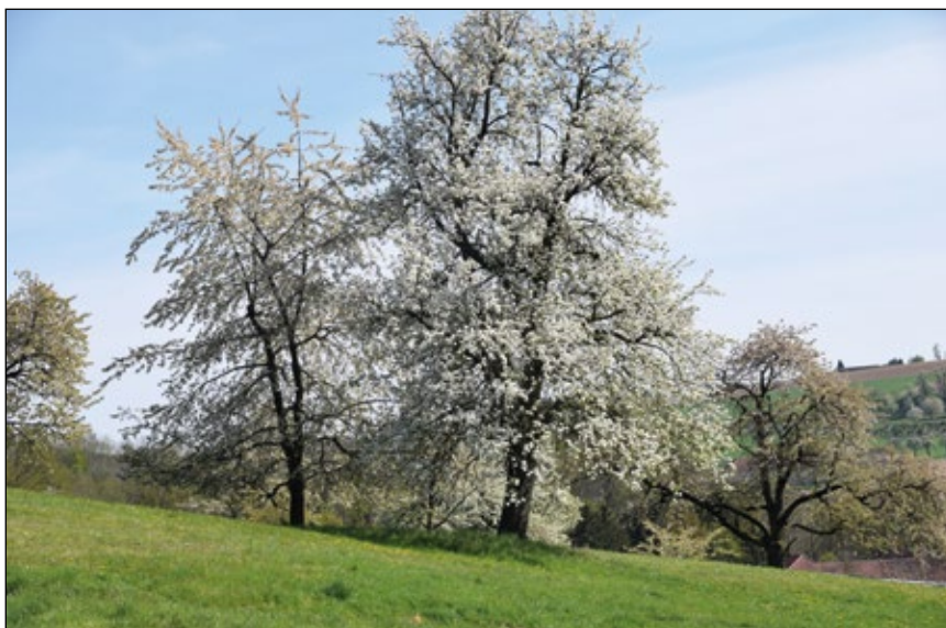
Abb. 2: Alte Birnbäume in einem Streuobstbestand im Naturpark Obst-Hügel-Land in der Gemeinde Scharten in voller Blüte