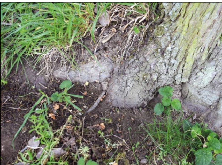
Abb. 10: Fundstelle im direkten Stammfußbereich. Die Raupe konnte beim Überqueren der offenen Bodenfläche beobachtet werden.

wurden 10 bis 15 Birnbäume, wenn möglich unterschiedlichsten Alters, genauestens untersucht.