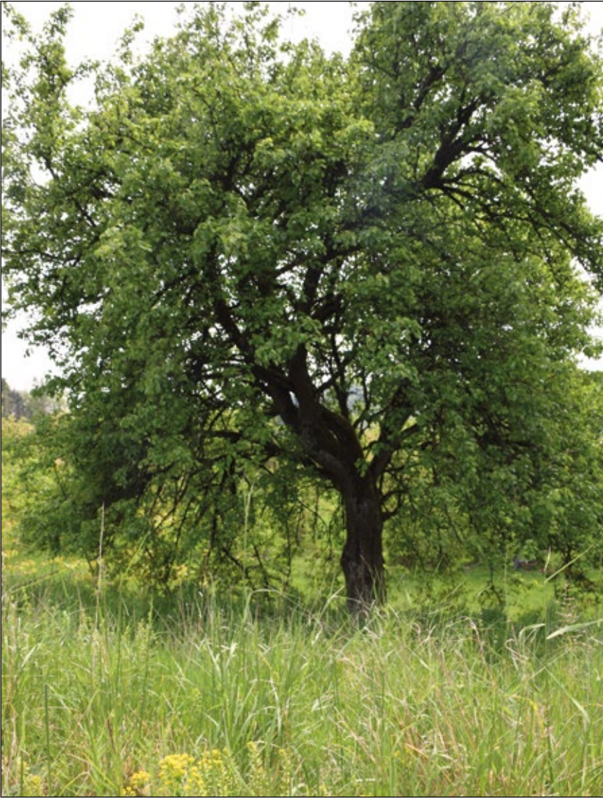
Abb. 9: Fundbaum einer Raupe im Gemeindegebiet von Scharten im Naturpark Obst-Hügel-Land