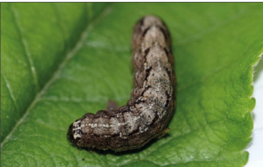
Abb. 5: Raupe der Birnbaumeule mit den charakteristischen dunklen Flecken am seitlichen Rückenbereich, die im hinteren Bereich des Körpers besonders deutlich ausgeprägt sind.

geeigneten Lebensraum für diese Art darstellt (Abb. 2–4). Ob sie immer noch im Gebiet vorkommt, war jedoch unbekannt, da der letzte Beleg aus dem Jahr 1990 stammt und somit schon 30 Jahre alt ist.