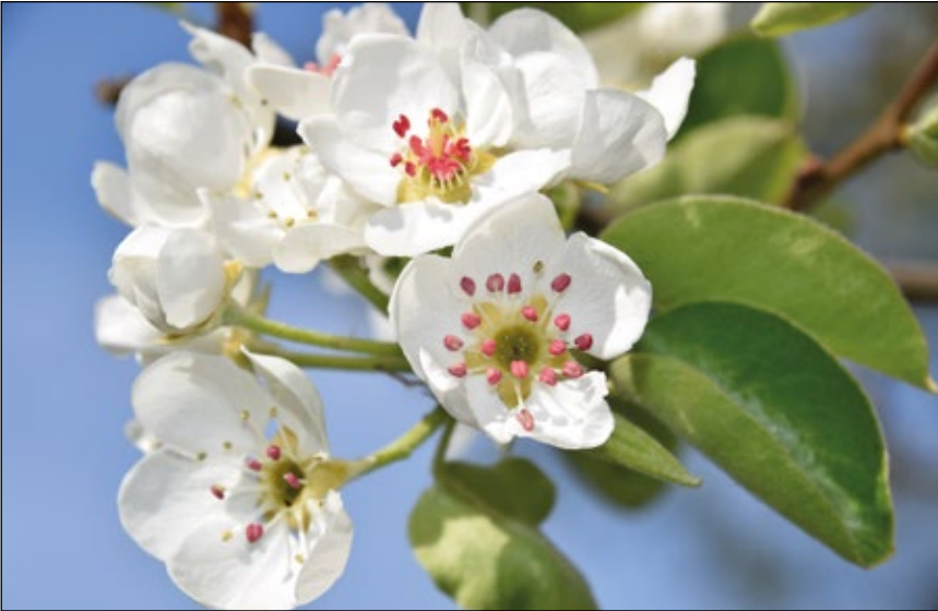
Abb. 3: Birnbaumblüten sind immer an ihren rot gefärbten Staubblättern zu erkennen. Obwohl die Raupen der Birnbaumeule ausschließlich Birnenblätter fressen, richten sie auf Grund ihrer Seltenheit keinen Schaden in Obstkulturen an.