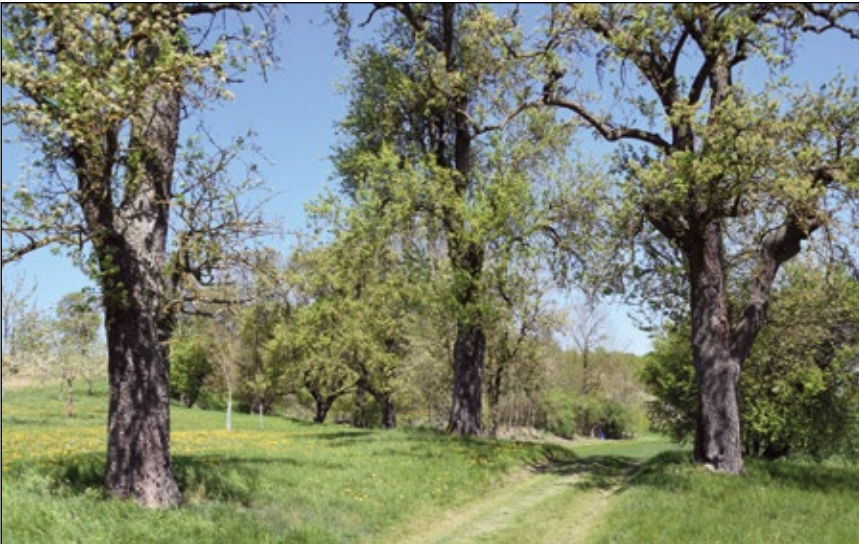
Abb. 4: Birnbaumallee im Naturpark Obst-Hügel-Land in der Gemeinde Sankt Marienkirchen/Polsenz. Im Hintergrund links sind auch Nachpflanzungen alter Streuobstsorten zu sehen.