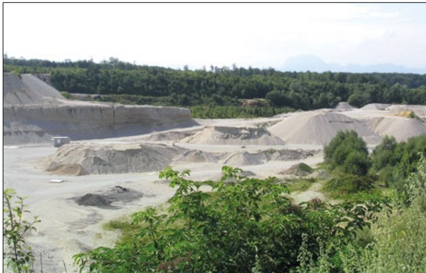
Abb. 1: Schottergrube bei Stadl Paura mit einer langjährig bestehenden Kolonie der Uferschwalbe

Amt der Oö. Landesregierung Direktion für Landesplanung, wirtschaftliche und ländliche Entwicklung Abteilung Naturschutz Bahnhofplatz 1, 4021 Linz alexander.schuster@ooe.gv.at