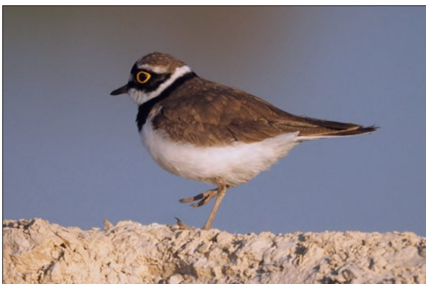
Abb. 4: Der Flussregenpfeifer ( Charadrius dubius ) brütet in Oberösterreich fast ausschließlich in Schottergruben.