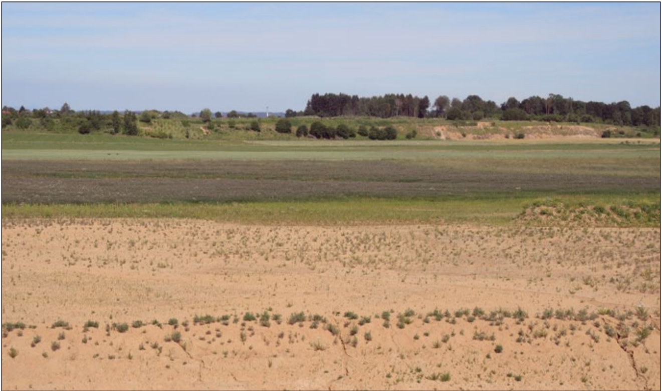
Abb.12: Extensive Kulturlandschaft in einer Kiesgrube bei Hörsching