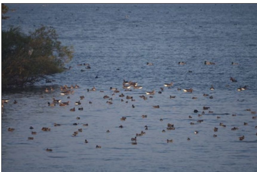
Abb. 10: Wasservogel im Schottergrubenkomplex der Firma Wibau in Marchtrenk / Leithen