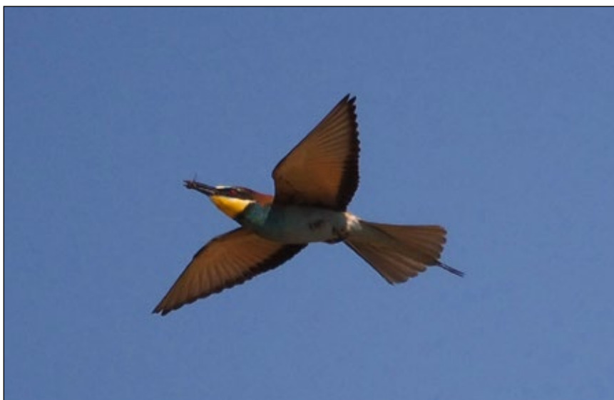
Abb. 3: Bienenfresser ( Merops apiaster ) brüten in Oberösterreich in Abbaugeländen und profitieren von der Klimaerwärmung.