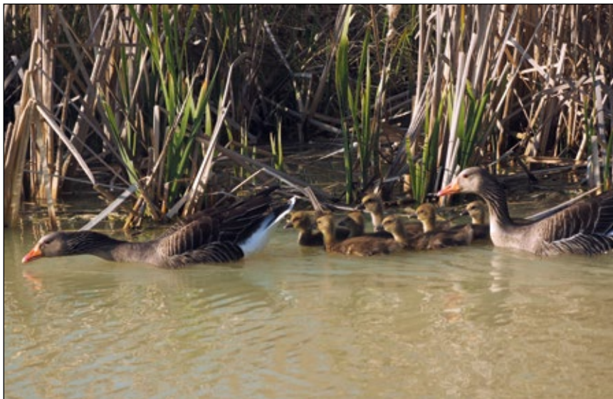
Abb. 8: Graugans ( Anser anser ), eine von zahlreichen neuen Wasservogelarten, die sich in Kiesgruben Oberösterreichs als Brutvogelart etablierten.

In Kiesgruben, die auf Ackerflächen angelegt werden, ergeben sich aufgrund der ökologisch wenig bedeutsamen Ausgangslage kaum Lebensräume für Vogelarten zur Nachnutzung. Das eine oder andere Landschaftselement in Form etwa von Hecken entsteht, und kann für eine