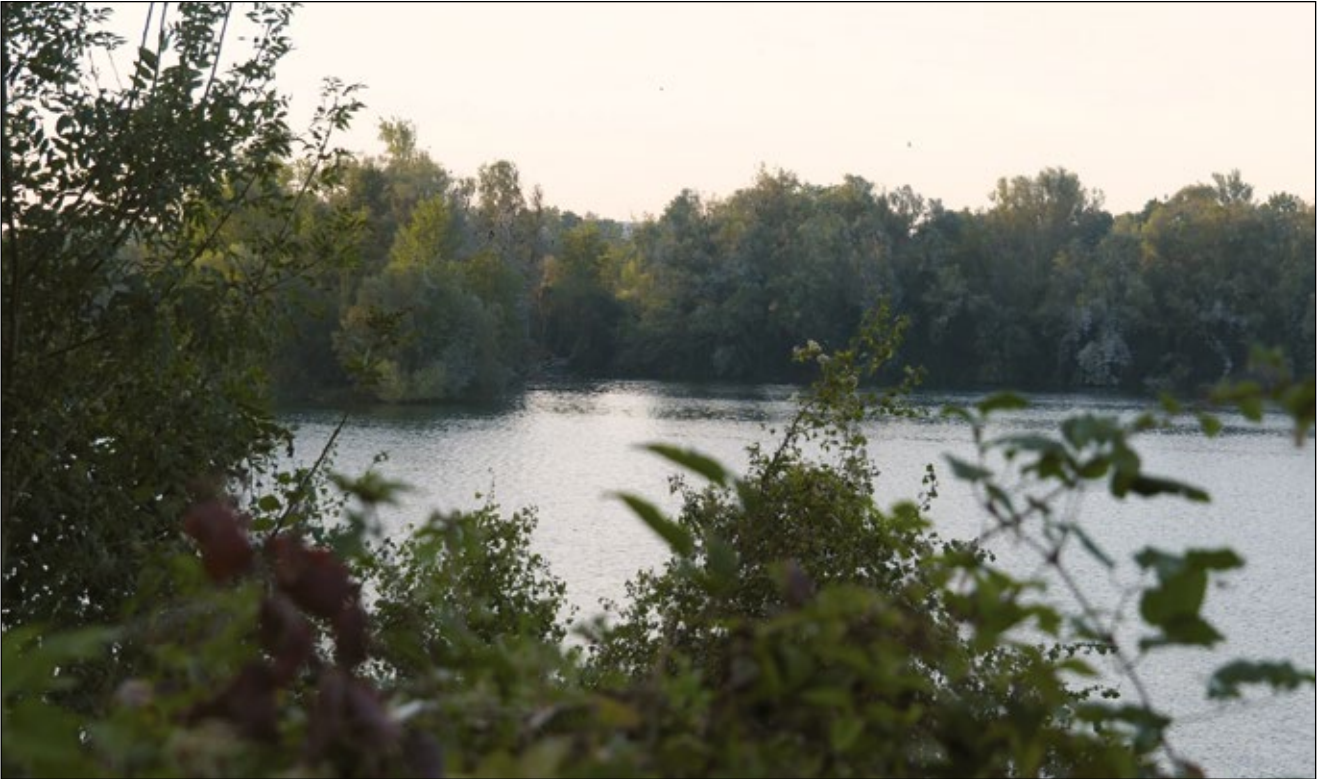
Abb. 11: Weiden- und Pappelau in der Schottergrube Wibau bei Marchtrenk, Schlafplatz von Kormoran, Zwergscharbe und Silberreiher

Weile Brutplatz für Neuntöter oder Dorngrasmücke bieten. Was möglich wäre, zeigt das Abbaugelände der Firma Wibau im Bereich Kirchholz/Trindorf in den Gemeinden Horsching und Marchtrenk (Abb. 12). Aufgrund der Wiederauflage der mehr als einen Meter mächtigen Lößlehmböden nach Abbauende konnte eine intensive agrarische Nutzung aufgrund der herrschenden Staunässe erst nach etlichen Jahren wieder aufgenommen werden. Dazwischen wurden große Teilflächen für mehrere Jahre der natürlichen Sukzession überlassen bis nach Gründüngung Ackerflächen oder an vernässt verbleibenden Stellen Mähwiesen angelegt wurden. In den letzten 20 Jahren wurden auf diesen Flächen nach dem Verschwinden der Pionierarten Uferschwalbe und Flussregenpfeifer, gefährdete Vogelarten der Ackerlandschaft, wie Feldlerche und Kiebitz in hohen Dichten festgestellt. Die Palette an ehemaligen und aktuellen Brutvogelarten umfasst Wachtel, Rebhuhn, Wachtelkönig, Schafstelze, Neuntöter, Blaukehlchen, Schwarzkehlchen, Dorngrasmücke, Sumpfrohrsänger, Hänfling und Grauammer. Derzeit hat sich sogar ein Brutpaar des Großen Brachvogels angesiedelt. Mit gezielter Förderung ließe sich ein Großteil dieser gefährdeten Vogelarten hier