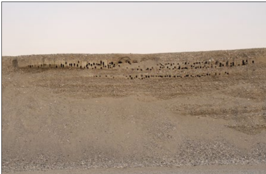
Abb. 2: Kolonie der Uferschwalbe ( Riparia riparia ) in einer Schottergrube in der Welser Heide

Vor allem in den größeren Flusstälern mit ihren Schotterterrassenlandschaften können während des Abbaus auf verschiedene Weise wertvolle Feuchtgebiete entstehen. Sie sind sowohl in der vegetationsarmen Pionierphase als auch in nachfolgenden, oft sehr unterschiedlichen Entwicklungsstadien von großer Bedeutung für brütende, am Durchzug rastende oder überwinternde Vogelarten. In flussnahen Kiesgruben entstehen Feuchtgebiete in erster Linie durch eine Abgrabung unter den Grundwasserhorizont. Das können vorübergehende, etliche Hektar große Flachwasserbereiche, insbesondere aber