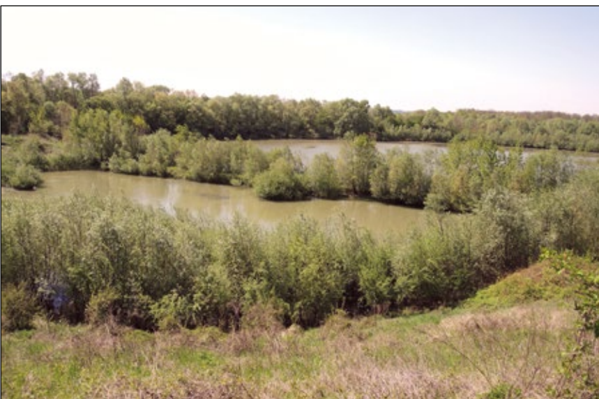
Abb. 7: Versickerungsbecken des Haidbaches bei Lindenlach / Hörsching im Jahr 2017

bis zu 50 ha große, langfristig bestehende Grundwasserteiche sein. In den meisten Kiesabbaugebieten wird Abbaumaterial durch Auswaschen von Feinsedimenten gereinigt. Dadurch entstehen Flachwasserbereiche und mit fortschreitender Sukzession Seggen- und Schilfröhricht. Im Idealfall werden in Abbaugebieten Feuchtgebiete etwa in Form von größeren Altarmen mit Verlandungszonen geplant modelliert, wie großflächig und über Jahrzehnte konzipiert in Abbaugebieten der Welser Kieswerke Treul in den Donauauen bei Pulgarn (Abb. 5).