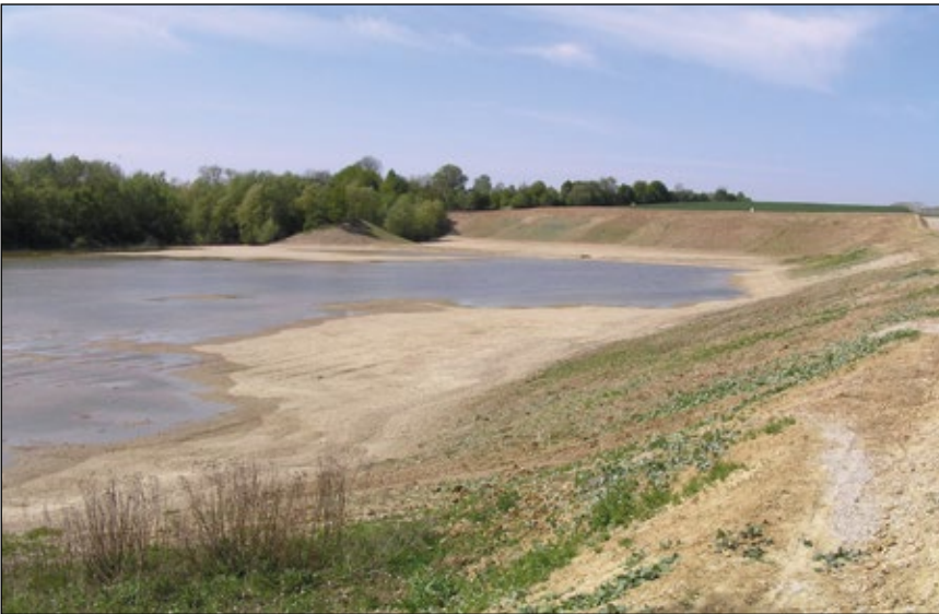
Abb. 6: Versickerungsbecken des Haidbaches bei Lindenlach / Hörsching nach der Errichtung im Jahr 2007