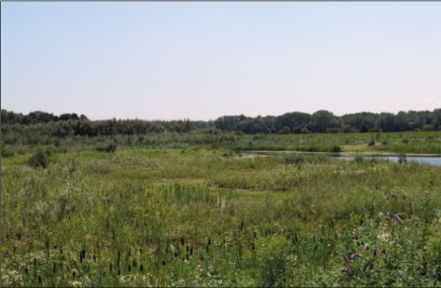
Abb. 5: Kiesgrube der Welser Kieswerke in den Donauauen bei Pulgarn, ein Langzeitprojekt mit der Entwicklung hochwertiger Feuchtgebiete für Vogelarten