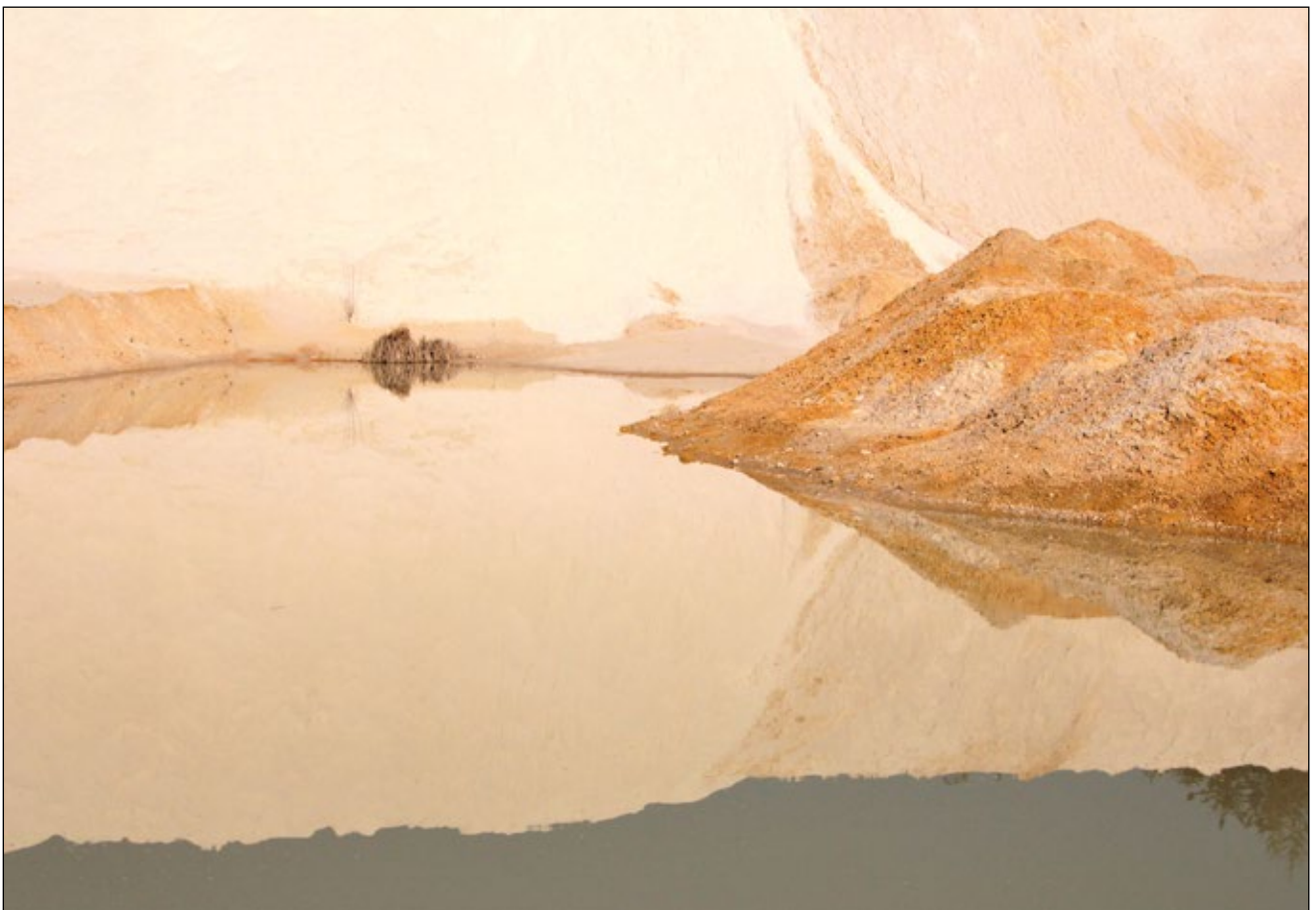
Abb. 8: Ein Traum in Pastell – Lichtspiele in der Quarzsandgrube bei Münzkirchen