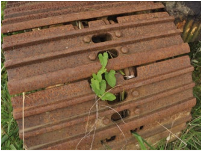
Abb. 6: Natur überwindet Technik – eine unlogische Kettenreaktion!