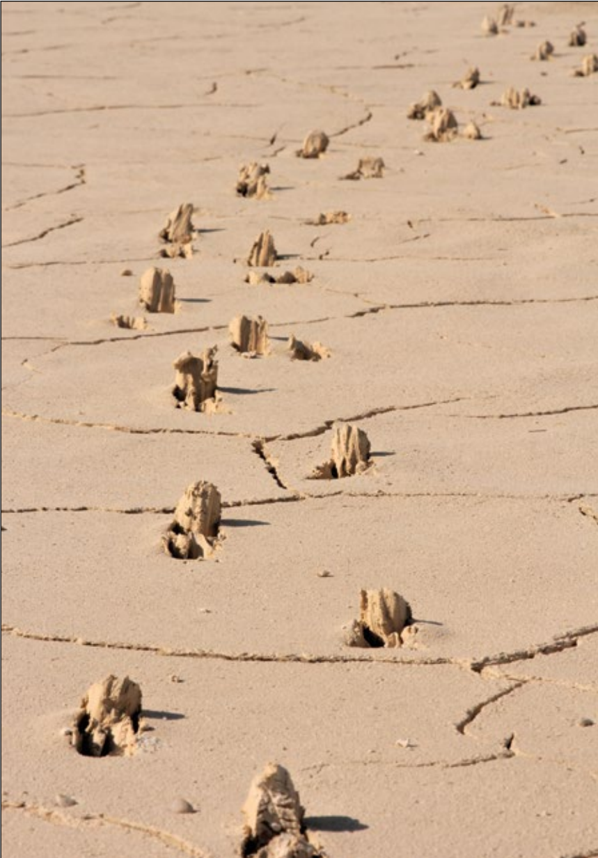
Abb. 9: Auf allen Vieren – tiefschürfende Rehspuren im Schlamm einer Schottergrube