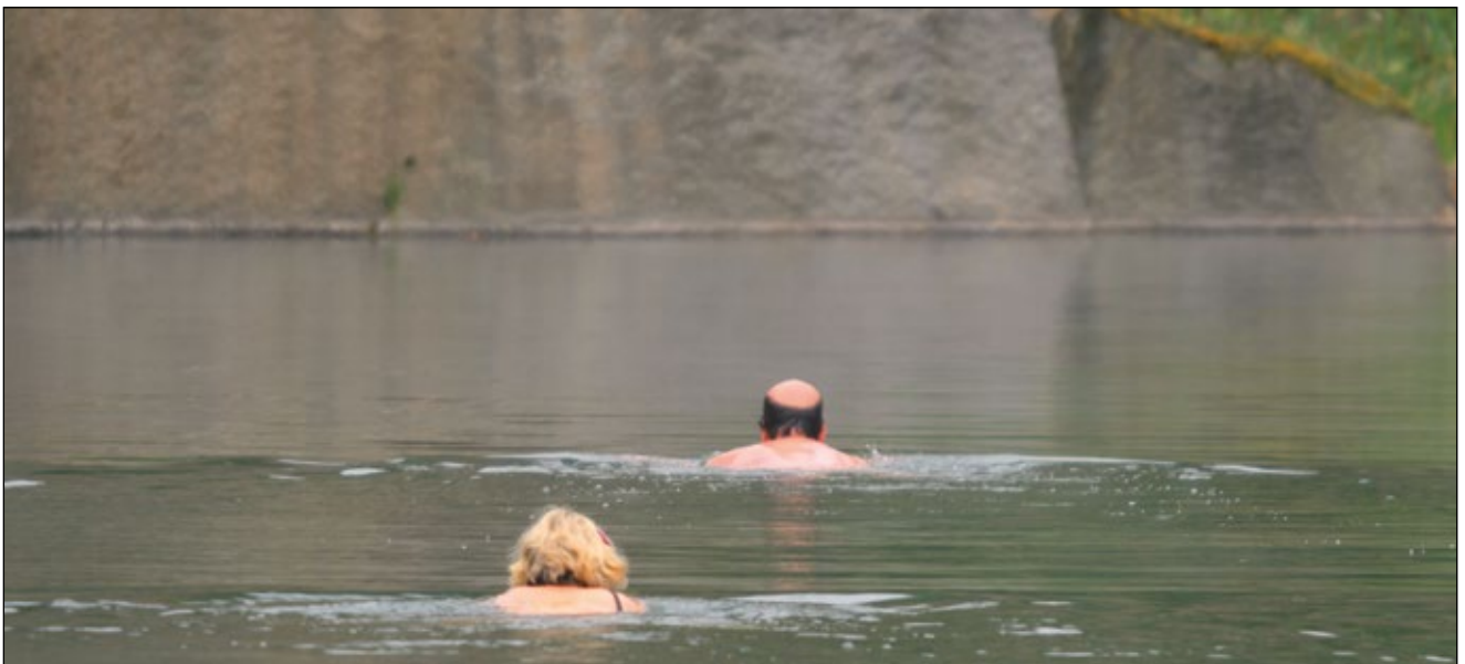
Abb. 3: Zwei einsame Schwimmer im Steinbruch – vor ihnen die Wand, hinter ihnen der Fotograf, dazwischen kühler Genuss

und nachhaltige Beeinträchtigung des Landschaftsbildes durch Abgrabungseingriffe: „Dies ist dort der Fall, wo sich die zurückbleibenden Abgrabungsformen nicht in ihre Umgebung einfügen, sondern durch ihre Fremdartigkeit, Häufung oder Ausdehnung auffällig und störend absetzen. Durch Entnahmestellen kommt es häufig zu einer Zernagung, Zerlöcherung und Uniformierung der Landschaft ...“ So heißt es noch in den „Richtlinien aus der Sicht des Natur- und Landschaftsschutzes für die Entnahme von