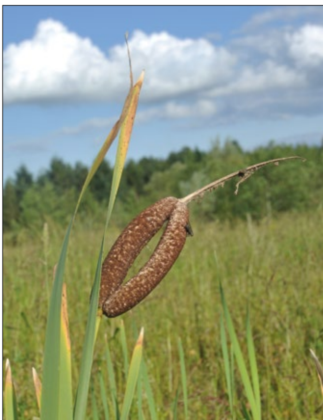
Abb. 12: Krumme Dinger in einer Schottergrube bei Gilgenberg – ein Paar Rohrkolben ( Typha latifolia ) auf Abwegen!