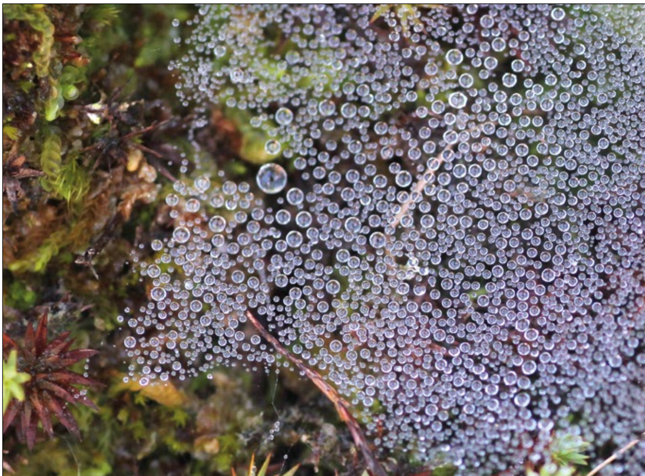
Abb. 11: Tautropfen als Morgengabe – wer zählt die vielen kleinen Wunder? – Mittag ist es zu spät!