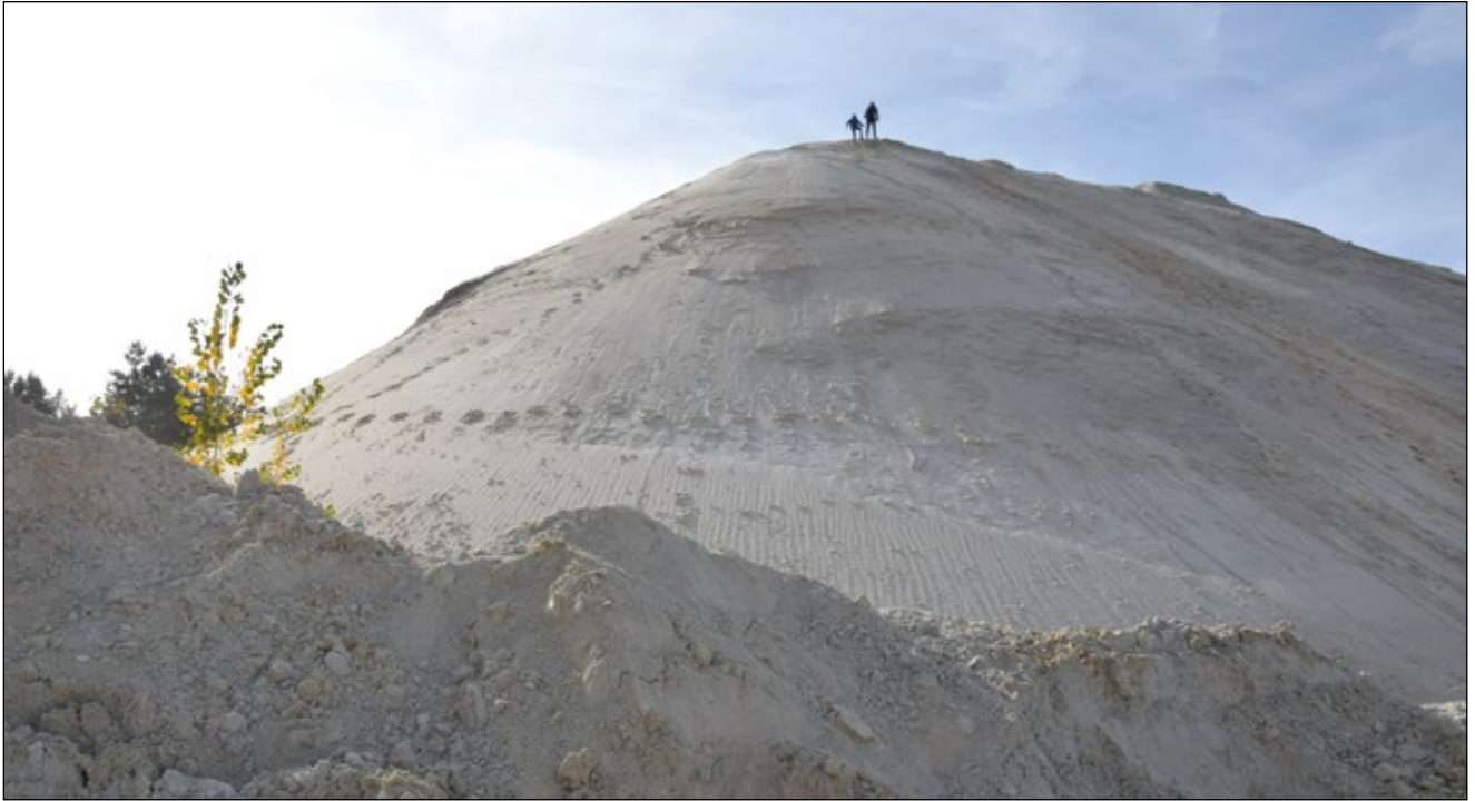
Abb. 2: Zwei junge Gipfelstürmer auf einem Quarzsandberg in der Sandgrube bei Münzkirchen – eine junge Schwarz-Pappel schaut zu und sieht sich leid.