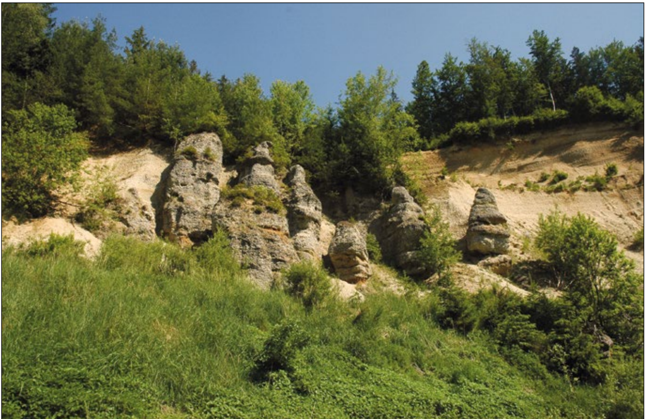
Abb. 1: Alte Waldschottergrube im Kobernauerwald bei Hocheck/Waldzell – verwitterte Konglomerate bilden den „Mount Rushmore“ des Innviertels – Gesichtsverlust in Steinkultur.

Raiffeisenweg 130 4794 Kopfing flechten.berger@aon.at