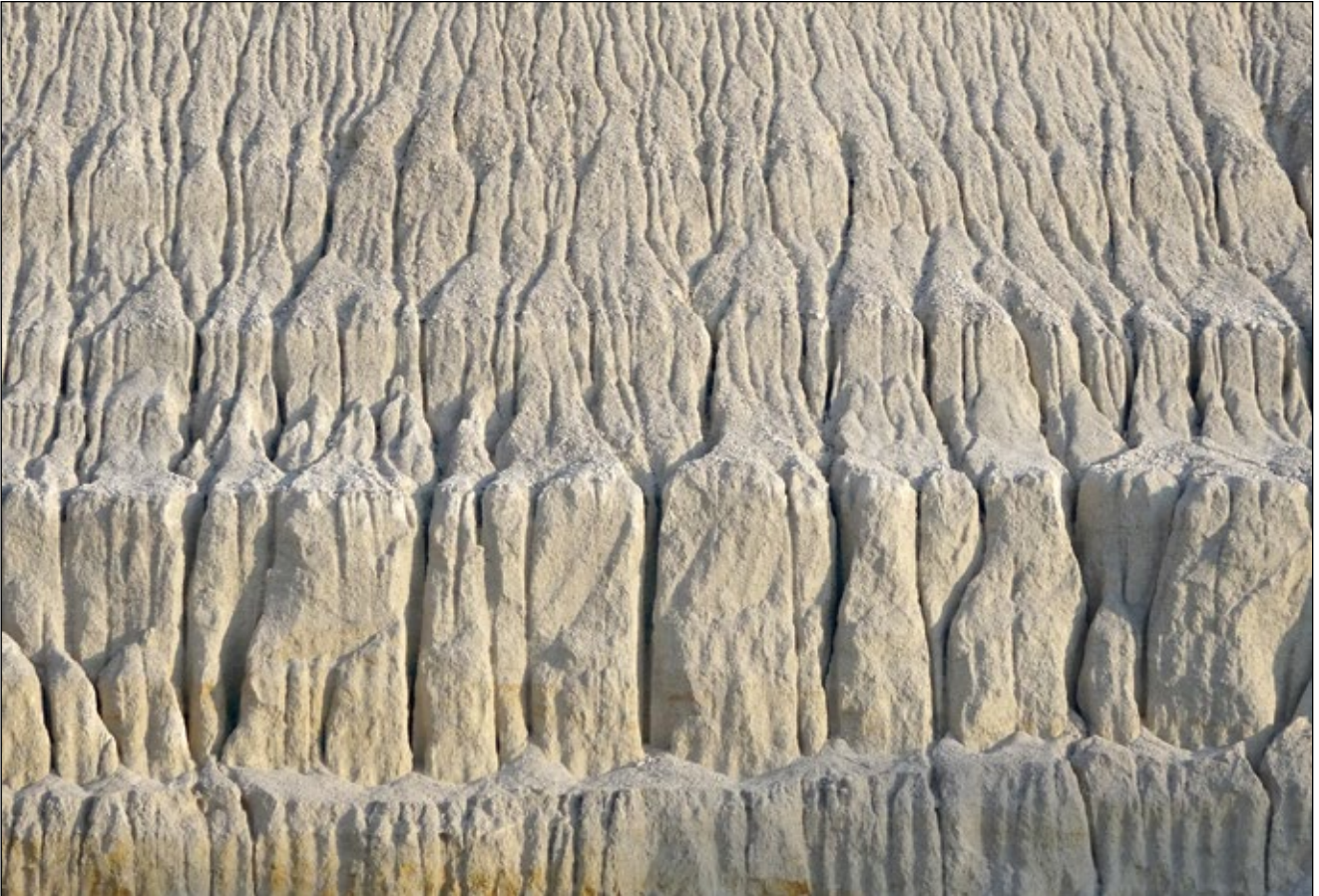
Abb. 4: Regen als einschneidendes Erlebnis im Leben einer Sandgrube