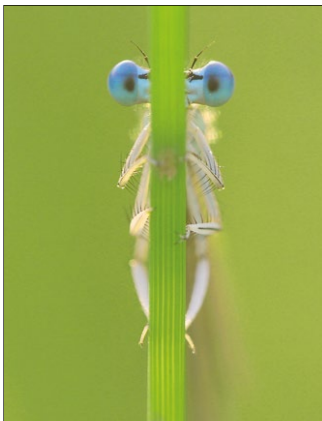
Abb. 13: „Hinter meiner, vorder meiner, links, rechts güts nix ...“, flüsterte die Libelle und entschwand ... allerhand!