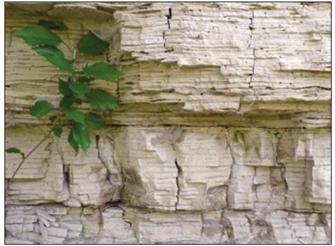
Abb. 7: Tontaubenschüsse – oder – Akupunktur einer Schlierwand!

(Abb. 2)! An solchen Orten findet soziales und ökologisches Lernen statt, ganz automatisch, gratis, real, nicht virtuell. Und das macht ihnen sichtlich Spaß! Auch so manches erwachsene Kind genießt den Reiz des Verbotenen oder des Betretens „auf eigene Gefahr“ (Abb. 3).