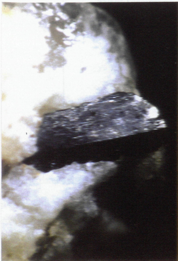
Columbit 3 mm