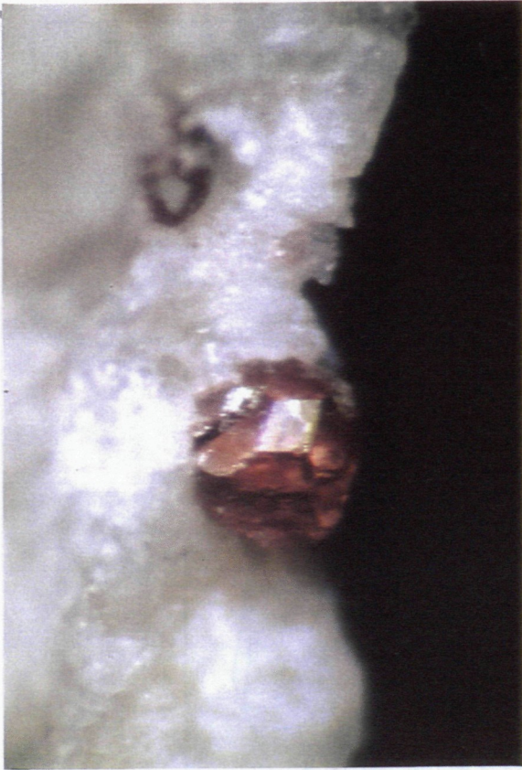
Granat 1 mm