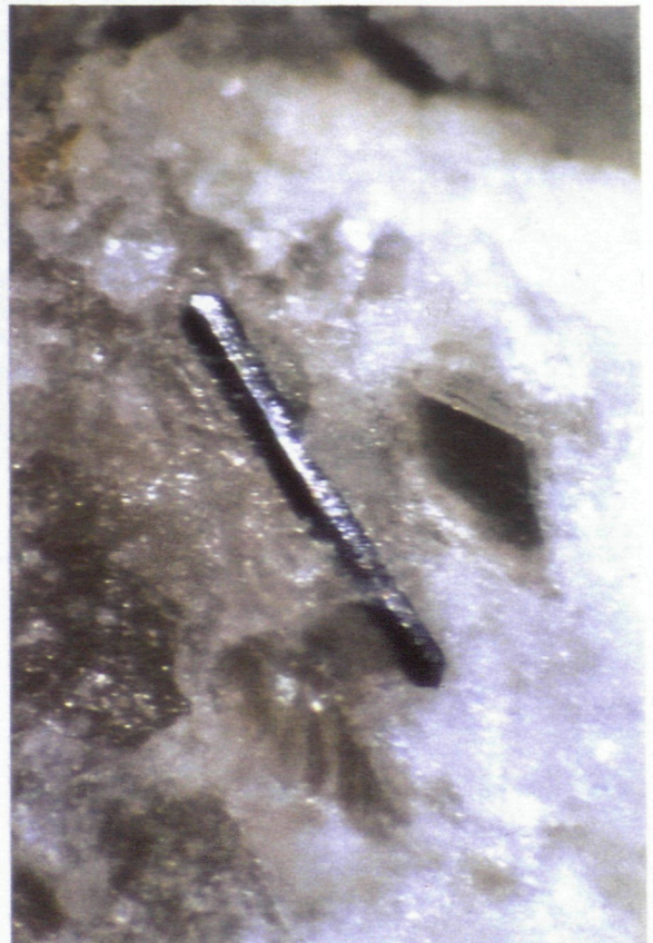
Columbit 1 mm