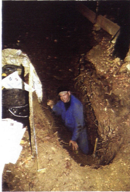
Fundstelle während der Bergungsarbeiten