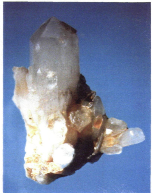
Bergkristallstufe Größe 7cm