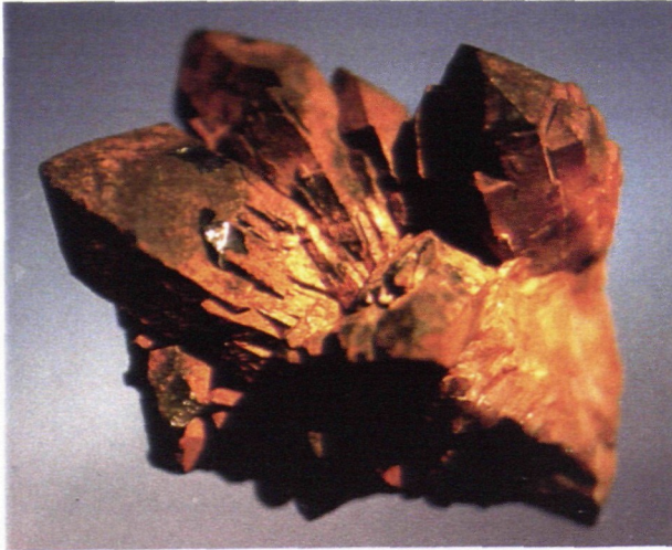
Bergkristallstufe mit Limonitbelag Größe 8 cm