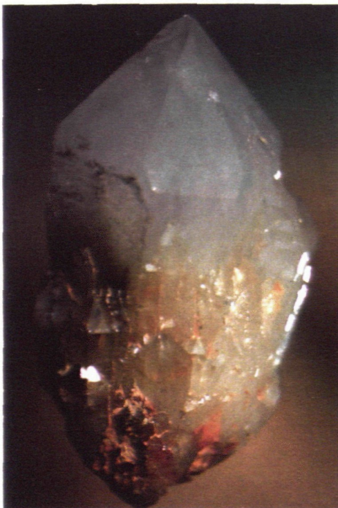
Bergkristall-Doppelender Höhe 7cm