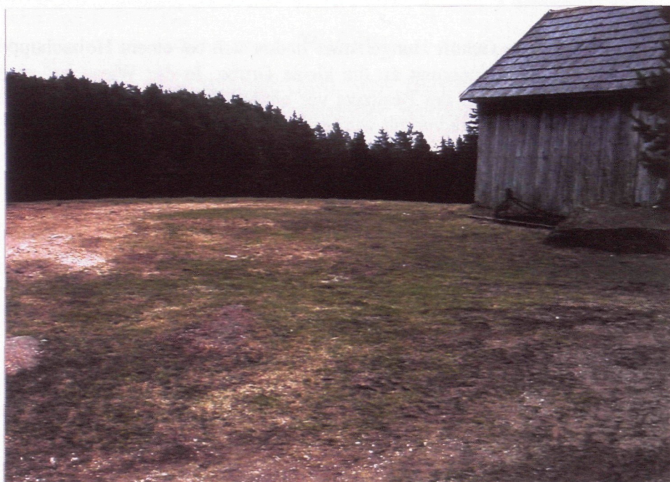
Abb. 2: Situation beim Gehöft Hungerbauer, Blickrichtung Südost; in Bildmitte die noch erkennbare Mulde, vor der Hütte ein Kinzigitblock