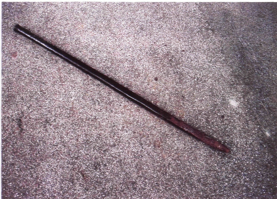
Abb. 1: Eisenstange aus Eisen vom Hungerbauer, Länge 127 cm, Durchmesser 3cm.