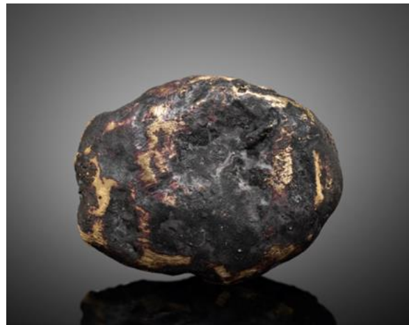
Abb. 5: Schmelzgold Rauris, 12 x 10 x 3mm Rückseite

Unter seinen vielen bemerkenswerten Funden möchten wir noch einen hervorheben. Bei mehreren Begehungen des alten Bernegger Bruchs, „Dürres Eck“, Gaisberg bei Molln gelang Rupert neben Bleiglanz-Einsprengungen, faustgroßen derben blauen Coelestineinschlüssen und Strontianitbüscheln auch der Fund von glasklaren Coelestinkristallen mit Phantombildung im Bereich von 1 cm Kristallgröße.