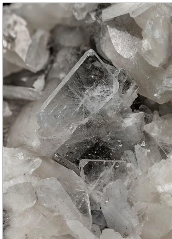
Abb. 7: Coelestin mit Phantombildung, 10 mm Bernegger Bruch, Gaisberg, OÖ.