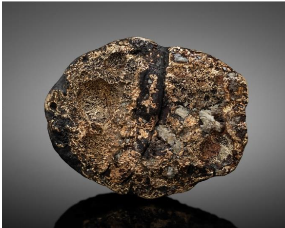
Abb. 4: Schmelzgold Rauris, 12 x 10 x 3mm Vorderseite