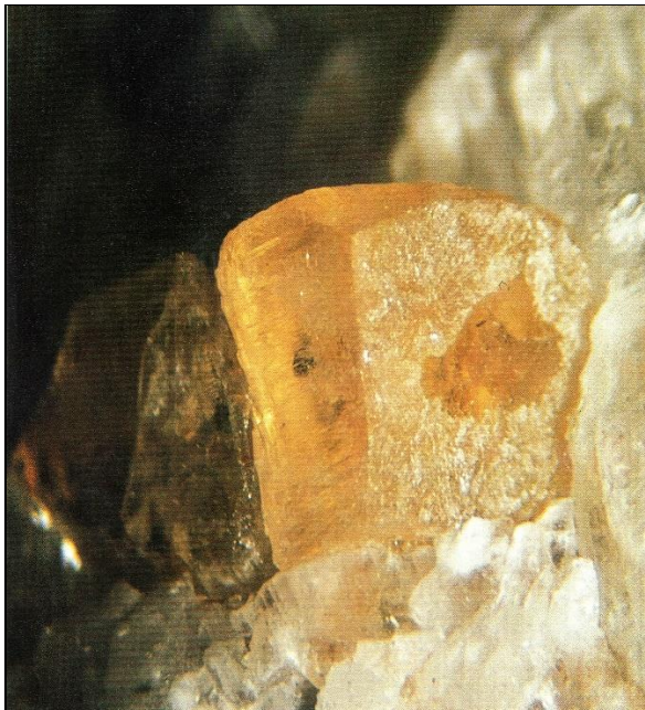
Abb. 2: Wagnerit, Bosruck-Autobahntunnel, OÖ. Kristallhöhe 2 cm