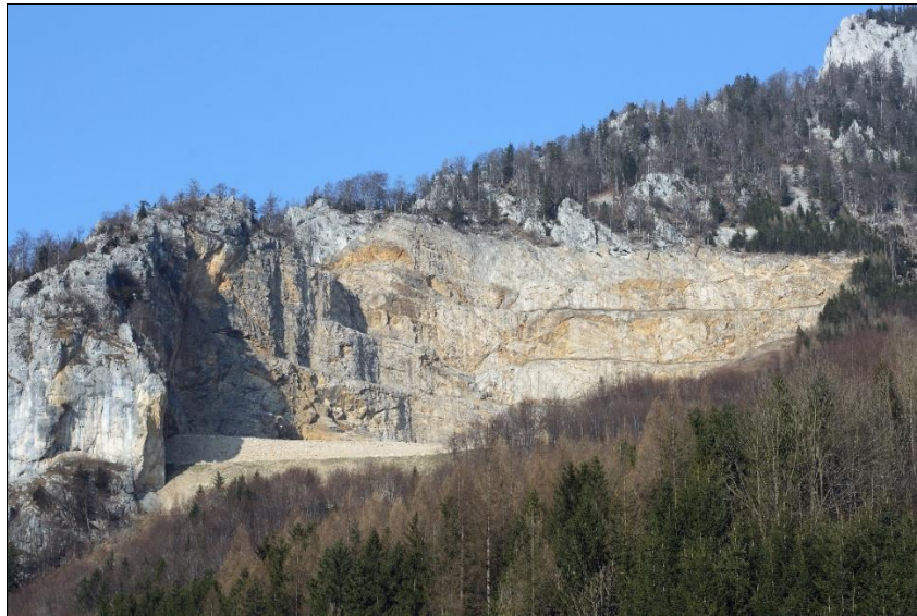
Abb. 8: Bernegger Bruch „Dürres Eck“, Gaisberg bei Molln, OÖ.