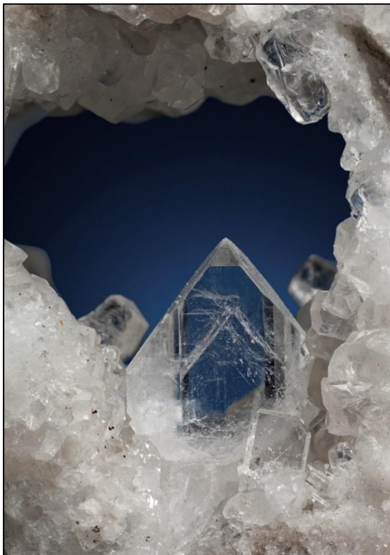
Abb. 6: Coelestin mit Phantombildung, 10 mm Bernegger Bruch, Gaisberg, OÖ.

Unter seinen vielen bemerkenswerten Funden möchten wir noch einen hervorheben. Bei mehreren Begehungen des alten Bernegger Bruchs, „Dürres Eck“, Gaisberg bei Molln gelang Rupert neben Bleiglanz-Einsprengungen, faustgroßen derben blauen Coelestineinschlüssen und Strontianitbüscheln auch der Fund von glasklaren Coelestinkristallen mit Phantombildung im Bereich von 1 cm Kristallgröße.