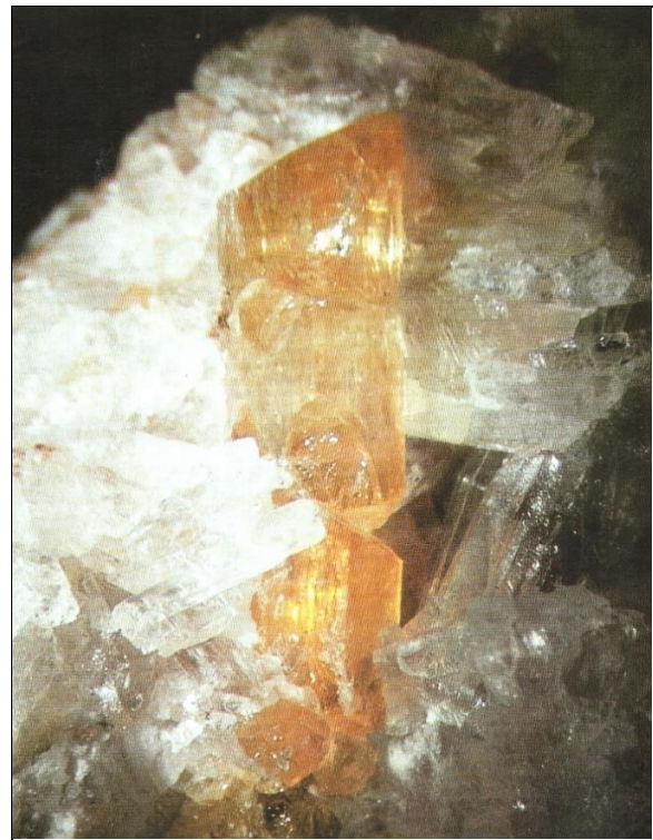
Abb. 3: Wagnerit, Bosruck-Autobahntunnel, OÖ. Kristallhöhe 2 cm

Wie in vielen Fällen der Vergangenheit brachte eine sofortige Begehung des Gebietes unzählige, vorher unbeachtete Wagneritbruchstücke zu Tage, aber keines erreichte jemals die Qualität von Ruperts Erstfund (Lit.: Otmar Wallenta, „Bosruck“, Die Eisenblüte, 1985, Nr. 15, S.9-17).