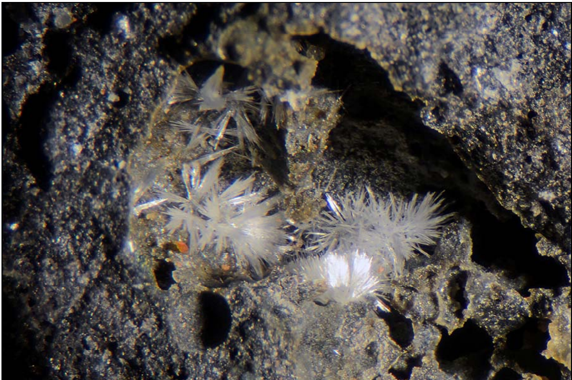
Abb. 6: Aragonit, Acker Bauer Maier Steyr, Bildbreite 5mm