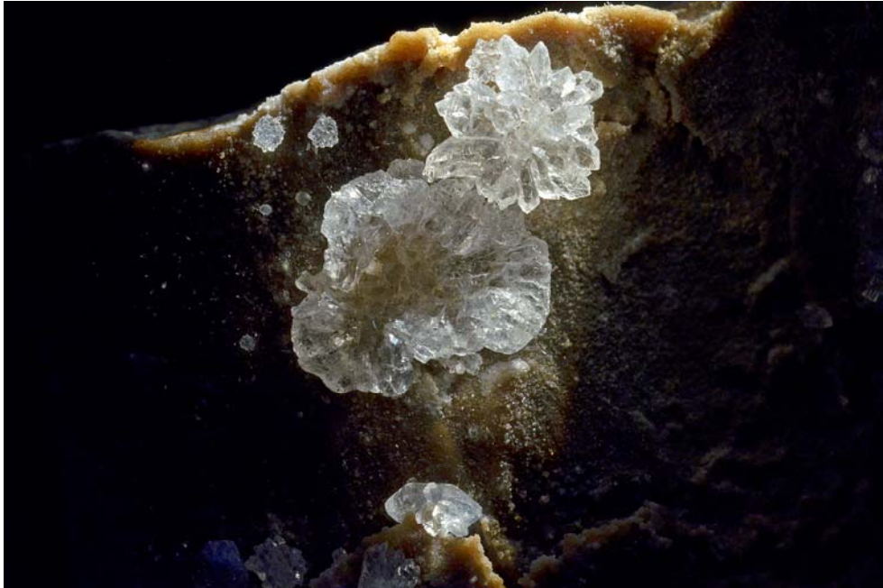
Abb.1: Quarz („Rosettenquarz“), Pucking, OÖ., Bildbreite 2,5 cm