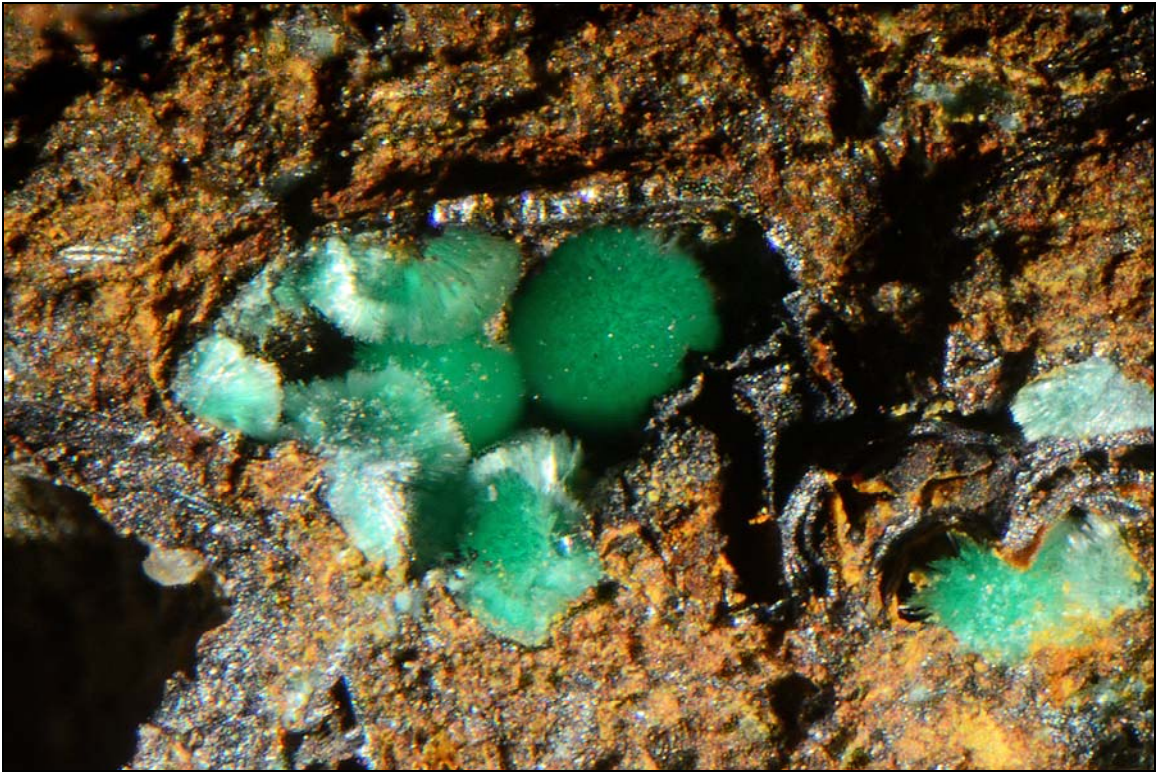
Abb. 5: Malachit, Garsten/Steyr, OÖ., Bildbreite 1,75 mm