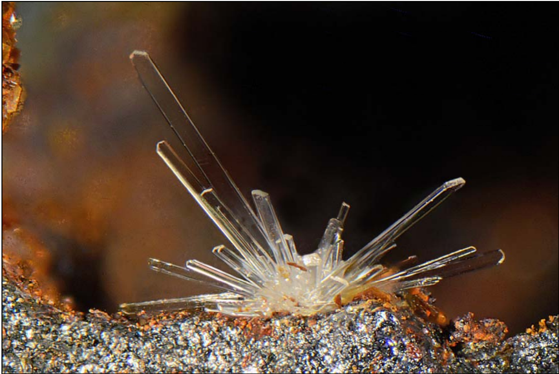
Abb. 3: Gips, Zwischenbrücken, Steyr, OÖ., Bildbreite 2,75 mm