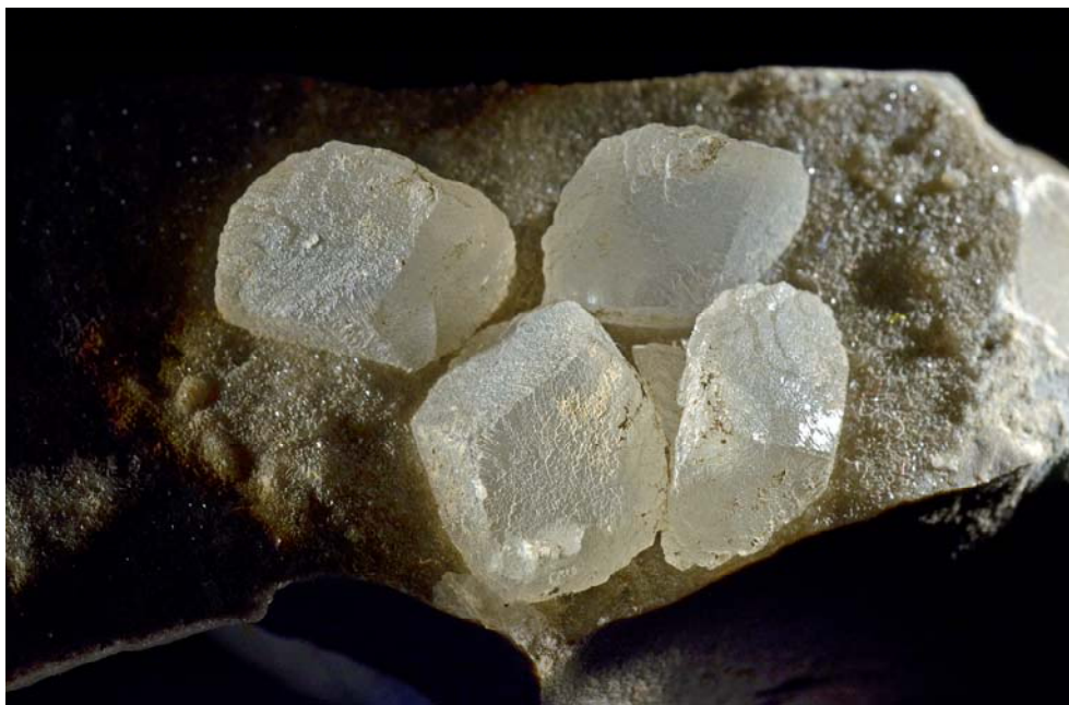
Abb. 2: Calcit, Pucking, OÖ., Kristallgröße 1,0 x 0,5 cm