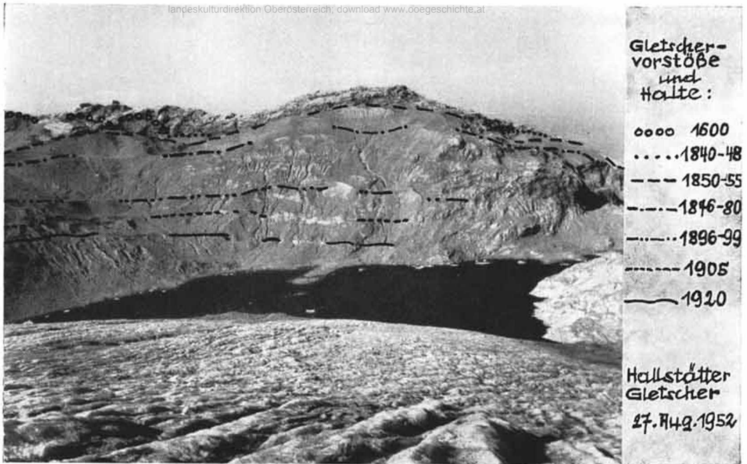
Abb. 2: Die Zunge des Hallstätter-Gletschers mit dem Eissee und den Gletscherständen am Süabhäng des Taubenriedls