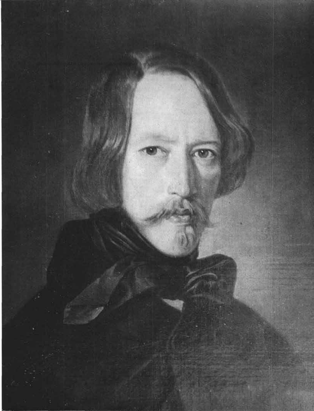
Jugendliches Bildnis Franz Stelzhamers im OÖ. Landesmuseum; Öl auf Leinwand, unbekannter Maler der Münchener Schule.