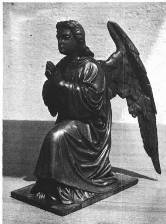
Abb. 2: Engelfigur aus Lindenholz von J. Koller; Privatbesitz.