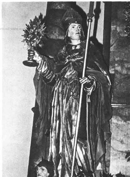
Abb. 3: Hl. Norbert, Statue am Hochaltar der Pfarrkirche Schwarzenberg, 1912 gefertigt.

Zu: F. Haudum, Jordan Koller