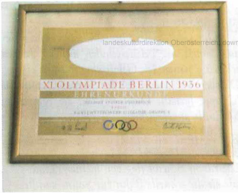
Ehrenurkunde der XI. Olympiade Berlin 1936, Kunstwettbewerb Literatur.

Noch in den Grundregeln der Olympischen Spiele 1942 heißt es: