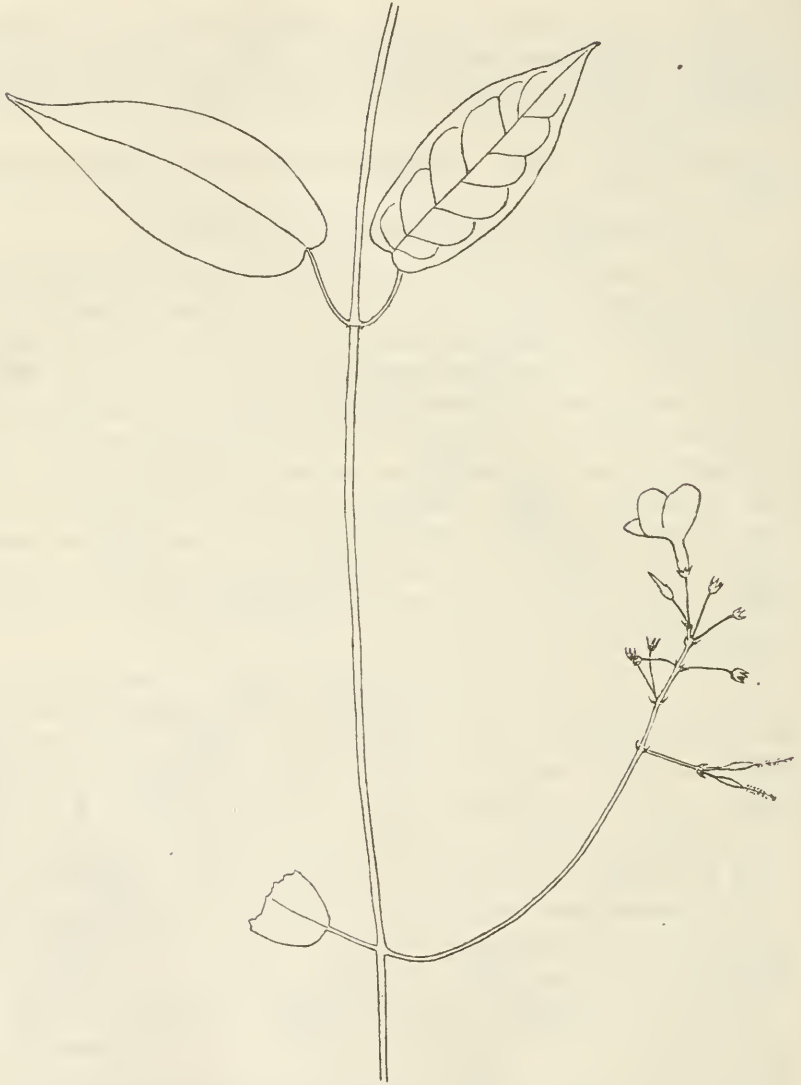
Fig. 2. Anechites lappulacea (Lam.) Miers.

Tournefort erwähnt p. 92 unsere Pflanze: „ Apocynum Ameri-