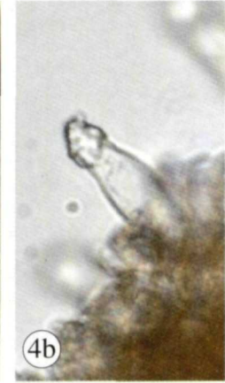
Abb. 1. Zinödlwald, Fundort von Trichaptum laricinum , subalpiner Fichtenwald mit hohem Totholzanteil. – Abb. 2. Zinödlwald (links) mit dem Hochzinödl (2191 m). – Abb. 3. Trichaptum laricinum , Habitus, links Oberseite, rechts Unterseite mit lamelligem Hymenophor, Länge der Fruchtkörper 2 cm, Breite 1 cm. – Abb. 4. Trichaptum laricinum , a Zystiden mit Kristallschopf, Maß: 10 \mu m, b einzelne Zystide im Hymenium, Maß: 10 \mu m.