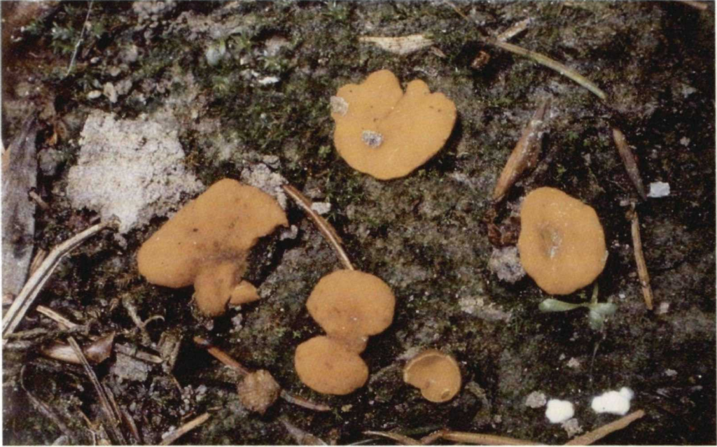
Abb. 2. Koelabaea delectans , Deutschland, Burghausen-Raitenhaslach.