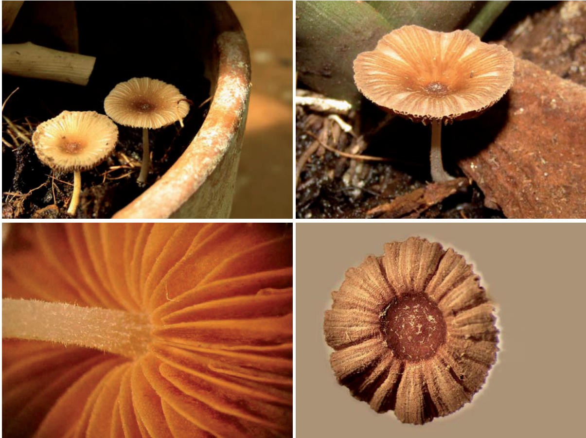
Abb. 1. Galerella plicatella . Habitus, Lamellen, Hutoberseite.