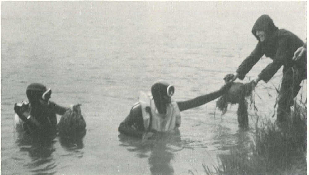
Taucher halfen bei der Ansiedlung von Unterwasserpflanzen im Baggersee bei Brederis.