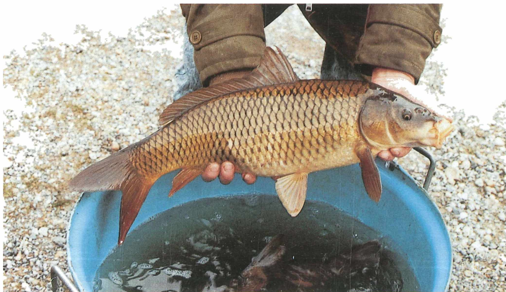
Wildkarpfenrogner aus Regelsbrunn (Artikel über Wildkarpfen siehe Seite 236)