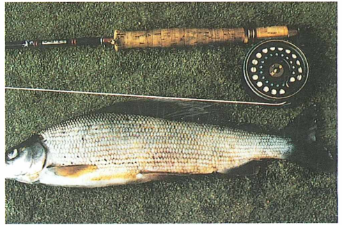
Kapitale Äsche in der Traun nahe Ischl vor dem Hochwasser auf Fliege gefangen.