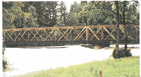
Traun bei Bad Ischl während des verheerenden Hochwassers.

Der Verband der Österreichischen Arbeiterfischereivereine (VÖAFV) wünscht allen Mitgliedern, Freunden und Gönnern ein frohes Weihnachtsfest und alles Gute für das kommende Jahr.