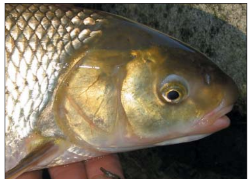
Abb. 3: Kopf mit unterständigem Maul

Das Verbreitungsgebiet von Rutilus meidingeri ist auf das Einzugsgebiet der Oberen Donau beschränkt. Gute Bestände des Perlfisches gibt es heute noch im Atter-, Mond- und Wolfgangsee. Perlfische führen hier Laichzüge in die Zubringer (Mondseer, Zeller und Ischler Ache) durch, ein Abbläichen in den Seen selbst ist aber nicht auszuschließen. Im Traunsee gilt die Art als verschollen (Gassner et al., 2003).