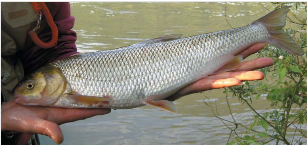
Abb. 1: Mit der Angel gefangener Perlfisch aus der Donau bei Engelhartzell

This paper presents several records from the Aschach impoundment of the Danube in 2004, which is separated from the Traun-Danube-System by two dams. This provides strong evidence for a self-sustaining river population in this Danube stretch. Further investigations are needed to clarify the knowledge of ecology, distribution, origins and genetic relationships of this population.