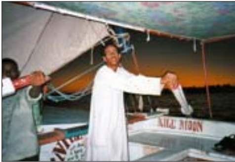
Fellachen-Bootsleute mit ihren »Faluka«-Seglern am Nil unterwegs

sche und Weißfische angeln. Die Fellachen und Nubier sind sehr freundlich, doch muss man ganz strikt einen Preis mit ihnen ausmachen, sonst verlangen sie zum Schluss mehr Geld.