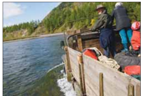
Anfahrt auf der Lkw-Ladefläche

Zurück in Irkutsk, treffen wir den Pensionisten Aleksej, der uns weiter bis ins Sayangebirge begleiten wird. Er gehört dem buryatischen Volksstamm an, der eng mit den Mongolen verwandten Bevölkerung der Gegend um den Baikale. Zuerst legen wir 400 km Straße von Irkutsk über Sljudjanka am Südeinde des Sees, das Tunka-Tal, mit breiten Wiesen und Dörfern typischer buryatischer Holzhäuser bis an den Rand des Gebirges zurück, wo schneebedeckte 3000er und das rauschende, glasklare Wasser des Irkut-Flus-