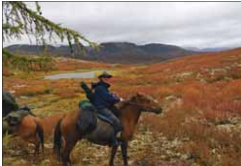
Passhöhe an der Grenze nach Tuwa

unserer Bootstour über die Berge begleiten, wofür drei Tage veranschlagt sind. Der Lkw-Fahrer bringt uns noch zwei Fahrstunden weiter stromauf, wo wir beim Ausfluss des wunderschönen Gebirgssees Schuchtalai Nuur übernachten.