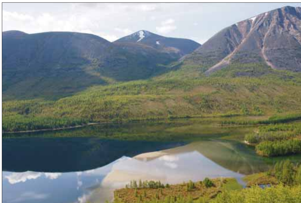
Spiegelung im Schuchtalai Nuur

angebracht ist, zeigt sich, als wir gleich am Anfang die Oka auf einer hundert Meter breiten und über weite Strecken mehr als einen Meter tiefen Furt durchqueren. Weiter führt die Route den ganzen Tag das Tal des Tissa-Flusses stromauf, wobei größtenteils das Flussbett als »Straße« benutzt wird, um dichtem Wald oder Sumpf auszuweichen. Vereinzelt liegen hier auf 1400 m Seehöhe noch Gehöfte, die, ähnlich wie die heimischen Almen, im Sommer zur Rinderzucht bezogen werden. Viele Stunden später erreichen wir die letzte menschliche Ansiedlung. Der hier mit seiner Familie lebende Buryate Zseseren wird uns mit seinen Pferden bis zum Ausgangspunkt