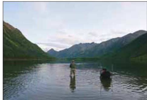
Fischen am Bergsee Belin Chol

Am Ufer des Sees angekommen, werden rasch die Fliegengerten zusammengesteckt, um herauszufinden, wer die verheißungsvollen Ringe an der Wasseroberfläche verursacht: Es sind Äschen, die vor allem beim Einrinn in enorm hoher Zahl konzentriert stehen. Wahrscheinlich dürfte der Futterneid dafür verantwortlich sein, dass sie hier nicht (wie weiter stromab) selektiv nur auf bestimmte Köder beißen, sondern fast jede Fliege vor-