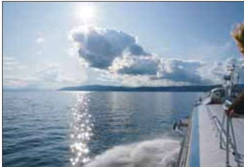
Rückfahrt nach Irkutsk

Der einzige Ausfluss, die Angara, wurde in den fünfziger Jahren bei Irkutsk gestaut. Der Wasserspiegel des gesamten Sees dürfte dadurch um mehr als einen Meter angehoben worden sein (die Angaben darüber sind aber