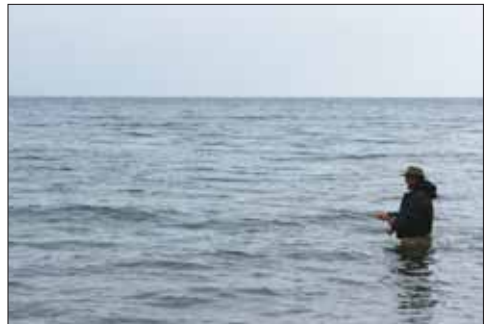
Erfolgsloses Fischen an Baikal