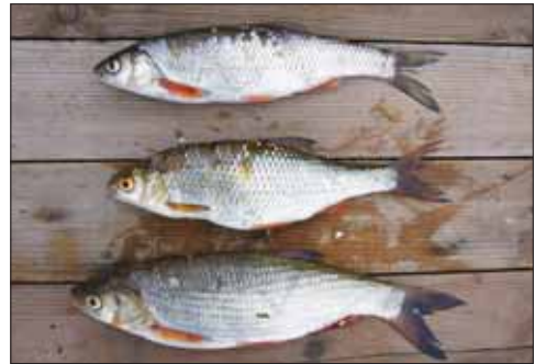
Baikale-Hasel, Rotaug und Nerfling

Die Zeit vergeht viel zu schnell, doch als nach zwei Nächten am Baikale unser Biorhythmus auf die Zeitzone 7 Stunden östlich der MEZ eingestellt ist, überwiegt der Tatendrang den Schmerz des Abschieds vom »heiligen Meer Sibiriens«.