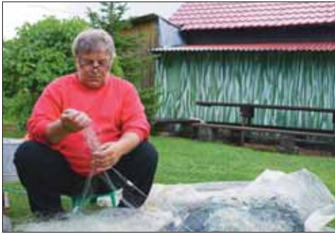
Wassily beim Netzauslösen

Von dieser pelagischen Koppenart hängen auch viele Adulte in den Maschen, die mit ihren riesengroßen, knallig gelb gefärbten Brustflossen auffallen. Als weiteren Vertreter der Cottocomephoriden findet sich die Großköpfige Baikalgroppe, Batrachocottus baicalensis (Dybowski, 1874). Leider fehlen in den seicht gestellten Netzen die im Freiwasser bis in große Tiefen dominanten Fische, die eigenartigen Fettfische (Golomyanka, Comephorus baicalensis Pallas, 1776 und C. dybowski Korotneff, 1905). Der Name dieser ebenfalls zu den Koppen verwandten Baikale-Endemiten