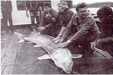
Abb. 6: Hausen, gefangen in der Nähe von Paks, Ungarn im Jahr 1987. Es handelt sich um das letzte große dokumentierte Exemplar in der Mittleren Donau nach dem Bau der Kraftwerke am Eisernen Tor.

Hausen, Huso huso L. 1758. « Die Angaben zum Hausen beruhen jedoch auf reinen Mutmaßungen und sind nicht belegbar, weshalb ein Vorkommen in der Steirischen Mur und erst Recht in der Raab aus heutiger Sicht auszuschließen ist (Woschitz, 2006).