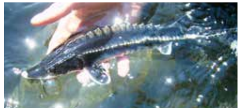
Abb. 7: 0+ Hausen des Wolgastammes aus einer Fischzucht in Deutschland.

Das aktuelle Vorkommen beschränkt sich auf die Untere Donau, vom Delta bis zu den Djerdap-Dämmen am Eisernen Tor. Die letzten beiden bekannten Hausenfänge flussauf der Kraftwerke am Eisernen Tor stammen aus der Ungarischen Donau (1972 und 1987 [Abb. 6]), wobei letzteres Individuum beide Dämme vermutlich über die Schiffsschleusen überwand (Guti, 2008). Generell werden in der Donau eine Herbst- und eine Frühjahrsform des Hausen unterschieden (z. B. Holčík, 1989; Khodorevskaya et al., 2009; Friedrich, 2013). Während die Herbstform im Herbst in die Flüsse wandert, dort überwintert und im Frühjahr nach einer