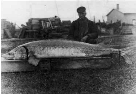
Abb. 4: Vermeintlicher Hausenfang bei Straubing – in Wirklichkeit ein Atlantischer Stör von der Samlandküste (Ostsee)

Konkrete Hinweise auf Hausenfänge in der Bayerischen Donau sind für die 2. Hälfte des 19. Jahrhunderts ebenfalls rar. Während der Hausen bei Passau in der 1. Hälfte des 19. Jahrhunderts nach Wagner (1846) noch öfters gefangen wurde (konkrete Fangnachweise werden allerdings nicht genannt), liegt für die Jahrhundertwende nur eine vage Angabe über einen »vor wenigen Jahren« getätigten Fang aus dieser Gegend vor (Vogt & Hofer, 1909). Bislang konnten dazu jedoch weder Presseberichte noch sonstige Hinweise