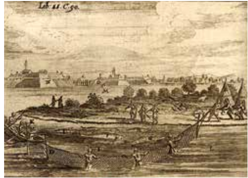
Abb. 1: Fang verschiedener Störarten in der Mittleren Donau. Im Bild links ist ein Fangzaun angedeutet. Weiters ist die Verarbeitung (Einsalzen in Fässern) dargestellt (aus Marsigli, 1726). Rechts: Störfang bei Komárno (aus Hohberg, 1682)