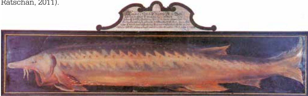
Abb. 5: Hausen aus der Salzach bei Tittmoning (1617). Ölgemälde im Jagdzimmer von Schloss Hellbrunn bei Salzburg.

Hinweise auf einen möglichen Hausenfang im Inn bei Reichersberg (vermutlich um 1880) können nicht überprüft werden, da das Belegexemplar im dortigen Stift nicht mehr vorhanden ist. Der Hausen stieg jedoch nachweislich in die Salzach auf, was durch einen Einzelfang (6. Februar 1617 bei Tittmoning, Hausen mit ca. 3,5 m Länge und 133 kg) belegt ist ( Abb. 5 ). Folglich kam er auch im Unteren Inn sporadisch vor (Schmall & Ratschan, 2011).