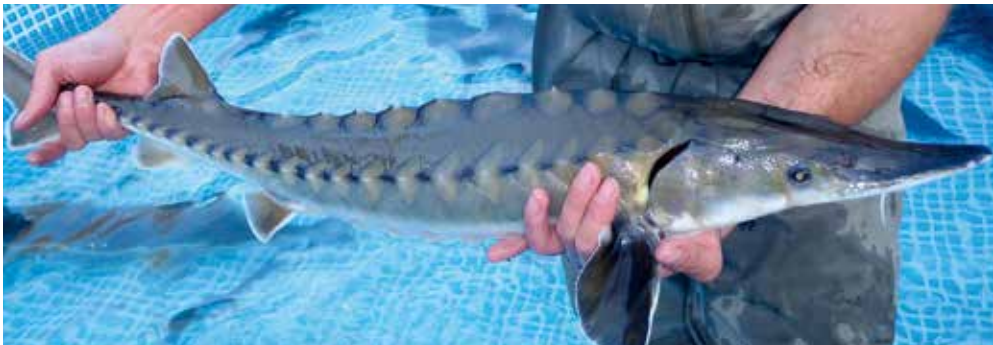
Abb. 8: Atlantischer Stör. Die Art ähnelt äußerlich stark dem Europäischen Stör.

Der Atlantische Stör (Abb. 8) ist an der Ostküste Nordamerikas sowie in der Ostsee heimisch. Er ist erst seit sehr kurzer Zeit in Aquakulturen erhältlich und wurde bisher nur in sehr geringen Mengen als Zierfisch nach Österreich eingeführt.