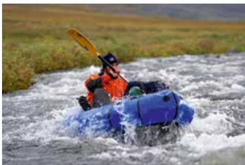
Wildwasseretappe unterhalb des Passes

Die Fischerei an diesem fantastischen Lagerplatz enttäuscht leider. Mit der Angelrute ist kein einziger Fisch zu fangen, ein kleiner Kescher verhilft zu einer Jungäsche. Es handelt sich hier – nur 25 km Luftlinie vom Fangort der kapitalen Europäischen Äschen jenseits der Berge – um Arktische Äschen ( Thymallus arcticus ). Der Jungfisch ist jetzt,