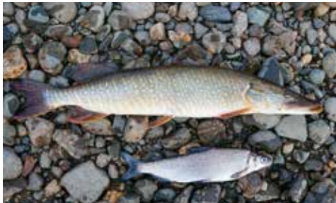
Hecht mit Hauptbeute Peled-Maräne

Anhand von im Polarural gesammelten Äschen-Schuppen habe ich Altersanalysen durchgeführt. Sie zeigen, dass die älteste der gefangenen Europäischen Äschen 11 (10+) und die älteste der Arktischen Äschen 13 (12+) Jahre erreicht hat. Das passt gut zu Literaturangaben, dass Europäische Äschen in Mitteleuropa in der Regel maximal 10 Jahre alt werden, in Skandinavien bis zu 13 Jahre. Arktische Äschen sollen langsamer wachsen als Europäische Äschen, mit bis über 20 Jahren aber deutlich älter werden. Die gegenständlichen Daten aus nahe aneinander gelegenen Flüssen dies- und jenseits des Polarurals legen nahe, dass diese interspezifischen Unterschiede bei ähnlichen Umweltbedingungen eher gering sein dürften. Sie können auch durch unterschiedliche lokale Verhältnisse, beispielsweise die hohen Dichten von Elritzen als wertvolle Nahrungsbasis auf der europäischen Seite oder die größere Höhenlage auf der asiatischen Seite des Polarurals erklärbar sein. Deutliche Unterschiede zeigen sich hingegen beim Vergleich mit Äschenpopulationen aus Mitteleuropa. Beide Äschenarten im Polarural wachsen noch deutlich schleppender als etwa die langsamwüchsige Äschenpopulation in der steirischen Enns, und bei weitem langsamer als die schnellwüchsige in der wärmeren Traun (siehe Referenzkurven im Diagramm). Diese Unterschiede sind aufgrund der drastischen Klimaverhältnisse so weit im Norden nicht weiter verwunderlich.