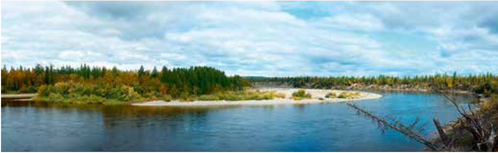
Flusskrümmung am Voikar

dürfte aber gering sein. Ein Kontakt zu diesem begehrten Fisch gelingt erst nach mehreren Tagen kurz vor der Mündung der Lagorta. An einer »heißen« Stelle, wo Felsrippen in den Fluss ragen, provoziert ein Wobler schon nach dem ersten Wurf einen heftigen Biss. Die Rute krümmt sich bis zum Griff – ein starker Taimen hat zugefasst! Leider greift der Haken nicht, und nach 10 Sekunden fliegt mir der Köder entgegen. Die Enttäuschung ist riesengroß! Der Fang eines dieser phantastischen Tiere in allen großen sibirischen Flusseinzugsgebieten (Amur, Lena, Jenissei, Ob) hätte mir viel bedeutet – es hätte dafür nur mehr jenes des Ob gefehlt, wo der Taimen durch Überfischung schon sehr selten geworden ist. Immerhin konnte ich den Lebensraum von Hucho taimen auch hier ganz im Westen kennen lernen.