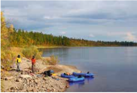
Mittagspause am Voikar Fluss