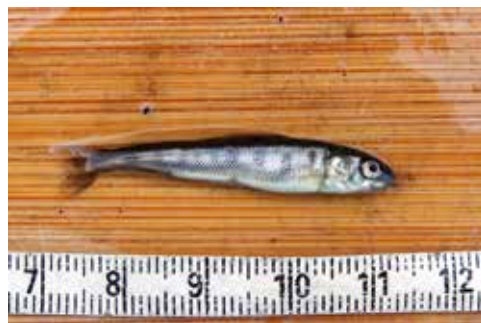
0+ Arktische Äsche