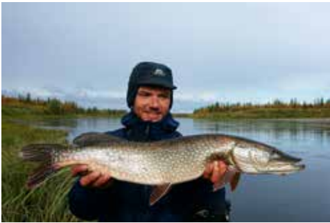
Endlich ein guter Hecht!

Man sieht die Peled-Maränen an allen möglichen Stellen steigen, besonders intensiv im Bereich von Tiefstellen mit langsamen Kehrströmungen. Erste Fischereiversuche mit Trockenfliegen bleiben leider vollständig erfolglos – ganz vereinzelt steigen die Renken zwar danach, der Anschlag geht aber jedes Mal ins Leere. Erst als ich die kleinsten Muster in meiner Fliegenbox an dünnsten Vorfächern präsentiere, klappt die Sache. Als entscheidend entpuppt sich auch ein ganz präzises Timing des Anschlags. Setzt man diesen gleich nach dem Aufspritzen des steigenden Fisches, zieht man ihm die Trockenfliege aus dem Maul. Eine knappe Sekunde später ist gerade noch zeitgerecht, dann spucken die sensiblen Renken die Fliege schon wieder aus.