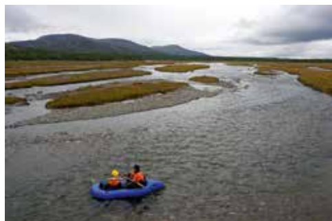
Furkierender Abschnitt der Kleinen Lagorta