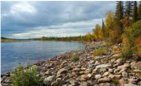
Flusslandschaft am Voikar Fluss