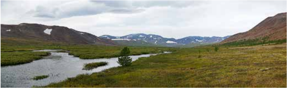
Parklandschaft mitten im Polarural

Mitte August, nur 4,2 cm lang. Zuhause in gemäßigten Breiten erreichen Äschen um diese Jahreszeit schon 10 bis 15 cm. Der Fang dieses Jungfisches zeigt, dass adulte Äschen zumindest zur Laichzeit und wahrscheinlich auch im Sommer bis über unseren Lagerplatz hinaus vorkommen dürften. Bis wir jetzt im beginnenden Herbst auf sie treffen, müssen wir aber noch ein Stück weiter stromab fahren.