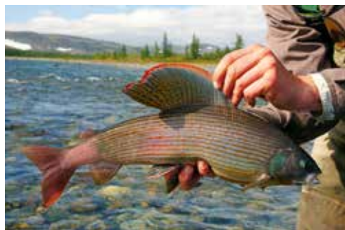
Wunderschöne Arktische Äsche