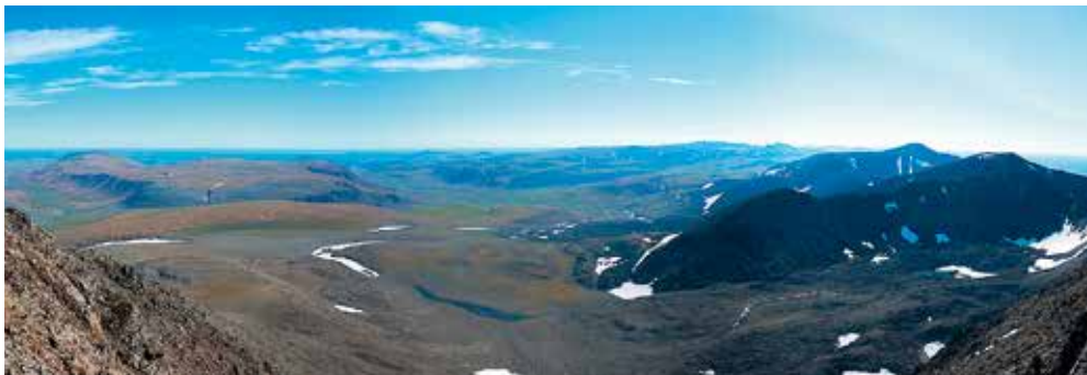
Gipfelblick über die asiatische Seite des Polarurals

Den Zustieg aus Europa haben wir mit je drei Marsch- und drei Bootsetappen in einer Woche geschafft. Jetzt – jenseits des Passes – machen wir mitten im Polarural an einer wunderschönen Stelle Lager: Der Platz am Oberlauf der Kleinen Lagorta ist durch Berge eingerahmt, die jetzt Mitte August noch immer ein Mosaik aus Altschneefeldern dekoriert. Die schon leicht herbstlich verfärbte Gebirgstundra gewährt einen fantastischen Rundumblick, nur vereinzelt stehen an geschützten Stellen zwergenhafte Lärchen. Am Tag nach unserem Gewaltmarsch tut sich ein kurzes Schönwetterloch auf, das wir zum Besteigen eines unbenannten Gipfels nützen, bei dem es sich mit 1157 m Höhe schon um einen der allerhöchsten dieser Gegend handelt.