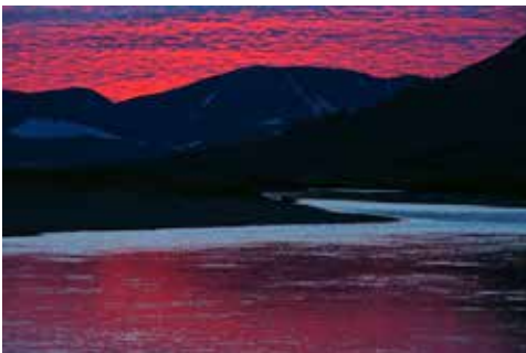
Sonnenuntergang in den Bergen

Der nächste Wurf bringt gleich noch eine dieser Schönheiten zum Vorschein, nur we-