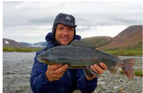
Die erste und größte Arktische Äsche