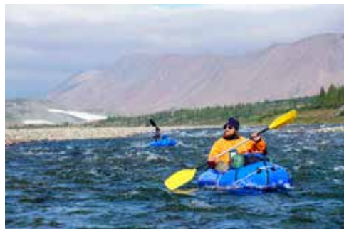
Oberlauf der Kl. Lagorta