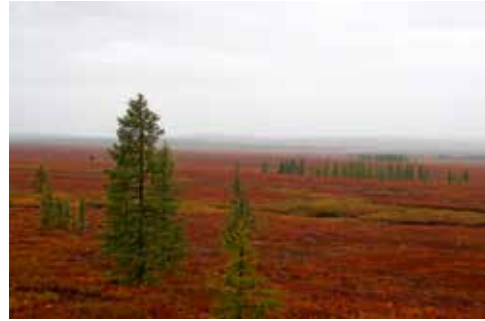
Knallrote Tundra Anfang September

Erst am nächsten Morgen wird klar, dass trotz des Sturmes das Tragflügelboot starten kann, das uns 170 km weiter stromab in die Stadt Salechard bringt. Diese ehemals nördlichste Stadt Russlands liegt an einer Stelle des Ob-Unterlaufs, wo schon 1595 eine Kosakenfestung gegründet wurde. Eine Fähre setzt uns über den Ob nach Labytnangi, die Bahn-Endstation, wo wir die Rückreise nach Moskau antreten. Die Eisenbahn führt im Norden über den Polarural zurück auf die europäische Seite. Als wir unseren Ausgangs-