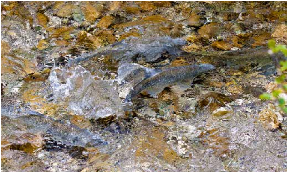
Im Mündungsbereich des Schwarzenbaches laichende Perlfische