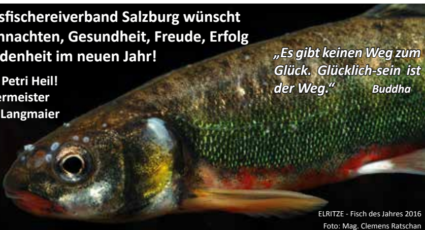
ELRITZE - Fisch des Jahres 2016

„Es gibt keinen Weg zum Glück. Glücklich-sein ist der Weg.“ Buddha