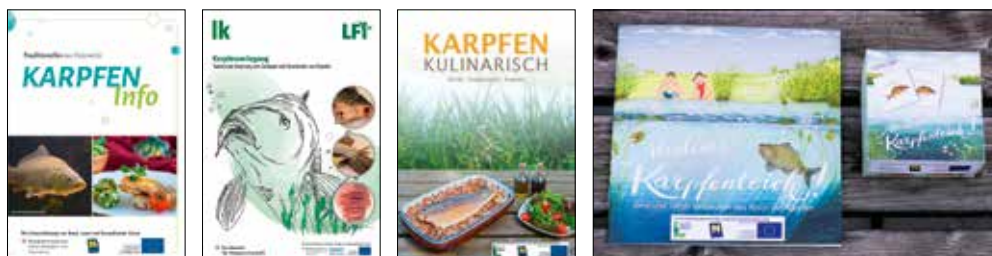
Wissensvermittlung im Bereich der Karpfenteichwirtschaft für Groß (Kochbuch und Broschüren) und Klein (Memo-Spiel und Kinderbuch).