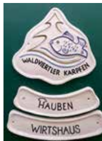
Keramiktafel Waldviertler Karpfen