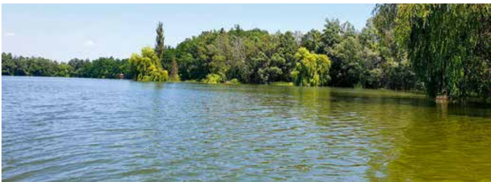
Die großen Teiche des Waldviertels sind beliebte Ausflugsziele und attraktiv für den Tourismus. Die Teiche werden bis heute bewirtschaftet, wobei ihre Geschichte teilweise bis mindestens ins 16. Jahrhundert zurück geht.