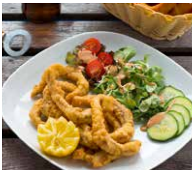
Karpfenlocken in Bierteig.