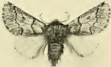
Abb. 1: Thaumetopoea libanotica spec. nov., Holotypus, ♂.

MUS. COMP. ZOO. LIBRARY MAR 11 1977 HARVARD UNIVERSITY Beschreibung: Holotypus, ♂: Fühler blaß bräunlich-gelb, basaler Schopf weißlich; Kopf ockerbraun; Taster brauner und dunkler; Kragen und Kehlgendenschwarzlichgrau; Thorax grau; Unterseite blasser mit gleichfarbiger Behaarung der Beine; Tarsen gelblich; Hinterleib grau, etwas bräunlich, weißlich geringelt; Seiten- und Analschopf grau. Vorderflügel grau mit schwarzbraunen Zeichnungen: Linien an beiden Seiten weißlich gerandet; basale Linie nach außen eine Ecke bildend; innere Linie von \frac{1}{3} des Vorderrandes nach \frac{1}{3} des Hinterrandes laufend, schräg auswärts bis zur Media, dann nach außen geeckt, und schräg einwärts nach dem Hinterrand; äußere Linie von \frac{1}{3} des Vorderrandes nach \frac{6}{6} des Hinterrandes laufend, gezähnt, mit dem Außenrand mehr oder weniger parallel, aber vom Vorderrand bis zur Ader 4 schwach, darunter etwas deutlicher, einwärts gebogen; Zellenende mit einem graubraunen Dreieck; ein subapikales schwarzes Fleckchen, darunter ein undeutlicher Schatten bis zum Zwischenraum III; Fransen weißlich, kräftig graubraun gescheckt. Unterseite blasser, mit weniger deutlichen Zeichnungen. Hinterflügel mattweiß mit gelblichbräunlicher Analgend und schwachem bräunlichen Fleck an der Analecke; Fransen schwach gescheckt. Vorderflügelänge 13 mm.