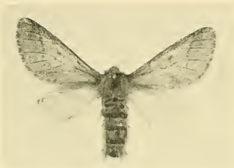
Abb. 3: Thaumetopoea libanotica spec. nov., Allotypus, ♀.

Deutliche Genitalunterschiede und eine stark disjunkte geographische Verbreitung lassen keinen Zweifel über den taxonomischen Status dieser neuen Thaumetopoea , welche bestimmt eine bona Spezies und nicht etwa eine Subspezies von Th. bonjeani ist.