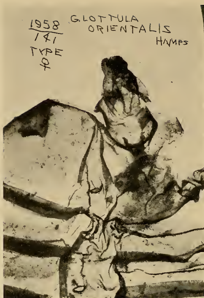
Abb. 2: Genitalien des Abb. 1 oben abgebildeten Falters.

Die Art wurde ursprünglich von Felder und Rogenhofer (1874) nach einem ♂ unbekannter Herkunft aufgestellt und fraglich in die Gattung Euphasia Steph. eingereiht. Es wurde nur eine Abbildung der Art, aber keine Beschreibung derselben gegeben.