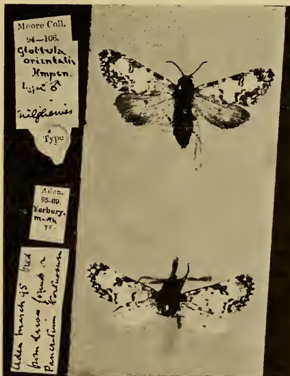
Abb. 1 oben: Polytela cliens Fldr. ♀. „Nilgiris“. (British Museum) Typus von Glottula orientalis Hmps. ♂. unten: Polytela cliens Fldr. ♂. Aden. (British Museum).