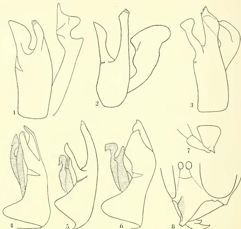
Fig. 1-8: Ammophila ♂. 1: anatolica n. sp., armature génitale de profil; 2: armata Illig., id. 3: clypeata Mocs., id. 4: anatolica n. sp., armature génitale, moitié gauche, face inférieure. 5: armata Illig., id. 6: clypeata Mocs., id. 7: anatolica n. sp., base de la patte antérieure. 8: anatolica n. sp., clypeus.

sente un clypeus pointu, souvent armé d'une pointe ou d'une carène sur le bas de son disque; son armature génitale est d'un type très particulier (fig. 1 à 6); les paramères sont profondément bifides, les volselles très allongées, les valves du pénis extrêmement développées.