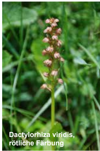
Dactylorhiza viridis , rötliche Färbung