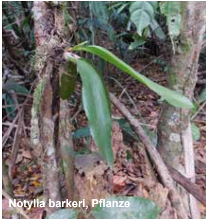
Notylia barkeri, Pflanze