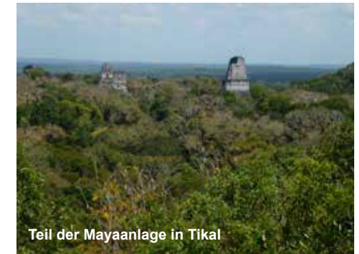
Teil der Mayaanlage in Tikal