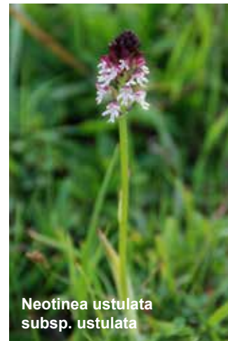
Neottia ustulata subsp. ustulata