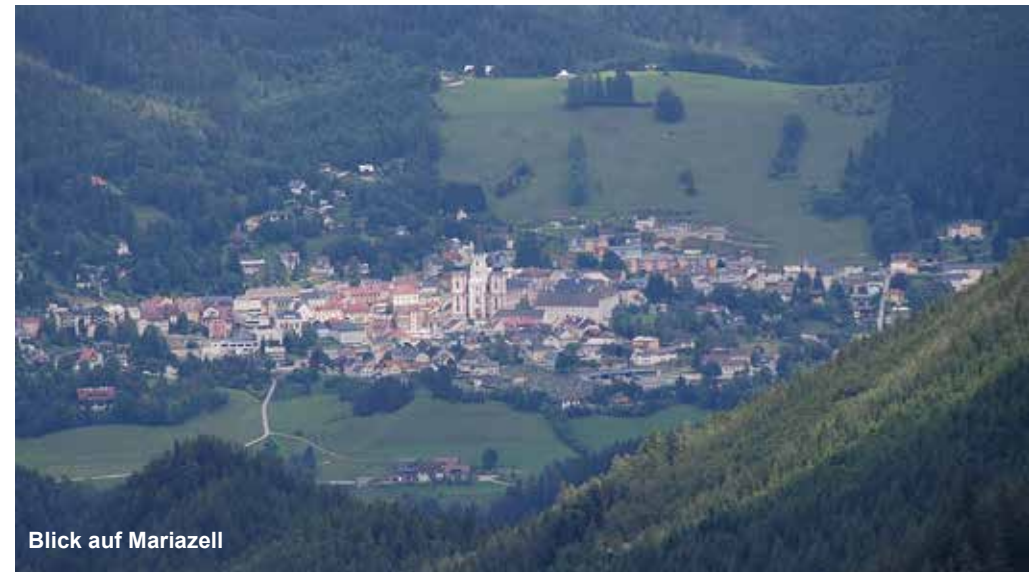
Blick auf Mariazell

Wie schon im Artikel zur Orchideenwanderung bei Lilienfeld erwähnt (OK 3/2016), sind wir im Frühling und Frühsommer immer wieder auf der Suche nach heimischen Orchideen. Eine im Jahr 2015 durchgeführte Bergwandertour zu den Zellerhüten entpuppte sich damals als artenreiche Orchideenwanderung. Aufgrund dieser Erkenntnisse, von Hinweisen in einer Tourenbeschreibung auf Frauenschuh und einem Eintrag im Gipfelbuch im Jahr 2015, ebenfalls mit Hinweis auf Frauenschuh, wurde die Tour mit geänderter Wegführung im Jahr 2016 wiederholt. Mariazell befindet sich rund 160 km von Wien entfernt bzw. ca. 110 km von Graz entfernt und ist mit dem PKW sowohl über St. Pölten als auch