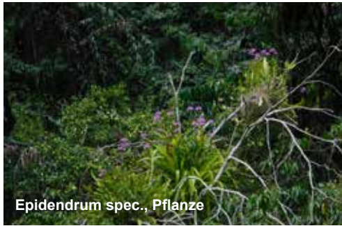
Epidendrum spec., Pflanze