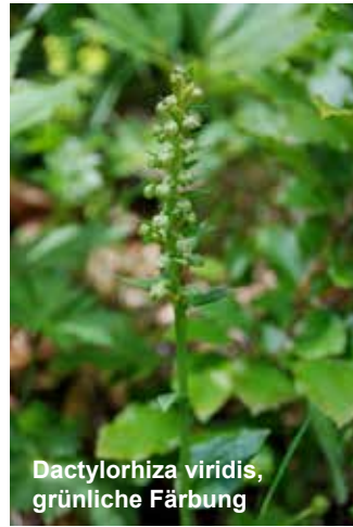
Dactylorhiza viridis , grünliche Färbung