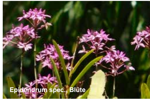
Epidendrum spec., Blüte