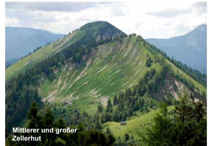
Mittlerer und großer Zellerhut

sichtskarten der Basilika im Hintergrund oft sichtbar ist. Die imposante Bergkette, zugehörig zu den Ybbstaler Alpen, setzt sich zusammen aus dem Oischingkogel (1606 m) mit dem möglicherweise kleinsten Metall-Gipfelkreuz von Österreich (ca. 20 cm hoch), dem Vorderen Zellerhut (1629 m), dem Mittleren Zellerhut (1586 m) und dem Hauptgipfel, dem Großen Zellerhut (1639 m). Alle Wege auf die Zellerhüte sind nur für geübte Wanderer mit entsprechender Ausdauer geeignet. Der kürzeste Aufstieg über den Seewirtgraben weist 800 Höhenmeter im Aufstieg auf, Gehzeit für gute Geher ohne Pausen 3 Stunden. Mit vielen Fotopausen entsprechend länger. Dazu kommt dann auch noch der Abstieg am selben Weg. Alle anderen Varianten sind noch länger, und auch noch mehr Höhenmeter sind zu bewältigen. Im ganzen Gebiet gibt es keine Schutzhütte. Am Ende des Artikels gibt es aber auch 2 kurze Varianten für nicht so gehfreudige Orchideenfreunde, auf denen zur richtigen Jahreszeit ein Großteil der hier vorgestellten Orchideen beobachtet werden kann. Im Jahr 2015 wurde am 18. Juni die Tour erstmals begangen. Ausgangspunkt war damals der Köckensattel (Zufahrt mit PKW möglich), über Farnbodenhütte, am oberen Rand des Ochsenbodens entlang, dann über Oischingkogel, Vorderen Zellerhut, Mittleren Zellerhut auf den Großen