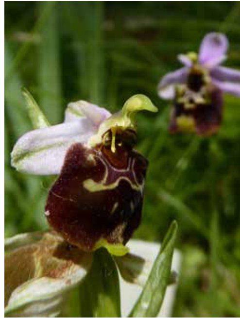
Ophrys holoserica in den verschiedensten Farb- und Formvarianten