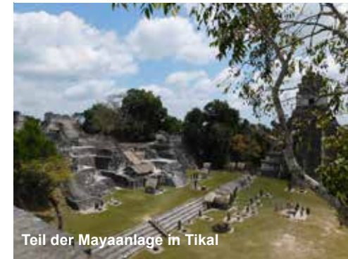
Teil der Mayaanlage in Tikal

waren in der Anlage oftmals allein in der mystischen Umgebung. Zuerst hörten wir auch hier die Brüllaffen, später sahen wir die Affen dann noch friedlich in den Bäumen sitzen. Sie glotzten uns genauso an wie wir sie. Offenbar dachten wir beide wohl dasselbe. Ein Catasetum integerrimum mit auffallenden Nestwurzeln hing in den Bäumen, nebenbei sind wir immer wieder über abgebrochene Pflanzen, Orchideen und Tillandsien, gestolpert. Wenn eine Pflanze uns wertvoll erschien, haben wir sie irgendwo in eine Astgabel gesteckt und sie ihrem weiteren Schicksal überlassen. Mit ein paar hundert Fotos mehr in der Kamera haben wir auch die Rückfahrt im Taxi zum Hotel in Flores überlebt. Nach einem Abendessen in einer lokalen Gaststube haben wir uns wieder zum Busbahnhof begeben. Schließlich hat dieser Tag im wieder viel zu kalt klimatisierten Nachtbus zurück nach Guatemala Stadt sein Ende gefunden.