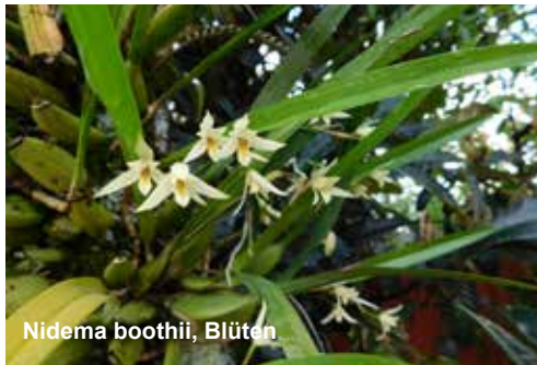
Nidema boothii, Blüten