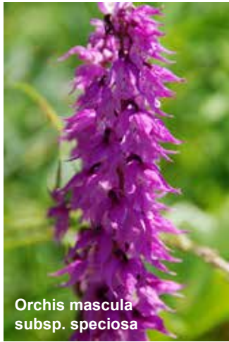
Orchis mascula subsp. speciosa