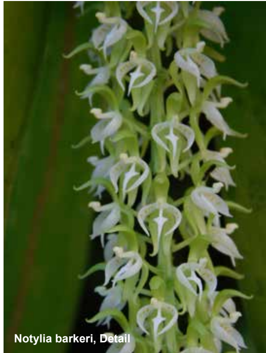
Notylia barkeri, Detail