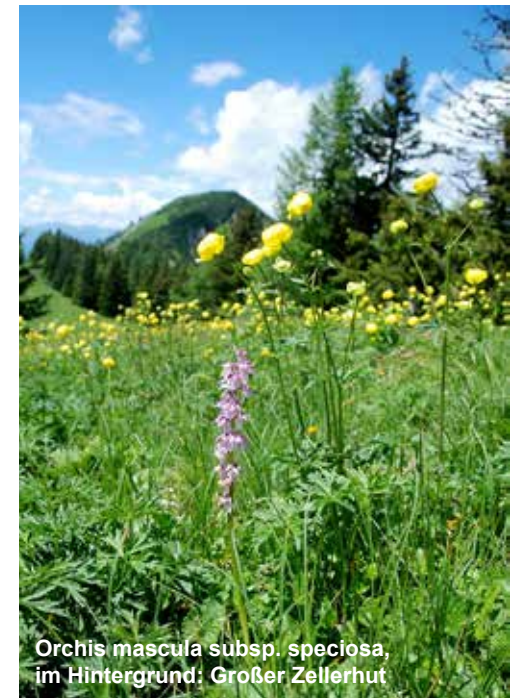
Orchis mascula subsp. speciosa , im Hintergrund: Großer Zellerhut

Die Ochsenbodenalm bietet wieder einiges Interessantes an Orchideen. Im oberen Bereich, entlang des Wanderweges, sind wieder viele Weiß-Waldhyazinthen ( Platanthera bifolia ) und Schwertblättrige Waldvögelein ( Cephalanthera longifolia ) zu bestaunen. Auch Groß-Zweiblatt ( Neottia ovata ) und Grün-Hohlzunge ( Dactylorhiza viridis ) sind hier wieder vorhanden. Sehr interessant ist das Vorkommen vom Brand-Knabenkraut ( Neotinea ustulata ), welches sowohl im Jahr 2015 als auch beim Besuch im Jahr 2016 erst zu blühen begonnen hat. Am 22. Juni 2016 ist der Blühvorgang sichtbar weiter fortgeschritten als im Jahr davor, obwohl das Jahr 2015 von einer massiven Hitzeperiode geprägt war. Die in der Literatur angeführten Unterschiede bei den 2 Subspezies des Brand-Knabenkrautes sind bei diesen Pflanzen nicht zu beobachten, wir nehmen daher an, dass es sich hierbei um die Art Neotinea ustulata subsp. ustulata handelt. Dies wurde auch vom Orchideenexperten Norbert Griegl nach einer dankenswerten Begutachtung von Fotos aus dem Jahr 2015 bestätigt. Eine Beobachtung der Population zu einem späteren Zeitpunkt mit Vollblüte wäre für eine eindeutige Bestimmung hilfreich. Im Jahr 2015 konnte im oberen Bereich der Alm