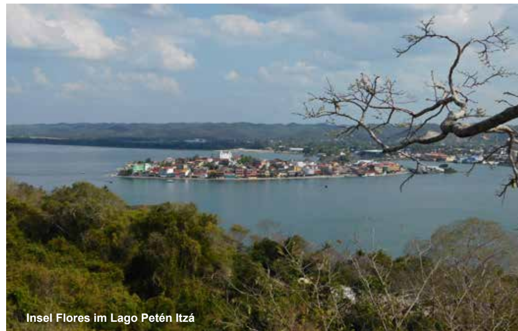
Insel Flores im Lago Petén Itzá

„Wenn du nach Petén fährst, brauchst du lange T-Shirts und reichlich Insektenspray, sonst fressen dich die Gelsen auf.“ Diesen Satz habe ich vor meiner Reise öfter gehört. Und dementsprechend wurde auch mein Koffer gepackt. Gleichzeitig muss man aber auch wissen, dass der Winter 2015/2016 ein El-Niño-Winter war. Vom vergangenen Sommer aufgewärmt, sammelte sich über dem Äquator des Pazifischen Ozeans ungewöhnlich viel warmes Wasser und sorgte in den Wintermonaten für unvorhersehbare Wetterphänomene. Kurz vor meiner Abreise im März 2016 zog ein