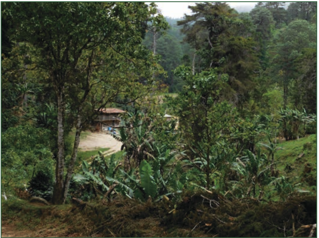
Die Finca in den Bergen

Wir hatten die letzten Tage in den Bergwäldern der Sierra de la Minas verbracht, doch die Reise geht weiter. Das nächste Ziel ist die Kleinstadt Zacapa im Süden des Landes. Dahinter beginnt die Sierra del Merendon, die sich weit nach Honduras