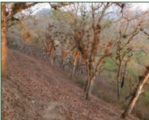
Saisonal trockene Eichenwälder