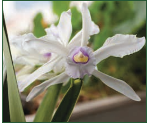
Cattleya purpurata var. werkhauseri x anelata

Kork sowie auch Lavasteinchen hinein. Auch etwas Kalk kommt dazu (bisher zerkleinerte, gereinigte Muscheln; neuerdings auch Pulver mit Kalzium und Magnesiumcarbonat). Ich bevorzuge Tontöpfe, einerseits wegen des besseren Standes, andererseits kann man aufgrund des Gewichts auch besser abschätzen, ob gegossen werden soll. Ab einer Topfgröße von 23 cm gibt es aber immer wieder Probleme mit Staunässe: Aus diesen Töpfen verschwindet das Wasser nur sehr langsam – besonders im Winter, wo das Fenster zu ist und das Abtrocknen langsamer verläuft. Hier hat gelegentlich schon die Vernebelung dazu geführt, dass diese Pflanzen nicht richtig abtrocknen.