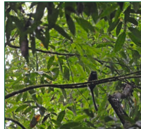
Äffchen in Puyo