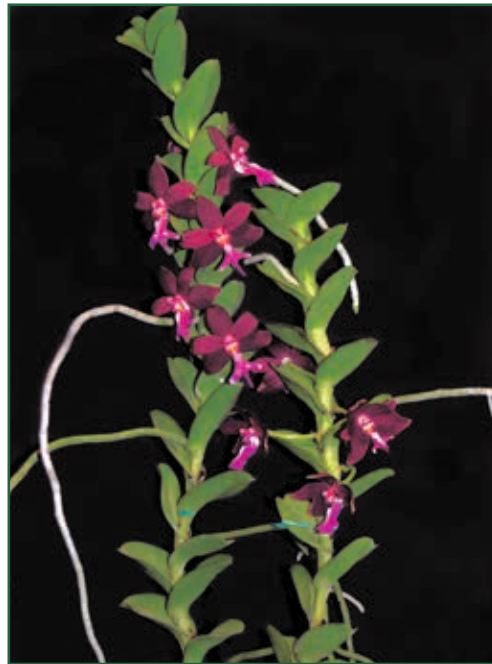
Ein anderer Klon von Trichoglottis philippinense var. brachiata (syn. atropurpurea )