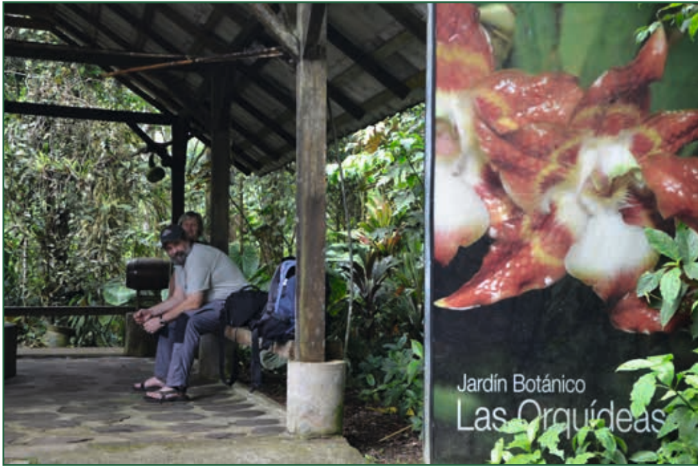
Eingangsbereich vom Botanischen Garten

Jardín de Orquídeas. Wahrscheinlich kennt jeder Taxifahrer dieses Ziel, und so haben wir keine Mühe, schnell ein Taxi zu bekommen, das uns für einen Dollar an unser Ziel bringt. Puyo ist eine mittelgroße unscheinbare Stadt ohne charakteristische Merkmale. Wir fahren zuerst in Richtung Macas nach Süden, dann am Stadtrand entlang durch die typischen Siedlungsbereiche aus kleinen Hütten und Bretterbuden, mit unbefestigten, schmutzigen Straßen und Herden von streunenden Hunden. An einer schmalen Straße setzt uns der Taxifahrer ab, kassiert seinen Dollar und weist uns den Weg, geradeaus etwa 800 Meter. Wir wandern also durch die Siedlung, begleitet von kläffenden Hunden und den neugierigen Blicken der Anwohner. Rechter Hand erstreckt sich ein unscheinbares Gelände, das von einem schiefen Drahtzaun eingefasst wird und die Blicke durch dichtes Gestrüpp abweist. Nach kurzer Zeit erreichen wir ein windschiefes, eisernes Eingangstor neben dem, zwischen einigen blühenden Exemplaren von Sobralia rosea , ein blaues Schild mit