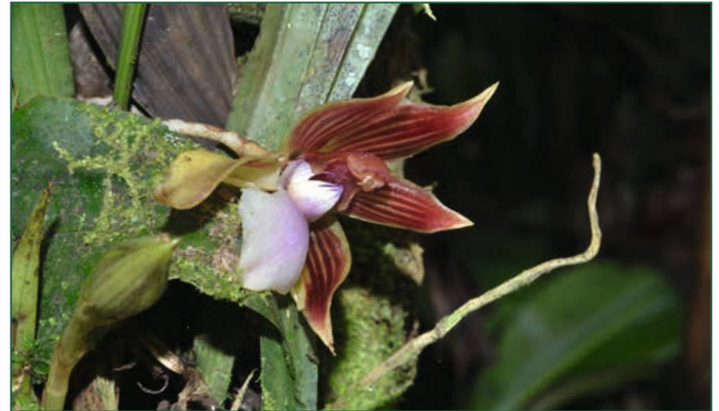
Chaubardia heteroclita (Poepp. & Endl.) Dodson & D.E. Benn

Äffchen aufmerksam, die uns aus einiger Distanz beobachten. Ein leises Zwitschern hat ihm ihre Anwesenheit verraten. Natürlich kennt er die Gruppe, sonst hätten wir sie wohl nicht entdeckt. Es sind Braunrückentamarine, die sowohl in Primär- als auch Sekundärwäldern des östlichen Andentieflandes anzutreffen sind. Ihre Verbreitung reicht von Ecuador über Peru bis Bolivien. Zahllose Schmetterlinge begleiten uns auf unserer Wanderung durch das Areal. In prächtigen Farben und in allen Größen tauchen sie immer wieder zwischen den Bäumen auf. Auf und ab geht es auf verschlungenen Wegen durch den Regenwald, so dass der Eindruck entsteht, man sei auf endlosen Wegen unterwegs.