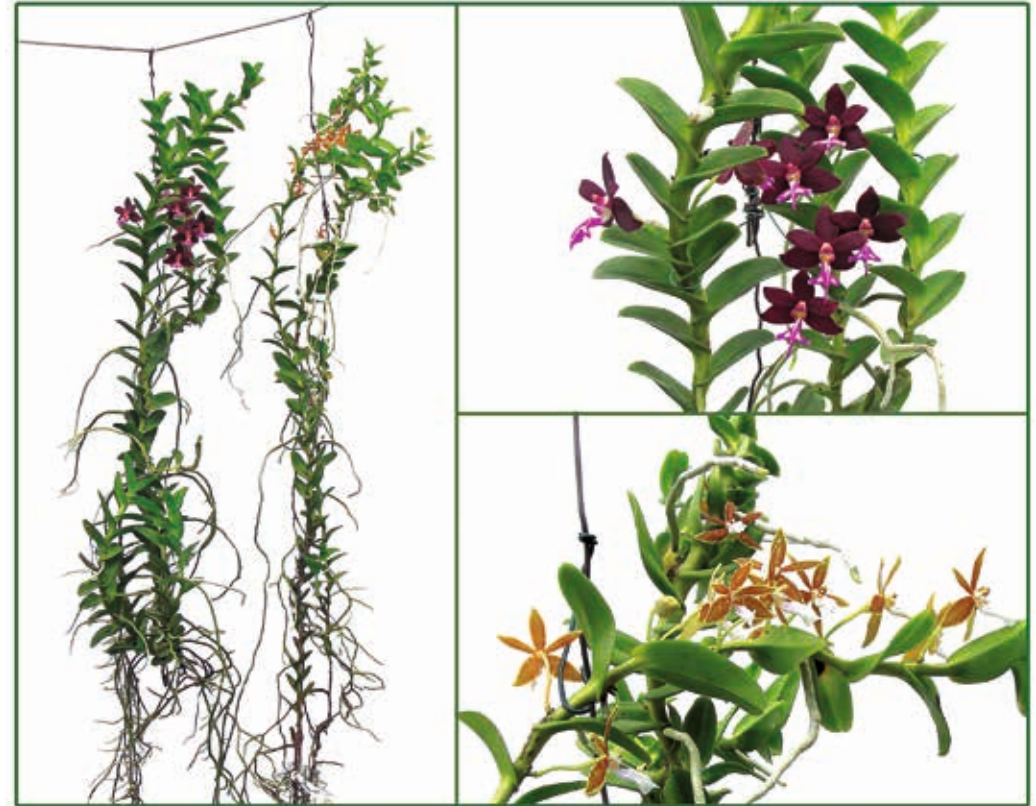
Habitus und Blüte von Trichoglottis atropurpureum (links und oben) und Trichoglottis philippinense (rechts und unten)

zen sehr wüchsig. Fast alle Arten besiedeln in der Natur Höhenlagen zwischen 0 und 300 m. Eine temperiert-warme Kultur ist eine Grundbedingung für gutes Wachstum. Bei mir werden die Pflanzen hängend ohne Substrat zwischen den Vandeem gepflegt (Aerosolkultur). Wintertemperaturen unter 15 Grad sind zu vermeiden, im Wachstum werden 30 Grad gut vertragen. Wasser in den Triebspitzen führt meist zum Ausfaulen derselben, die Pflanzen sollten trocken in die Nacht gehen. Bei sonniger Witterung wird reichlich gespritzt und gegossen, bei trübem Wetter und niedrigen Temperaturen werden sie trocken gehalten. Gedüngt werden sie in der Wachstumsphase bei jedem zweiten Sprühen mit 300–800 Mikrosiemens, bei den stärkeren Gaben wird einige Stunden später mit klarem Wasser nachgegossen, um Salzablagerungen zu vermeiden. Für eine sichere Blüte verlangen sie sehr viel Licht (Südseite mit wenig Schattierung).