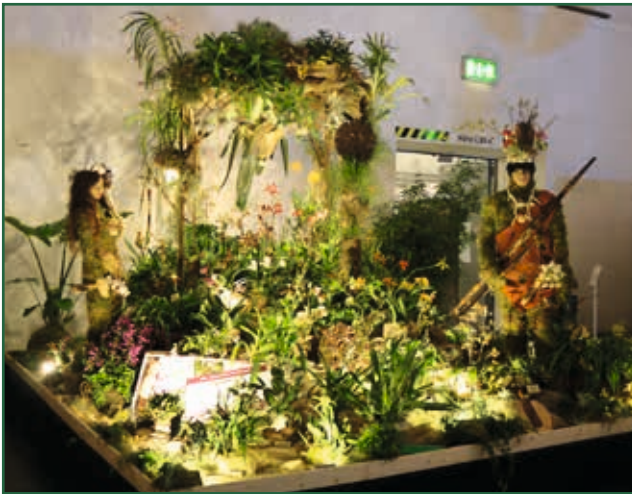
Der beste Schaustand des Erwerbs, ausgezeichnet mit einer Goldmedaille, war der von Blumen Janke

Das Frühjahr ist die Zeit der Orchideenausstellungen. Über Hirschstetten haben wir hier im OK einen schönen Artikel mit vielen Fotos. Bald darauf haben wir uns auf den Weg nach Dresden gemacht. Die D.O.G. veranstaltet jährlich im Rahmen der Messe „Dresdner Ostern“ die wohl größte Orchideenschau Europas. Auch heuer war sie wieder qualitativ großartig, und auch die Anzahl der Händler war enorm, obwohl zeitgleich der Europäische Orchideenkongress in Paris stattfand. Wir hoffen, von dieser Ausstellung in Frankreich im nächsten OK einen Artikel bringen zu können. Von der Wiener Orchideengesellschaft waren etwa 17 Leute angereist, um einen EOC live zu erleben. In Dresden war der Besucherandrang enorm. Zur „Langen Nacht der Orchidee“ am Donnerstagabend von 20 bis 23 Uhr kamen über 1700 Besucher, und am Samstag war der Besucherandrang so groß, dass wir fluchtartig die Messehalle verließen und uns der Kunst und Kultur in Dresden widmeten.