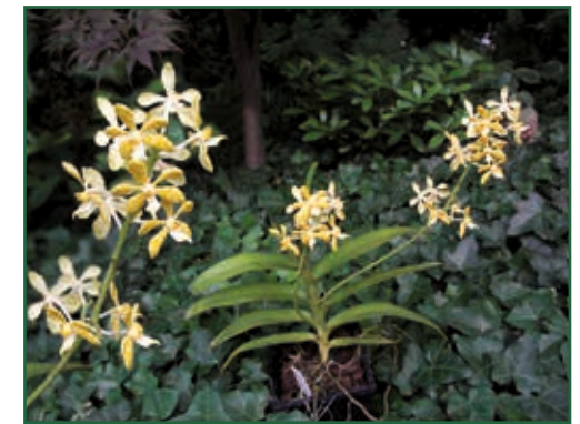
Ehemals Trichoglottis luchuensis forma alba , heute Staurochilus luchuensis alba

zen sehr wüchsig. Fast alle Arten besiedeln in der Natur Höhenlagen zwischen 0 und 300 m. Eine temperiert-warme Kultur ist eine Grundbedingung für gutes Wachstum. Bei mir werden die Pflanzen hängend ohne Substrat zwischen den Vandeem gepflegt (Aerosolkultur). Wintertemperaturen unter 15 Grad sind zu vermeiden, im Wachstum werden 30 Grad gut vertragen. Wasser in den Triebspitzen führt meist zum Ausfaulen derselben, die Pflanzen sollten trocken in die Nacht gehen. Bei sonniger Witterung wird reichlich gespritzt und gegossen, bei trübem Wetter und niedrigen Temperaturen werden sie trocken gehalten. Gedüngt werden sie in der Wachstumsphase bei jedem zweiten Sprühen mit 300–800 Mikrosiemens, bei den stärkeren Gaben wird einige Stunden später mit klarem Wasser nachgegossen, um Salzablagerungen zu vermeiden. Für eine sichere Blüte verlangen sie sehr viel Licht (Südseite mit wenig Schattierung).