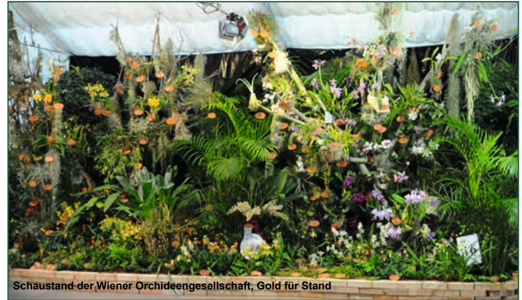
Schaustand der Wiener Orchideengesellschaft, Gold für Stand

Die Ausstellung 2018 ist nun zu Ende, und ich versuche das Erlebte zusammenzufassen. Den Schwerpunkt dazu lege ich auf den Beginn des Aufbaus der Ausstellung vom 5. 2. 2018 bis zum Rückbau am 27. 2. 2018.