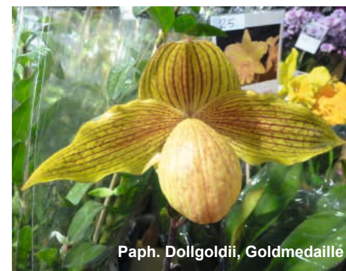
Paph. Dollgoldii, Goldmedaille