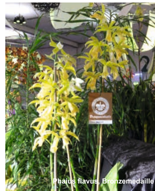
Phaius flavus, Bronzemedaille