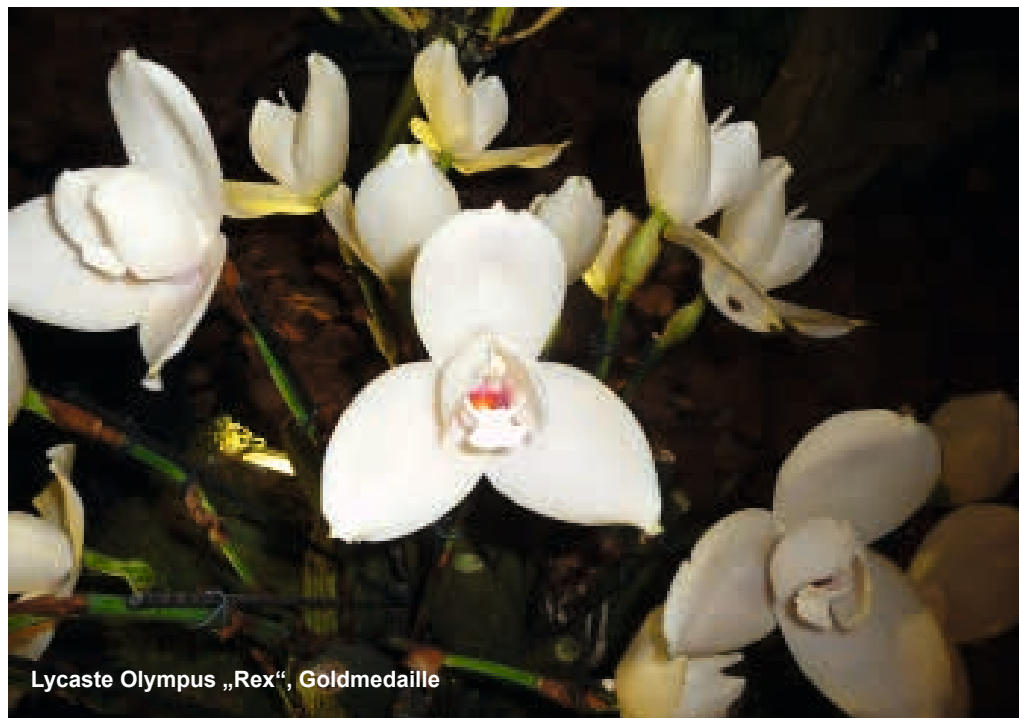
Lycaste Olympus „Rex“, Goldmedaille

Dresden ist immer eine Reise wert, obwohl es von mir zuhause bis nach Dresden mehr als 800 km sind. Seit dem EOC im September 2009 besuche ich daher fast jährlich Dresden nicht nur der Orchideen wegen. In der Innenstadt sind die ärgsten Schäden des Zweiten Weltkriegs weitgehend beseitigt, sodass Dresden fast wieder in alter Pracht und Herrlichkeit erstrahlt. Nicht umsonst trägt Dresden den Beinamen Elbflorenz. Es lohnt also wirklich, sich in der historischen Altstadt sowie auch in der näheren Umgebung umzusehen.