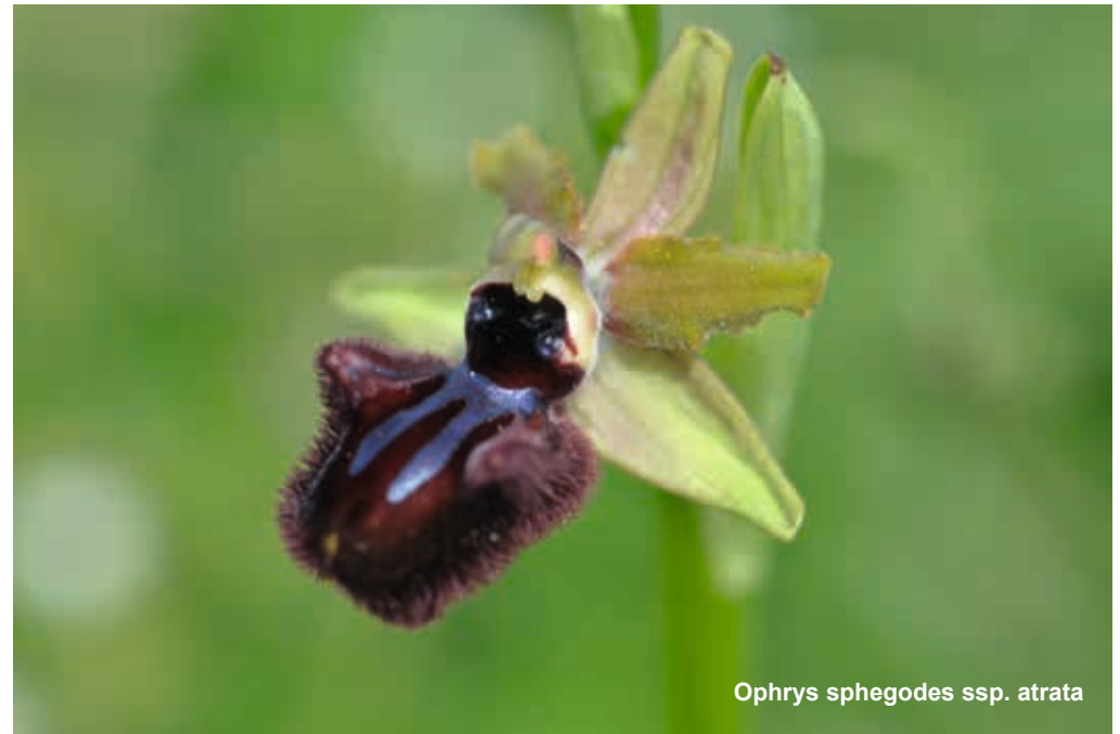
Ophrys sphegodes ssp. atrata

Istrien, eine Halbinsel am nördlichsten Punkt der Adria, die zu zwei Dritteln zu Kroatien und einem Drittel zu Slowenien gehört, ist durch seinen besonderen Orchideenreichtum bei vielen Freunden heimischer und mediterraner Arten bekannt. Während das Innere der Halbinsel durch vorwiegend subalpines Klima geprägt wird, ist die Küstenregion unter dem Einfluss der Adria durch mediterranes Klima gekennzeichnet. Hier findet man, hauptsächlich am südlichsten Zipfel in der