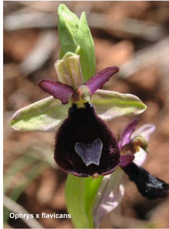
Ophrys x flavicans