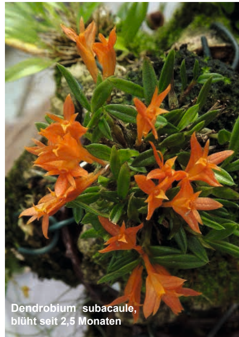
Dendrobium subacaule, blüht seit 2,5 Monaten

Hallo, ich bin die „Lange mit den Kleinen“. Das heißt, bei einer lichten Höhe von 183 cm liebe ich ganz besonders die Miniaturformen unter den Orchideen. Am Anfang meiner Orchideenlaufbahn habe ich sämtliche Orchideenbücher unserer öffentlichen Bibliothek ausgeliehen. Die besten, d. h. die für mich interessantesten, Bücher kaufte ich. So kam ich zu dem Buch „Miniaturorchideen“ von Jörn Pinske. Seitdem bin ich unheilbar infiziert.