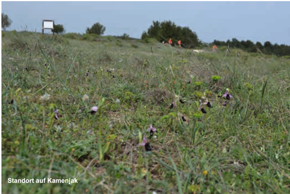
Standort auf Kamenjak

ten und haben dabei eine Reihe interessanter Funde gemacht. So gibt es auf der Halbinsel Kamenjak und an der Küste bei der kleinen Stadt Bale eine Ophrys-Hybride, deren Hauptverbreitungsgebiet südwestlicher, von Italien bis hin nach Südfrankreich und Spanien, liegt. Es handelt sich dabei um Ophrys x flavicans VIS., die einen natürlichen Bastard aus Ophrys bertolonii MORETTI und Ophrys sphegodes MILL. subsp. atrata (LINDL.) MAYER (Synonym: Ophrys incubacea BIANCA) darstellt. Dieser Hybrid wurde bereits 1842 in der Flora von Dalmatien beschrieben. Ophrys-Hybriden sind immer dann möglich, wenn sich verschiedene Arten einen Bestäuber teilen.