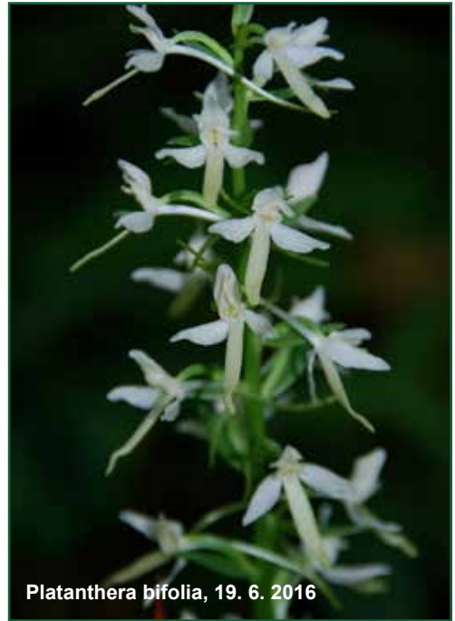
Platyanthera bifolia, 19. 6. 2016

Alle in diesem Artikel beschriebene Orchideenfunde sind im Kartierungsquadrant 7959/4 angesiedelt.