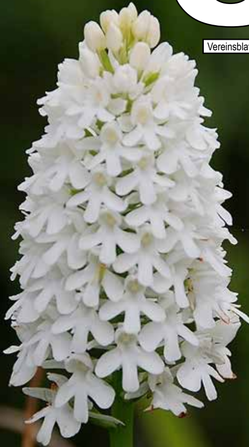
Anacamptis pyramidalis f. albiflora