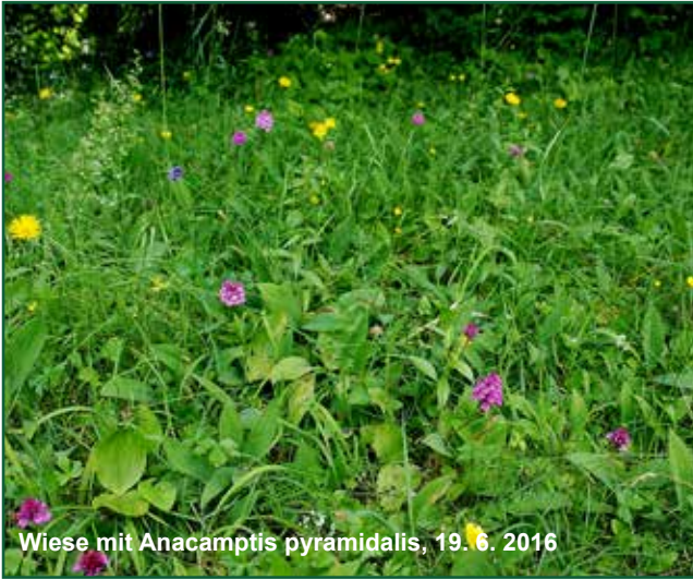
Wiese mit Anacamptis pyramidalis , 19. 6. 2016