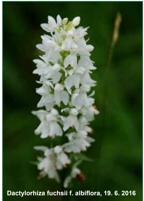
Dactylorhiza fuchsii f. albiflora , 19. 6. 2016