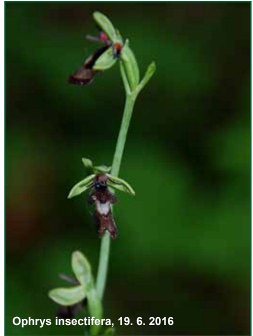
Ophrys insectifera , 19. 6. 2016

vom Wald zurückerobert. Die wenigen in diesem Bereich vorhandenen Hummel-Ragwurz sind somit offenbar die letzten Relikte der ehemaligen Wiesenbewohner. Direkt in der Steigböschung sind auch einige Exemplare der Fliegen-Ragwurz ( Ophrys insectifera ) zu finden, die bei unserem Besuch ebenfalls schon komplett verblüht waren. Nach einiger Zeit erreicht man eine Forststraße, die zum Gehöft Leopoldseder führt. In diesem Bereich befindet sich im Wald ein in den Karten nicht eingezeichneter Traktorfahrtweg. Auch hier gibt es – derzeit noch – ein kleines Vorkommen von Fliegen-Ragwurz ( Ophrys insectifera ). Auch diese Pflanzen waren schon im Verblühen, es konnten aber noch die letzten Blüten fotografisch festgehalten werden. Dieser Standort ist in den letzten Jahren durch die Anlage des Traktorweges neu entstanden, wird aber in nächster Zeit durch den inzwischen wieder starken Bewuchs massiv unter Druck geraten und vermutlich leider wieder verschwinden. Wir wanderten jedoch auf der Forststraße Richtung Parapluie weiter. Schon kurz vor der Aussichtswarte gibt es einen