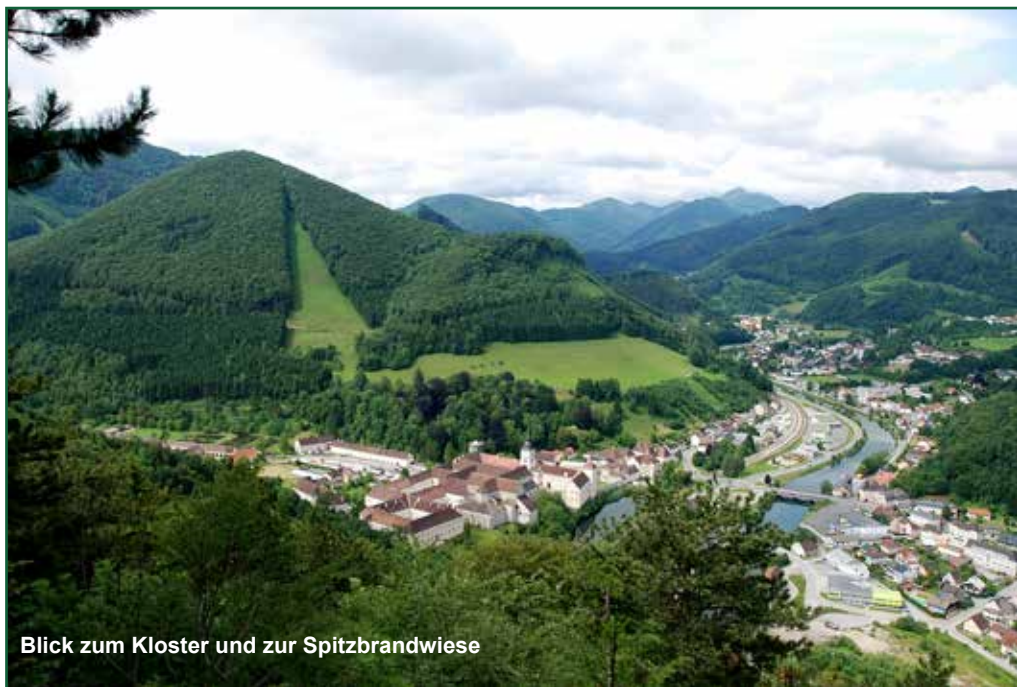
Blick zum Kloster und zur Spitzbrandwiese

Im Orchideenkurier, Ausgabe 3/2016, ist von uns eine Zusammenstellung von Orchideenfunden aus Lilienfeld beschrieben worden. Am Schluss dieses Artikels wird schon darauf hingewiesen, dass dieser Bericht definitiv keine komplette Darstellung der Orchideenflora von Lilienfeld ist, sondern eine Zusammenstellung von 2 Einzelbesuchstagen aus einem sehr kleinen Gebiet mit einem sehr großen Zeitintervall dazwischen. Durch das Kennenlernen der Lilienfelder Orchideenexperten Rosi und Josef Lampl, nach deren Hinweis wir auch