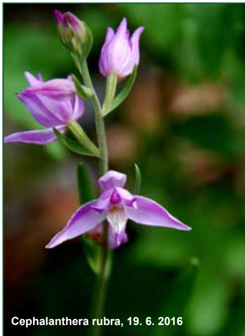
Cephalanthera rubra, 19. 6. 2016

unmittelbar daneben eine weitere Orchidee. Es war die Kleinblatt-Ständelwurz ( Epipactis microphylla ). Es waren nur 2 Pflanzen, jeweils knapp 10 cm hoch. Leider waren auch die untersten Blüten noch nicht geöffnet. Fotografisch festgehalten wurde diese unscheinbare Orchidee natürlich trotzdem. Der Weg führt in weiterer Folge dann durch dichten Wald. Neben zahlreichen blühenden Exemplaren von Türkenbundlilien kommt man auch in einem Bereich an einem großen Standort vom Bleich-Knabenkraut ( Orchis pallens ) vorbei. Diese Orchidee war bei unserem Besuch natürlich schon völlig verblüht. Interessant ist auch das häufige Auftreten des Prächtigen Manns-Knabenkrauts ( Orchis mascula subsp. speciosa ) in diesem Bereich, auch diese Orchidee ist bei unserem Besuch schon komplett verblüht gewesen. Nach kurzer Zeit erreichten wir dann die Wiesenflächen oberhalb des Gehöfts Leopoldseder. Im Bereich des Senders gibt es eine Bank zum Rasten und zum Genießen des wunderschönen Ausblicks über die großen Wiesenflächen. Von hier gibt es auch einen schönen Blick Richtung Reisalpe und Hoch-