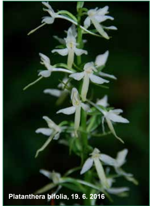
Platyanthera bifolia, 19. 6. 2016

Alle in diesem Artikel beschriebene Orchideenfunde sind im Kartierungsquadrant 7959/4 angesiedelt.