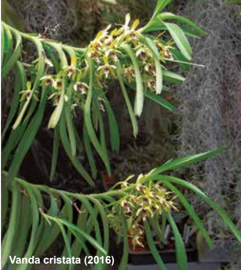
Vanda cristata (2016)