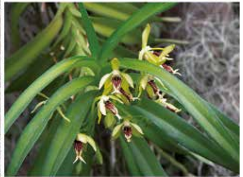
Vanda cristata (2012)

Vor ca. 30 Jahren bot die Firma Hennis eine kleinwüchsige Vanda an. Kleinwüchsige, dachte ich mir, ist gut. Ich hatte schon ein paar Vandeen wie suavis var. tricolor oder Vanda Blaue Donau aus Schönbrunn, die waren alles andere als klein. In der Literatur wird diese Art wie folgt beschrieben: Auf dem 10 bis 30 cm hohen Stamm sind die keilförmig gefalteten Laubblätter 6 bis 12 cm lang. Der wenigblumige Blütenstand hat 1 bis 2 cm breite Blüten usw.