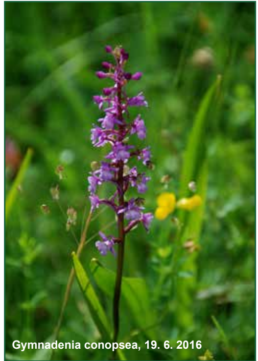
Gymnadenia conopsea , 19. 6. 2016

Nach einiger Zeit erreichten wir den Glatzwiesensattel. Wir wanderten nun den Weg über den ostseitigen Rand der Wiese hinunter (der zweite Weg würde in weiterer Folge über den Spitzbrandkogelgipfel führen). In der Wiese gibt es ein botanisches Highlight, das nicht der Gruppe der Orchideen zuzuordnen ist – ein eindrucksvolles Vorkommen vom Blassen Pyrenäen-Schaftmilchstern ( Loncomelos pyrenaicus subsp. sphaerocarpus ). Zahllose Pflanzen dieser eher seltenen Art sind in der Wiese zu entdecken. Am unteren Rand der Wiese entdeckten wir verblühte Exemplare des Kugel-Knabenkrautes ( Traunsteinera globosa ). In schöner Blüte waren dagegen wieder zahlreiche Exemplare der Pyramiden-Hundswurz ( Anacamptis pyramidalis ). Weiter geht es zur Spitzbrandwiese, die wir schon in der Früh vom gegenüberliegenden Aussichtspunkt Parapluie gesehen hatten. Der Wanderweg quert im oberen Bereich die