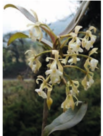
Epidendrum spec. , Pacaya