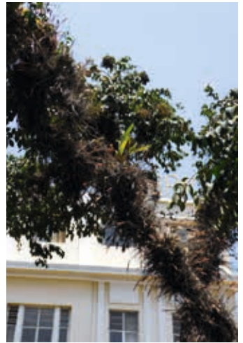
Epiphyten, Onc. leucochilum