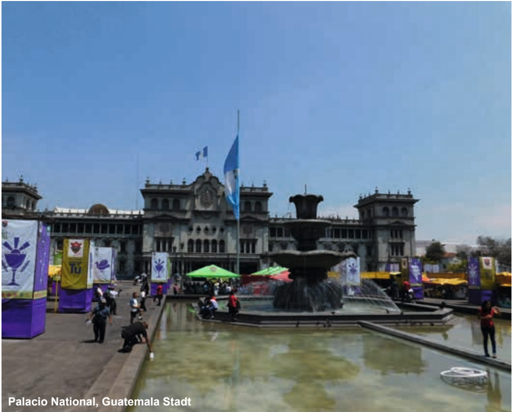
Palacio Nacional, Guatemala Stadt

weißen Blüten her. An einigen Bäumen finden wir Macroclinium bicolor . Die kleinen Fächer sind leicht zu übersehen, aber letztlich doch in größerer Menge vorhanden. Coelia , Pleurothallis und kleine Epidendren finden sich vereinzelt ebenso wie der fast überall vorkommende Isochilus linearis . Am Weg kommt immer mehr die Lava zum Vorschein, der Wald wird lichter, und auch das Vorkommen von Orchideen hört ab einer gewissen Höhe auf. Letztlich hört der Pflanzenbewuchs gänzlich auf, und wir sind in purer Lavalandschaft. Das unbeständige Wetter treibt binnen Sekunden dichte Wolkenfelder vorbei, durchzogen von leichtem Schwefelgeruch. Der finale Aufstieg zum Gipfel ist nicht möglich, erst vor einem Monat ist der Vulkan ausgebrochen, und die Gefahr ist zu groß. Unser Führer ist aufmerksam, ob es leichte Erdbeben gibt, das wäre das Anzeichen zur sofortigen