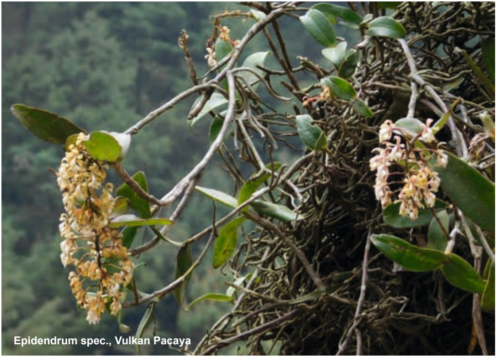
Epidendrum spec., Vulkan Pacaya