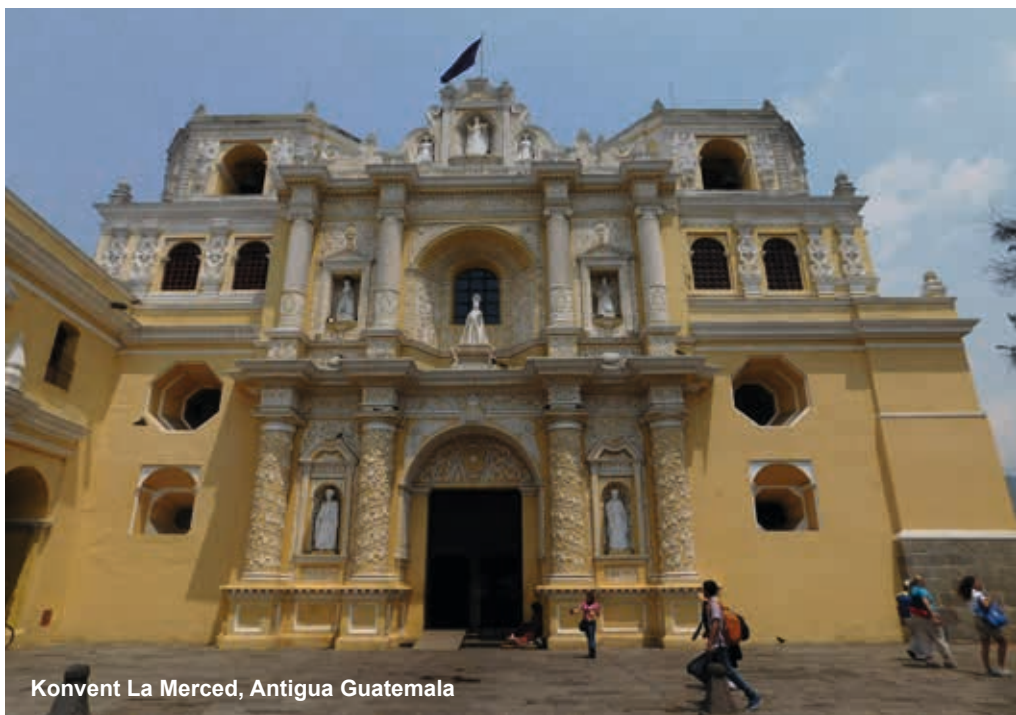
Konvent La Merced, Antigua Guatemala