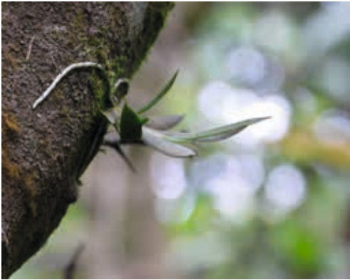
Macroclinium bicolor, Jungpflanze

sive Zerstörungen in der Hauptstadt verursacht. So findet man in der Stadt antike Kirchen mit modernen Kuppeln, die ein untrügliches Beispiel für die damaligen Zerstörungen durch die Beben sind. Weite Teile der Stadt sind daher sehr flach gebaut, der schachbrettartige Grundriss ist typisch für lateinamerikanische Städte. Die Höhenlage von über 1500 m sorgt dafür, dass es nie extrem heiß wird, aufgrund der geographischen Lage wird es auch nie extrem kalt: Guatemala Stadt – die Stadt des ewigen Frühlings. Die großen Boulevards sind mit Alleebäumen gesäumt. Diese sind üppig mit Tillandsien, Guarianthe aurantiaca und Oncidium leucochilum bewachsen. Da es in Guatemala Stadt keine stark ausgeprägten Jahreszeiten gibt, findet man Guarianthe aurantiaca in verschiedenen Stadien: blühende Pflanzen, Pflanzen mit dicken Samenkapseln, aber auch Pflanzen, die in der Ruhe sind oder kräftig austreiben. Beachtung finden sie von der Bevölkerung kaum. Fällt beim Sturm eine runter, kommt wohl der Straßenkehrer und beseitigt den „Müll“. Von der neuen Hauptstadt zählt sich ein Besuch der alten Hauptstadt Antigua aus. Nach dem verheerenden Erdbeben 1773 wurde die Stadt erst langsam wieder aufgebaut. Heute ist sie die wohl schönste Stadt des Landes, bietet ein florierendes Leben im Zentrum, barocke Kolonialarchitektur und gepflegte Parks. Hier kann man auch Orchideenhändler treffen und für sehr wenig Geld großartige Pflanzen