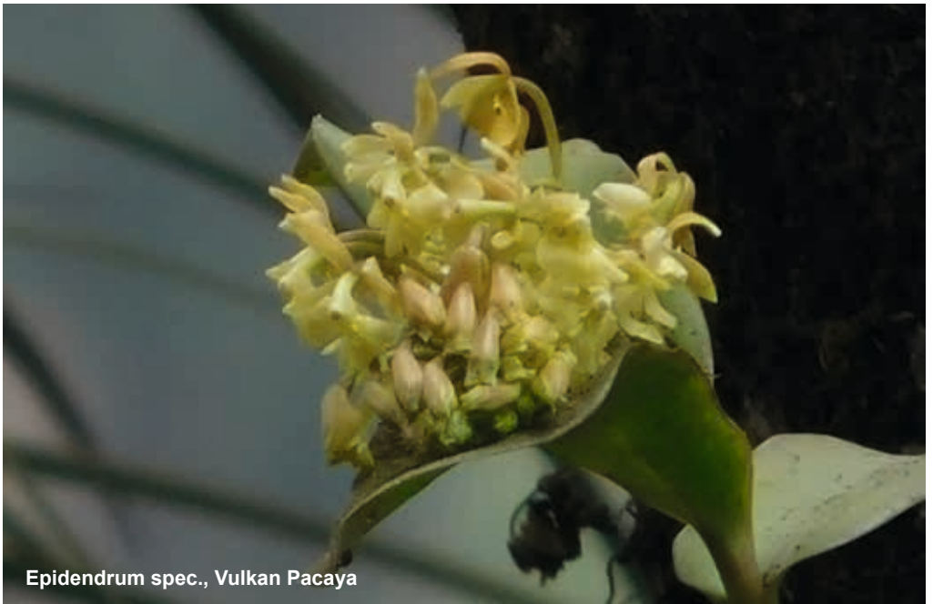
Epidendrum spec., Vulkan Pacaya