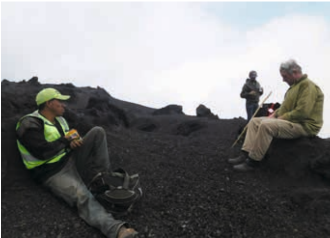
Die Gipfelstürmer am Vulkan Pacaya