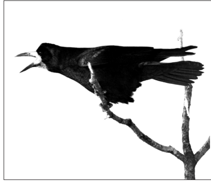
Foto 1. Adulte Saatkrähe - adult Rook .