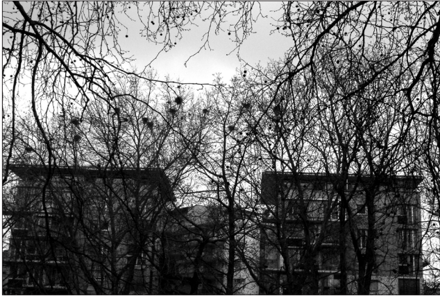
Foto 2. Saatkrähenkolonie in Heilbronn unterhalb der Rosenbergbrücke mit 13 der 20 Nester. - Colony of Rooks in Heilbronn below the Rosenberg bridge with 13 of a total of the 20 nests.

die aber nicht eingetroffen sind. Trotzdem ist die erneute innerstädtische Ansiedlung bei der Rosenbergbrücke nicht unbeachtet geblieben, denn am 22.04.2008 erschien in der Tagespresse „Heilbronner Stimme“ ein Bericht: „Saatkrähen ziehen in die Stadt um“, in dem auf die dortige Kolonie mit kritischen Anmerkungen aufmerksam gemacht und vor „unangenehme Hinterlassenschaften“ gewarnt wird, da sich die Nester direkt über einen Rad- und Gehweg befinden. Besonders auffällig ist aber die erneute Aufgabe der Kolonie auf der Neckarsulmer Insel [1]. Es wird deshalb vermutet, dass Saatkrähen aktiv vertrieben wurden. Es kann allerdings nicht ausgeschlossen werden, dass die Vögel auch von selbst die Brutstätten verlassen haben.