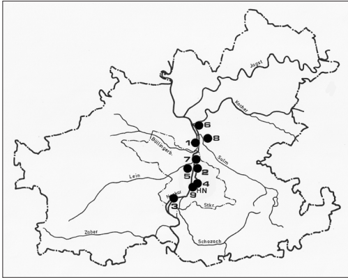
Abbildung 2. Verbreitung aller bisherigen Brutansiedlungen der Saatkrähe mit der laufenden Nummer der Besiedlung in Stadt- und Landkreis Heilbronn. - Size of Rook colonies with the number of nests and the running numbers of their occupation in the city and district of Heilbronn.

besonders in Hybrid-Pappeln) der Bäume kaum unter 20 Meter Höhe (geschätzt) angelegt und nur wenige lagen darunter. Ausnahmen sind Nester, die in Birken und Eschen und zum Teil auch in jüngeren Platanen gebaut wurden, denn diese lagen nur in 8 bis 10 m Höhe. Besonders fiel auf, dass die Nester wenig stabil in den Bäumen verankert sind, was die Verluste schon nach einem Aprilsturm auf der Horkheimer Insel zeigten. Auch sind im Frühjahr von den vorjährigen Nestern nur noch wenige übriggeblieben, so dass die meisten Nester zur Brutzeit wieder neu gebaut werden müssen. Ungewöhnlich sind Einzelnester oder Kleinkolonien unter 5 Nestern, denn sie widersprechen dem bisher bekannten brutbiologischen Verhalten der Saatkrähe als Koloniebrüter.