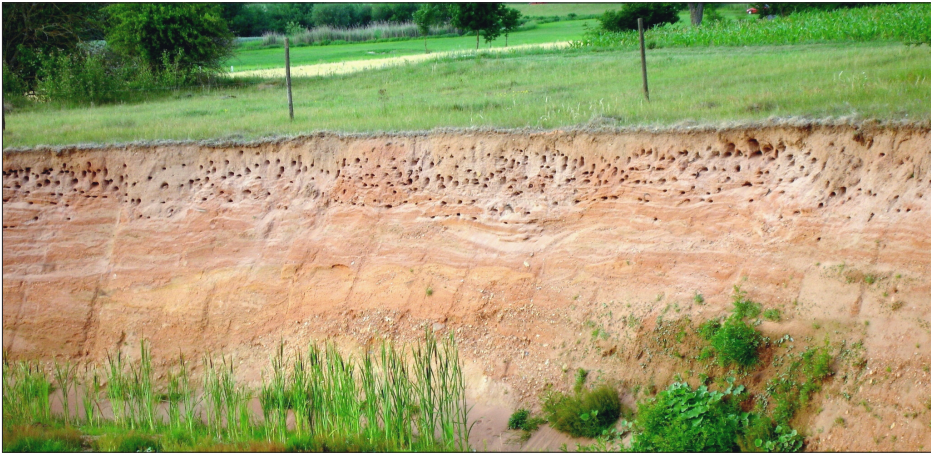
Abbildung 5. Größte Uferschwalbenkolonie von Baden-Württemberg im Jahre 2010 bei Stöttlen-Gaxhardt (Aufnahme: H. Vaas, NABU-Ortsgruppe Ellwangen) – The largest Sand Martin colony in Baden-Württemberg in 2010 near Stöttlen-Gaxhardt.

jekt wurde im Zeitraum 2004 bis 2009 neben der Kolonie bei Gaxhardt nur eine einzige, sehr kleine Kolonie entdeckt (M. Kramer, schriftl. Mitteilung).