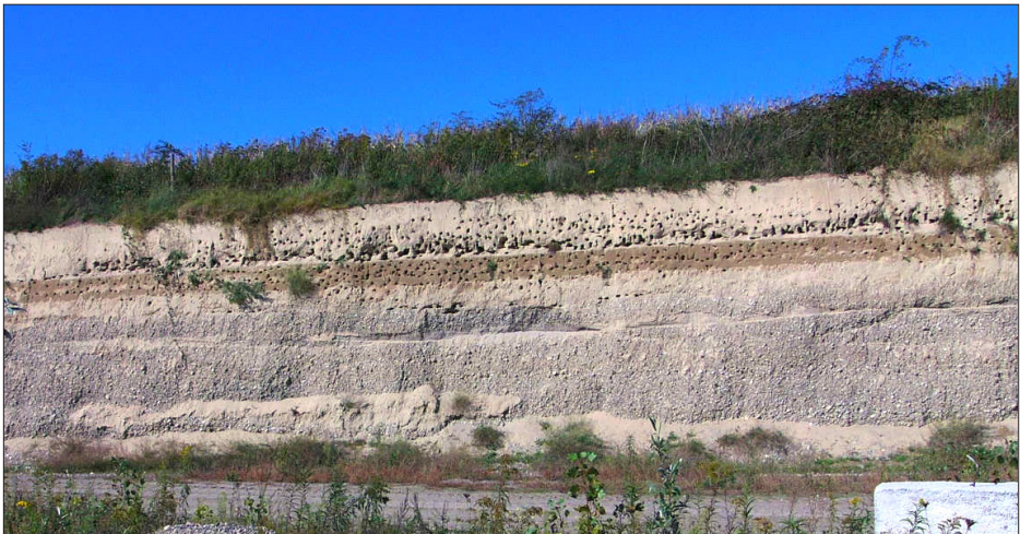
Abbildung 2. Kiesgrube „Hohrain“ bei Wyhl mit landesweit einem der größten Uferschwalben-Vorkommen seit 1995 – Gravel quarry „Hohrain“ near Wyhl with one of the state's largest Sand Martin breeding populations since 1995.

Die meisten Uferschwalben brüteten 2010 sowohl im Regierungsbezirk Freiburg als auch in ganz Baden-Württemberg im Landkreis Emmendingen (vgl. Tab. 1). Es wurden 951 beflogene Röhren an drei Brutplätzen gezählt, wovon sich alleine 582 in der Kiesgrube „Hohrain“ bei Wyhl befanden (J. Rupp, Abb. 2). Ein extrem ungewöhnlicher Brutplatz befand sich in einer künstlichen Hohlgrube auf dem Golfplatz bei Herbolzheim-Tutschfelden EM in der Vorbergzone des Schwarzwaldes (Abb. 3). Diese Hohlgrube wurde bei der Errichtung des Golfplatzes in den Jahren 2003 bis 2005 geschaffen (Rupp 2006). Die Steilwände dieser Hohlgrube sind aus Löß und Lößlehm und wurden 2010 erstmals von einer Uferschwalbenkolonie besiedelt. Insgesamt 225 beflogene Röhren konnten gezählt werden (J. Rupp). Die Vögel ließen sich durch die Mitglieder des Golfclubs kaum stören, obwohl viele Personen diese Hohlgrube täglich passieren.