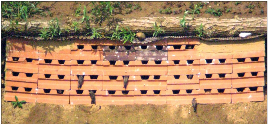
Abbildung 4. Künstlicher Brutplatz der Uferschwalbe im Neckartal bei Rottenburg-Kiebingen – Artificial breeding site for the Sand Martin in the River Neckar valley near Rottenburg-Kiebingen.

nicht, so dass keine Aussage über den tatsächlichen Brutbestand gemacht werden kann. Bei Heidelberg-Grenzhof (HD) wurden am 06.06.2010 73 neue Niströhren (W. Dreyer) und im Rheinauhafen von Mannheim (MA) am 24.06.2010 50 Brutröhren (W. Dreyer, B. Gremlica, C. Schröter) gezählt. Die Gesamtzahl beläuft sich im Regierungsbezirk Karlsruhe auf 581 bis 651 beflogene Uferschwalbenröhren.