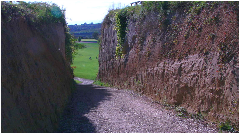
Abbildung 3. Baden-Württembergs ungewöhnlichster Uferschwalbenbrutplatz 2010: Hohl-gasse auf dem Golfplatz bei Herbolzheim-Tutschfelden – A particularly unusual breeding habitat of the Sand Martin in 2010: Golf course Herbolzheim-Tutschfelden.

Der Ortenaukreis (OG) beherbergte 2010 mit 500 befliegenen Röhren die zweitgrößte Anzahl Uferschwalben im Regierungsbezirk Freiburg. Von 26 untersuchten Kiesgruben waren allerdings nur sechs besiedelt. In der Ortenau waren die Kieswerke bei Diersheim und Freistett mit 224 bzw. 98 befliegenen Röhren die wichtigsten Brutplätze (M. Boschert). Im Landkreis Breisgau-Hochschwarzwald (FR) waren von 16 kontrollierten und mit geeigneten Steilwänden ausgestatteten Kieswerken nur zwei besiedelt. Sie beherbergten 45 bzw. 35-40 beflogene Röhren (K. Andris, F. Schneider). Außergewöhnlich war der Brutplatz von fünf Paaren in einer Lößwand im Steinbruch bei Meringingen (FR) im Tuniberg (F. Saumer). Im Landkreis Lörrach (LÖ) sind heutzutage viele Kiesgruben für Uferschwalben ungeeignet. An nur noch zwei Stellen bildeten sich 2010 Kolonien mit sieben bzw. 60-70 Paaren (E. Gabler, H. Mett, F. Schneider).