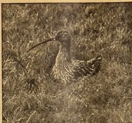
Grosser Brachvogel ( Numenius arquatus , (L.)), mit halbgeschlossenen Augen sitzend.