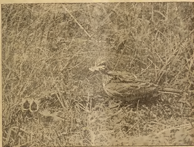
Feldlerche ( Alauda arvensis , L.), ihren Jungen Futter bringend.

Das Buch bringt eine grosse Anzahl vorzüglicher photographischer Aufnahmen frei lebender Tiere, die durch einen äusserst ansprechenden Text erläutert werden. Der Text ist nicht in wissenschaftlicher Weise geordnet, sondern im Plaudertone gehalten, zeugt