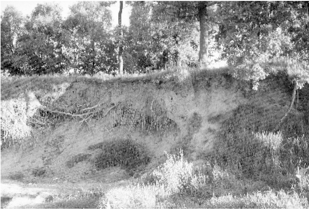
Abb. 2: Eisvogel-Brutwand an der Hase in Eversburg/Pye.

3. Düte südlich der Lengericher Landstraße Ab Mitte März wurden bei zwei Begehungen jeweils zwei Eisvögel im Bereich des Hörner Weges beobachtet. Hier standen auch potenzielle Bruthabitate zur Verfügung. Später gelangen in diesem Bereich keine Beobachtungen mehr, dafür wurden Vögel ab Anfang April regelmäßig weiter bachabwärts gesichtet. Anfang Mai wurde eine beflogene Brutröhre an einem Steilufer innerhalb eines Waldbereiches gefunden. Direkt neben der besetzten Röhre befand sich eine weitere Röhre. Bis mindestens zum 10. Juni hielten sich Altvögel in diesem Revier auf.