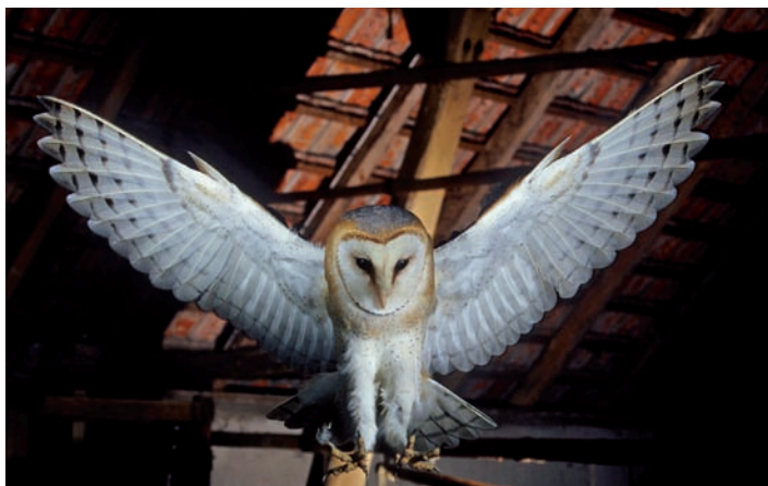
Abb. 1: Die Schleiereule ist in Mitteleuropa sicher der heimlichste Kulturfolger und heute an – meist landwirtschaftlich genutzte – Gebäude gebunden.