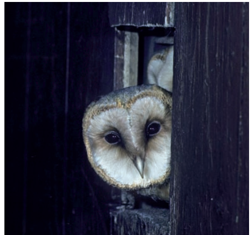
Abb. 2: Eine fast flügge Schleiereule wartet auf Futter.

Genmaterials in der Brut gesichert zu wissen, bedarf es einiger Anstrengungen der Männchen. Schließlich ist es wirkungslos, die Jungvögel anderer Männchen aufzuziehen und dabei noch seine eigene Fitness zu riskieren. Das Männchen ist demnach gut beraten, sein Weibchen nicht nur zu versorgen, sondern auch zu bewachen, zumindest solange die Eier im Körper des Weibchens noch befruchtet werden müssen. Das bestätigten auch unsere Beobachtungen. Bevor die Weibchen unserer sendermarkierten Schleiereulen nicht alle Eier gelegt hatten, ließen die Männchen diese relativ selten aus den Augen. Und sie taten offensichtlich gut daran, denn wir konnten mehrfach beobachten, dass unbeachtete Weibchen Besuche von einem oder