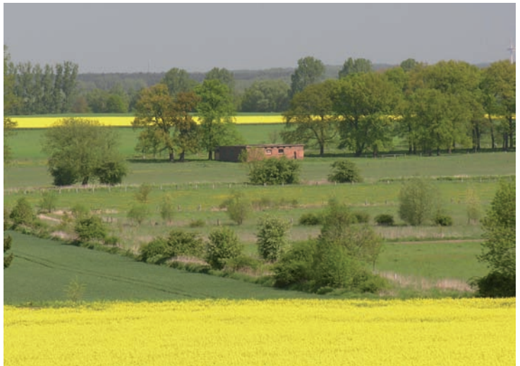
Abb. 3: Reich strukturierte, offene bis halboffene Landschaften wie hier am Steinhuder Meer sind der Lebensraum der Schleiereule. Hier finden die Vögel ausreichend Nahrungstiere, vor allem Kleinsäugetiere, die sie im Suchflug oder von einem Ansitz aus erbeuten.

reich werden „Konkurrenten“ vom Männchen verscheucht. In den Jagdgebieten jagen jedoch oftmals mehrere Schleiereulen nebeneinander. Nahrung scheint dann keine Ressource zu sein, um die sie sich streiten müssen. Kein Wunder, denn in Feldmausjahren ist die Dichte der Kleinsäuger und deren Fortpflanzungspotential so groß, dass selbst eine große Ansammlung von Beutegreifern die Mäuseflut nicht einzudämmen vermag. Die Mäuse gehen letztlich an intraspezifischen Faktoren und Krankheiten zu Grunde, nicht aber durch den Druck der Räuber. Wozu also Energie und Zeit aufwenden, um ein lohnendes Jagdgebiet zu verteidigen und zusätzlich ein Verletzungsrisiko in Kauf zu nehmen? Da Schleiereulen vergleichsweise große Aktionsräume nutzen (das ist der gesamte von der Eule frequentierte Bereich; ein Revier setzt immer eine Gebietsverteidigung voraus), ist es ohnehin nicht möglich, diese effektiv zu verteidigen: Nach unseren Ergebnissen umfassen die Aktionsräume allein für