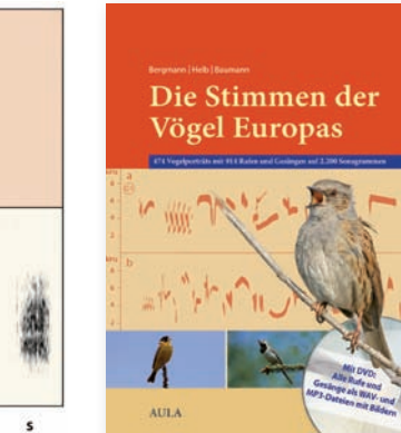
Abb. 6: Das neue, erheblich erweiterte Vogelstimmenbuch mit DVD.

genden reichhaltigen Tonaufnahmen und der Beschaffung der Bilder, im Wesentlichen auch in Form seiner eigenen Sammlung (vgl. Abb. 5). Mein Einsatz lag vorrangig bei den Texten und Korrekturen. Im Frühjahr 2008 konnten wir und die interessierten Vogelkundler das Werk dann fertig in Händen halten (s. Abb. 6).