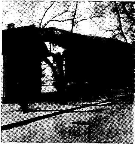
3) Bitte, nicht so! Schwer geschädigtes Straßenbild!

vor einem Jahr an der Ahornallee in der Schloßgasse in Lienz geschah, ist unentschuldig. Man hätte die, die wirklich zuviel Schatten machten, ganz entfernen sollen; andere hätte man rücksichtsvoll und mit einiger Behutsamkeit lichten, mehrere hätten ganz unberührt bleiben können, weil sie niemanden störten. Diese Empfehlung wurde vom Naturschutzbeauftragten auch rechtzeitig gegeben. Es wurden trotzdem alle Ahorne wirklich übel zugerichtet. Der schönen Allee und dem Straßenbild wurde damit ein nicht wieder gutzumachender Schaden zugefügt. Schöner Heimat? Siehe Bild 3!