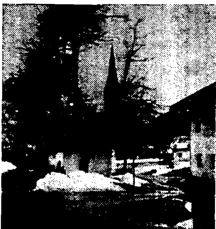
4) Bitte, nicht so! Eine schwer verstümmelte Linde klagt an!

Wenn schon die Erwachsenen so unter den Bäumen hausen, dann kann man von der Jugend noch weniger Verständnis erwarten. Und doch ist es unerlässlich, sie immer wieder unermüdlich zum Schutze der Natur und des Landschaftsbildes aufzurufen. Es ist beschämend, daß immer wieder die mit Mühe und großen Kosten im Stadtbereich gepflanzten Jungbäume abgeschnitten oder abgebrochen werden, wie dies z. B. auf dem Wassergraben der Fall war; auch die erst vor