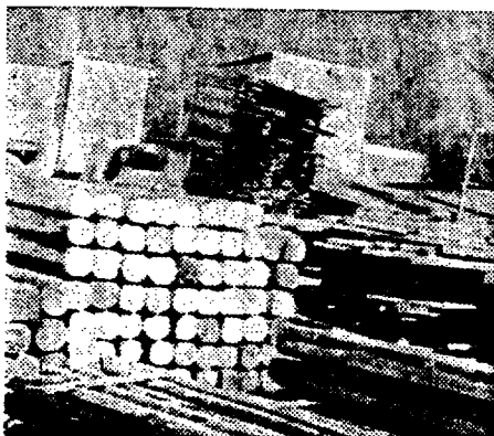
Ein häufiger, aber unschöner Anblick

Was werben heißt, haben uns erst die letzten Jahre gelehrt. Zwar sieht es mit den öffentlichen Werbemethoden anderswo noch schlimmer aus als bei uns, aber zunächst haben wir doch Ursache, vor der eigenen Tür zu kehren. Was sich da längs der Straßen