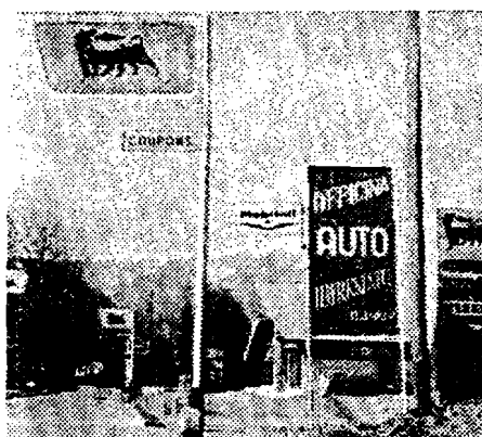
Landschaft - auf den Hund gekommen

im Laufe der Zeit alles ansammelt, spottet fast der Beschreibung. Wie sehen oft und oft die Richtungspfeile aus, die auf Zimmervermietung hinweisen! In Form und Farbe, sogar nicht allzuseiten auch in der Rechtschreibung sind viele zu bemängeln.